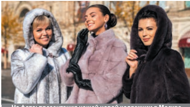
На фото: презентация нашей новой коллекции в Москве

Федеральная сеть «Столица МЕХА» объявляет грандиозную распродажу шуб со складов кировских и пятигорских фабрик: «БАРС», «Столица МЕХА», «Славяна», «Меховые Мастера» и других! Только одна выставка, где вы сможете приобрести большинство моделей из наших коллекций 2020 года практически ПО СЕБЕСТОИМОСТИ!