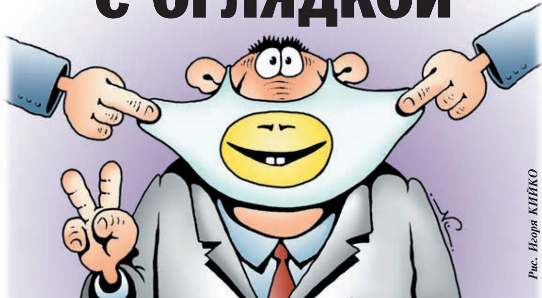
Рис. Игоря КИЙКО

Выдержат ли наши предприниматели ещё один карантин по «ковиду»?