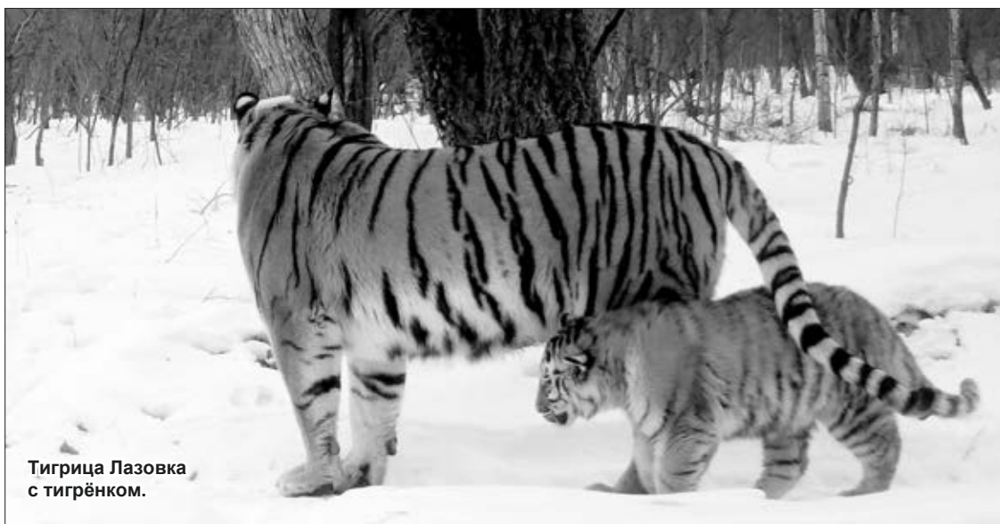
Тигрица Лазовка с тигрёнком.

Тигров, прошедших реабилитацию, стали выпускать