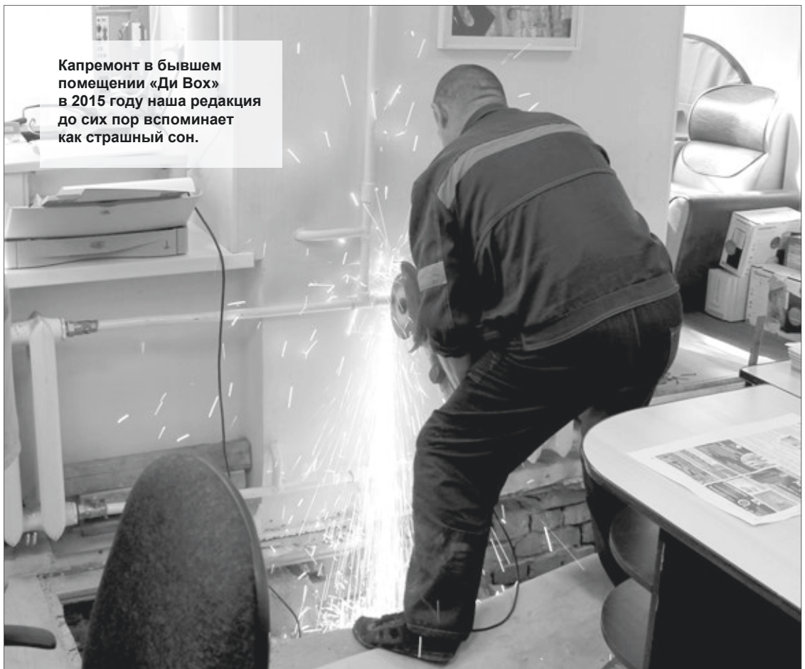
Капремонт в бывшем помещении «Ди Вох» в 2015 году наша редакция до сих пор вспоминает как страшный сон.

Объём работ на них был разный. Почти везде при-