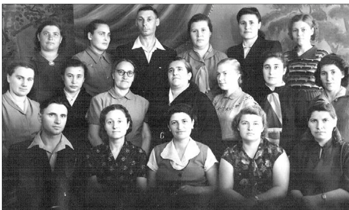
Педагогический коллектив школы №9 в 1962 году.