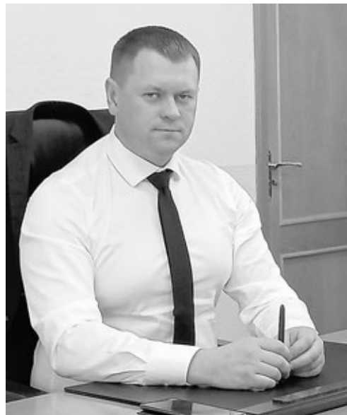
Мэр Биробиджана Александр Головатый.

нарушается грубо и неоднократно, люди начинают бить в колокола, информация доходит до нас — и мы принимаем определённые меры реагирования, но это история долгоиграющая. Много было разговоров о том, что напрасно приглашали частных перевозчиков, которые никому не подвластны. Чтобы взять исполнение графика перевозок под тотальный контроль, есть много программных продуктов, компьютерных систем, позволяющих обеспечить передачу сигнала с того или иного автобуса в режиме реального времени с привязкой к конкретной точке и расписанию. Почему же мы не используем эти технологии? Существует Федеральный закон № 220-ФЗ «Об организации регулярных перевозок пассажиров и багажа автомобильным транспортом и городским наземным электрическим транспортом в Российской Федерации». Согласно ему перевозчик определяется конкурентным способом, то есть в соответствии с Федеральным законом № 44. Мы должны сформировать максимальную цену контракта на право обслуживания маршрута и разместить её на электронных торгах. У нас перевозчики имеют только маршрутные карты — стало быть, они не обременены какими-либо обязательствами.