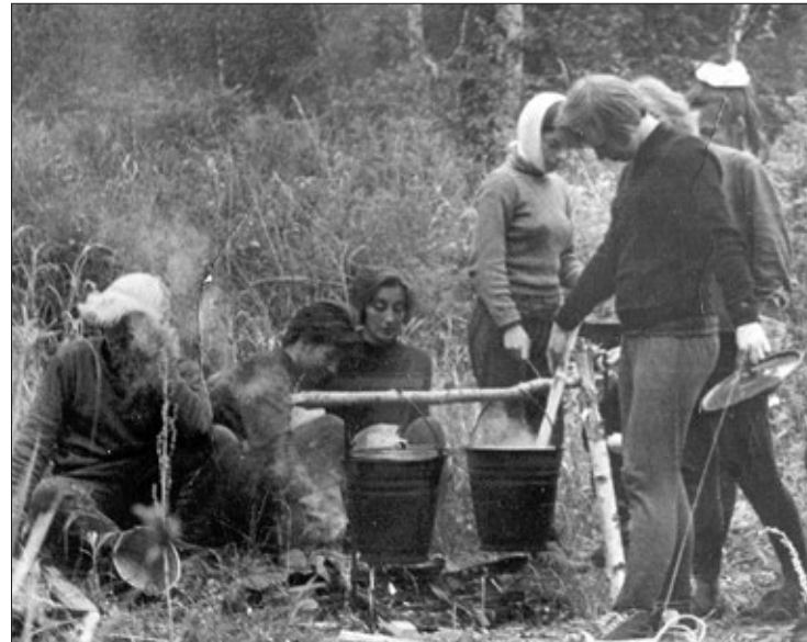
На краевых туристических слётах 9-я школа занимала первые места.