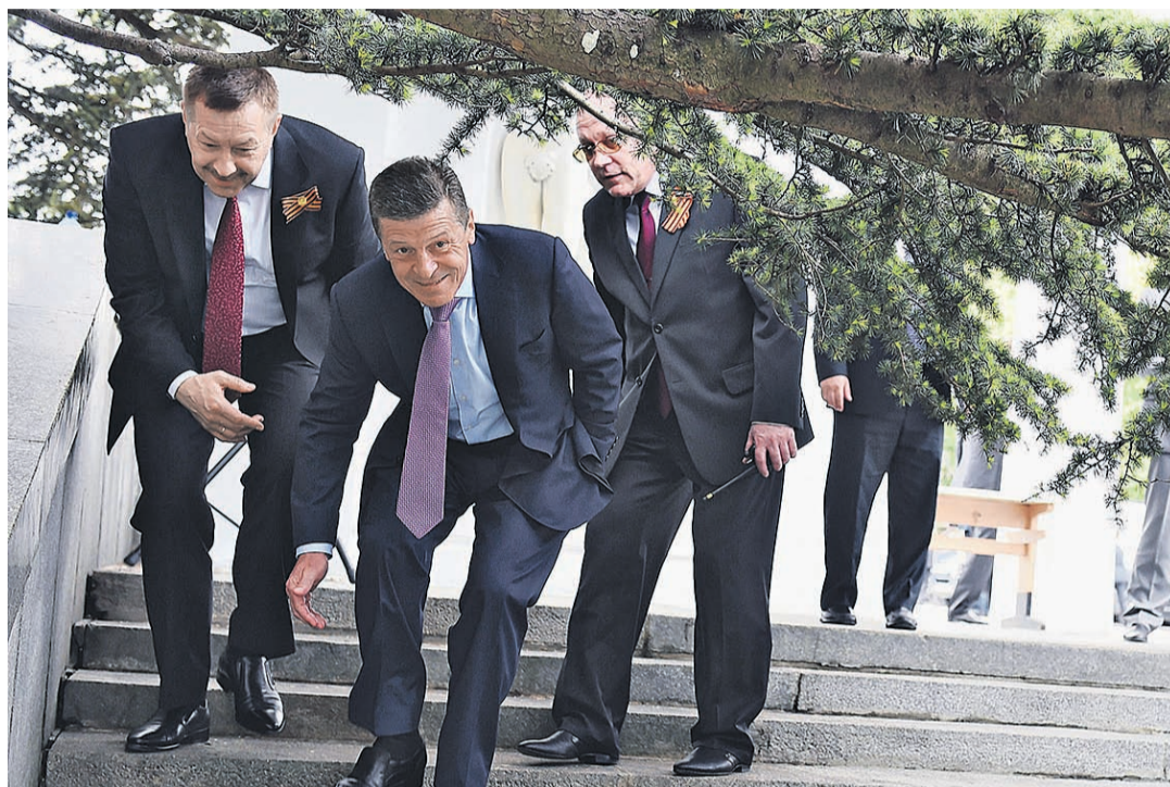
Главный итог работы Минкрыма — подготовка ФЦП по развитию полуострова до 2020 года (на фото в центре — вице-премьер Дмитрий Козак, курирующий в правительстве Крым и Севастополь)

Пресс-секретарь премьера Наталья Тимакова эти сообщения не прокомментировала.