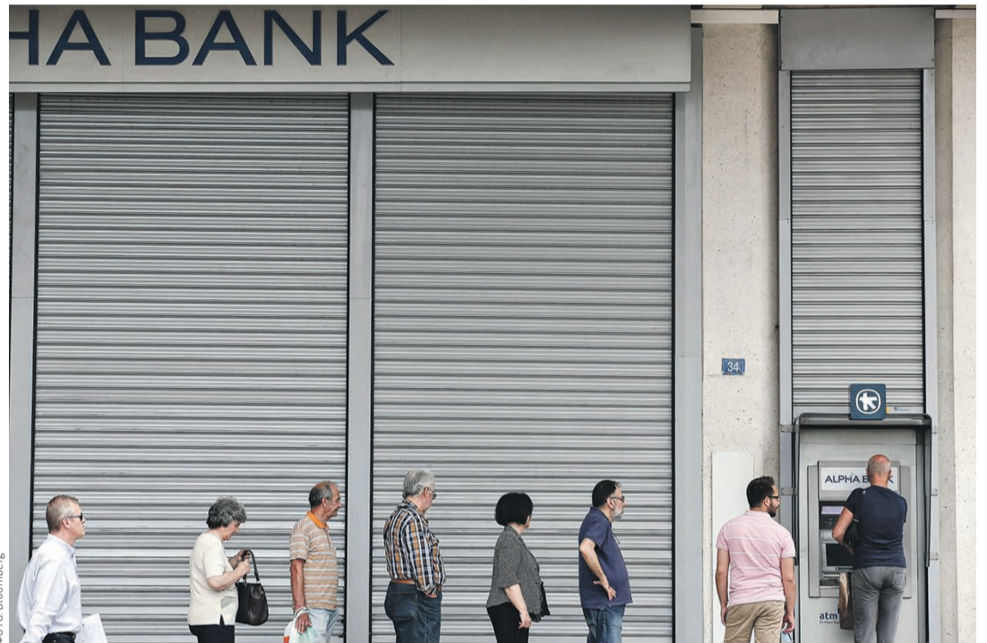
На время банковских каникул в Греции выдача наличных по картам ограничена €60 в день

Самые большие очереди были в ночь, когда объявили о референдуме, вспоминает сторонница выхода