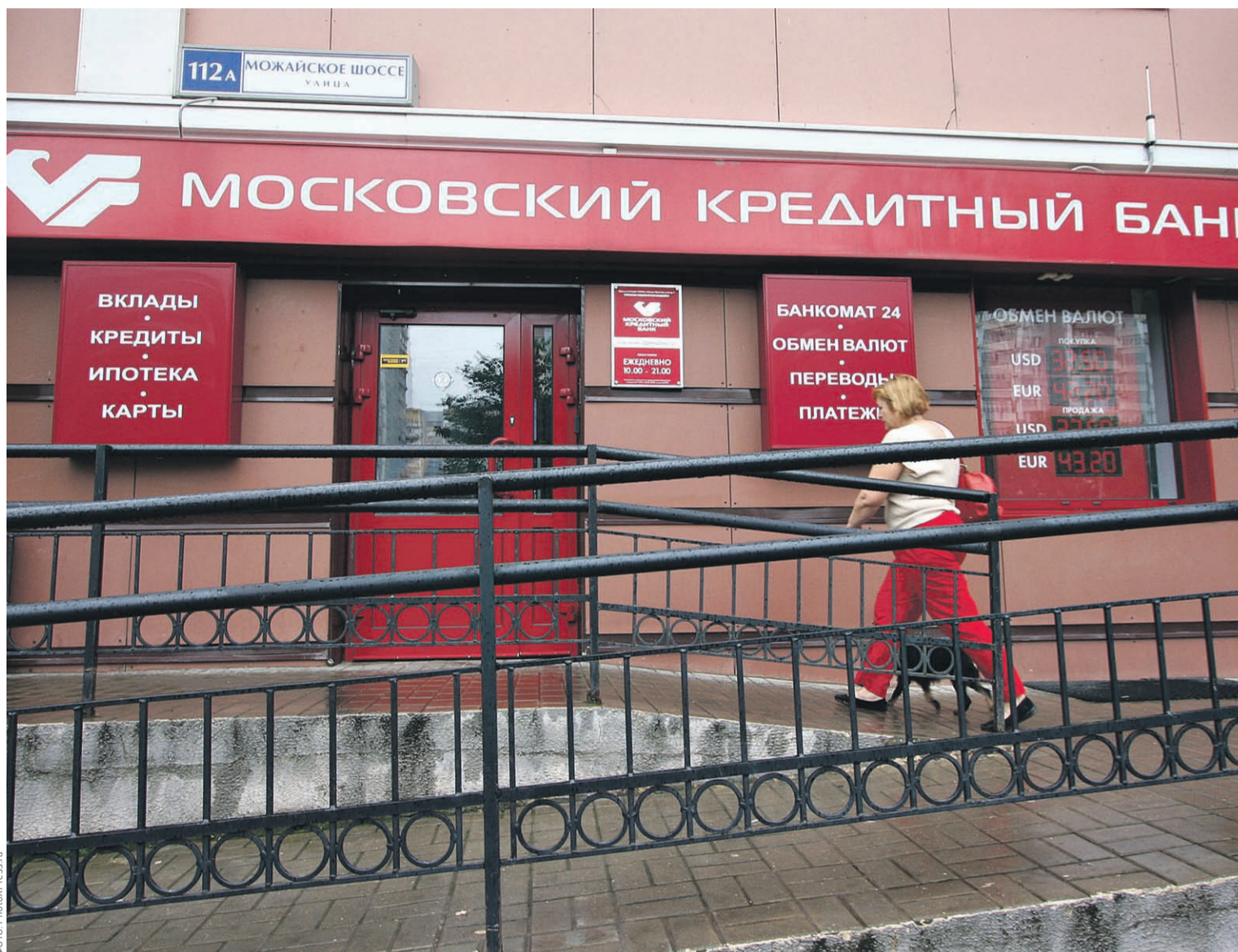
Торги акциями Московского кредитного банка на бирже начнутся 1 июля

IPO на Московской бирже МКБ начал 22 июня. Банк оценил себя в 0,93 капитала (выше Сбербанка) — почти в 97 млрд руб. То есть было продано около 14% увеличенного уставного капитала.