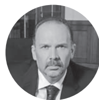
Михаил Мень Министерство строительства и ЖКХ

+7 (495) 363 11 11 #1610, bc@rbc.ru, bc.rbc.ru