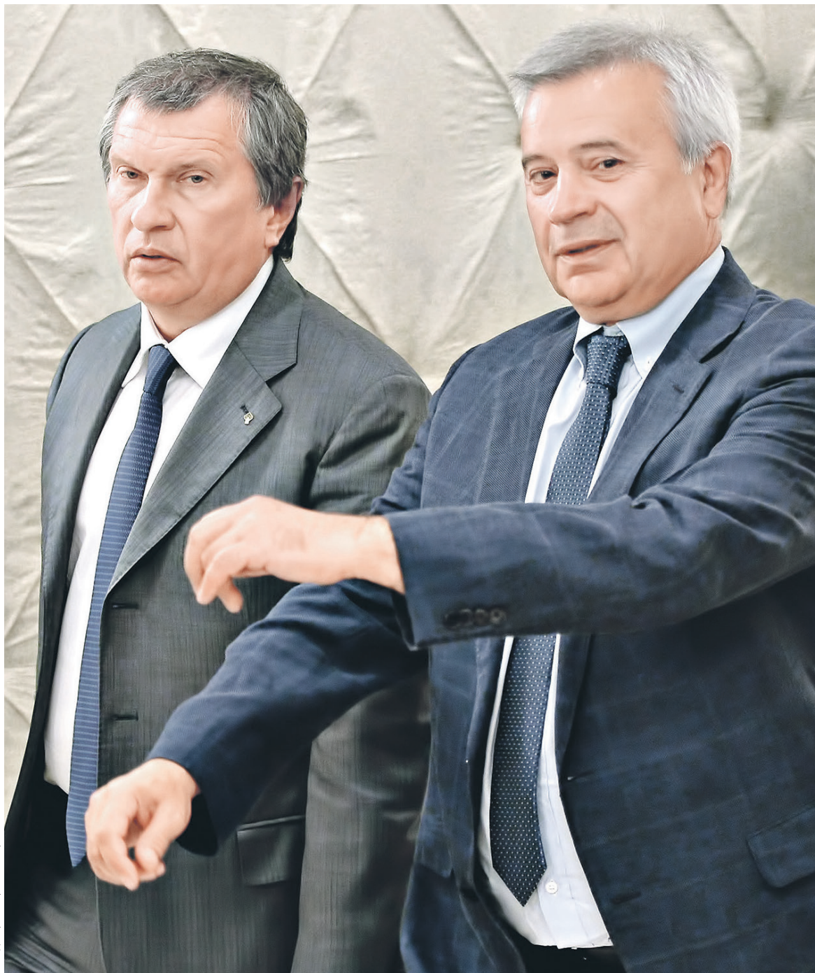
Из-за падения цен на нефть, роста налоговой нагрузки на отрасль и международных санкций освоение месторождений на шельфе серьезно замедлилось (на фото слева направо: главы «Роснефти» Игорь Сечин и ЛУКОЙЛа Вагит Алекперов)

Закон об осуществлении мер стимулирования деятельности по добыче углеводородного сырья на шельфе, принятый в сентябре 2013 года, устанавливает особый налоговый режим для новых месторождений на шельфе (в Арктике, Балтийском, Каспийском и других морях) — специальные ставки по НДПИ и обнуление пошлин на определенный период. Но с момента принятия этого закона более чем вдвое упали цены на нефть (в пятницу нефть марки Brent стоила $46,38 за баррель, в сентябре 2013 года — более $106 за баррель), выросли затраты компаний из-за инфляции, а также увеличилась налоговая нагрузка на отрасль и резко сократились доходы компаний, указывается в письме нефтяников. К тому же после введения международных санкций против российских нефтегазовых компаний в 2014 году был ограничен доступ к мировым финансовым рынкам, а также пришлось сократить