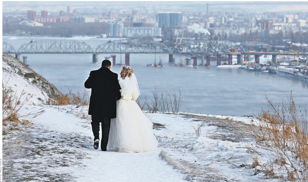
Поправки, вводящие новый вид банковского договора, вносятся в ст.845 Гражданского кодекса. Из них следует, что владельцами совместного счета могут быть только физлица

Поправки, вводящие новый вид договора банковского счета, вносятся в ст.845 Гражданского кодекса. Из них следует, что владельцами совместного счета могут быть только физлица. Права на находящиеся на счете средства будут принадлежать держателям пропорционально объему внесенных ими денег.