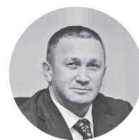
Герман Елянюшкин* Правительство Московской области