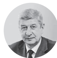
Сергей Лёвкин Департамент градостроительной политики города Москвы