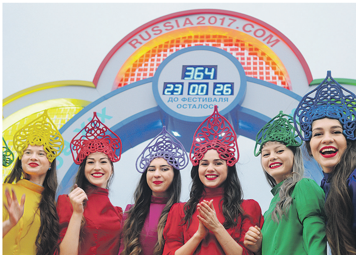
Деньги на 19-й Всемирный фестиваль молодежи и студентов в Сочи все-таки нашли

О необходимости «рассмотреть вопрос» о финансировании фестиваля говорится и в решении