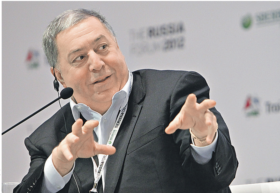
В интервью РБК Михаил Гуцериев говорил, что оценивает всю «РуссНефть» в $4–5 млрд. «После того как выйдем на рынок, получим реальные цифры ее стоимости», — отмечал он

Обыкновенные акции составляют около 75% капитала компа-