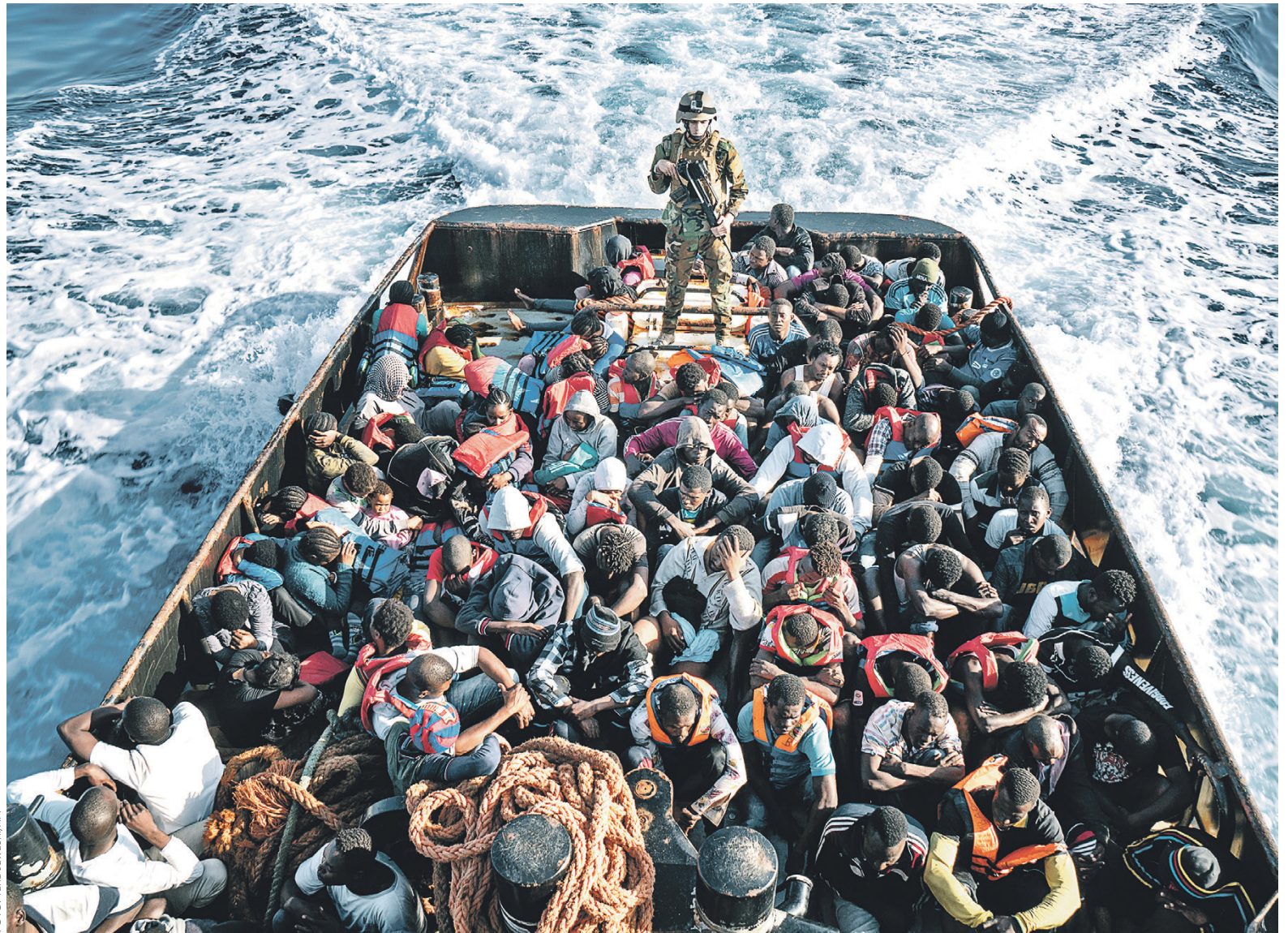
Через Ливию в Европу пытаются в основном пробраться граждане Нигерии, Бангладеш и Гвинеи

Так называемый центрально-средиземноморский маршрут, по которому нелегалы через Ливию движутся в Европу, является