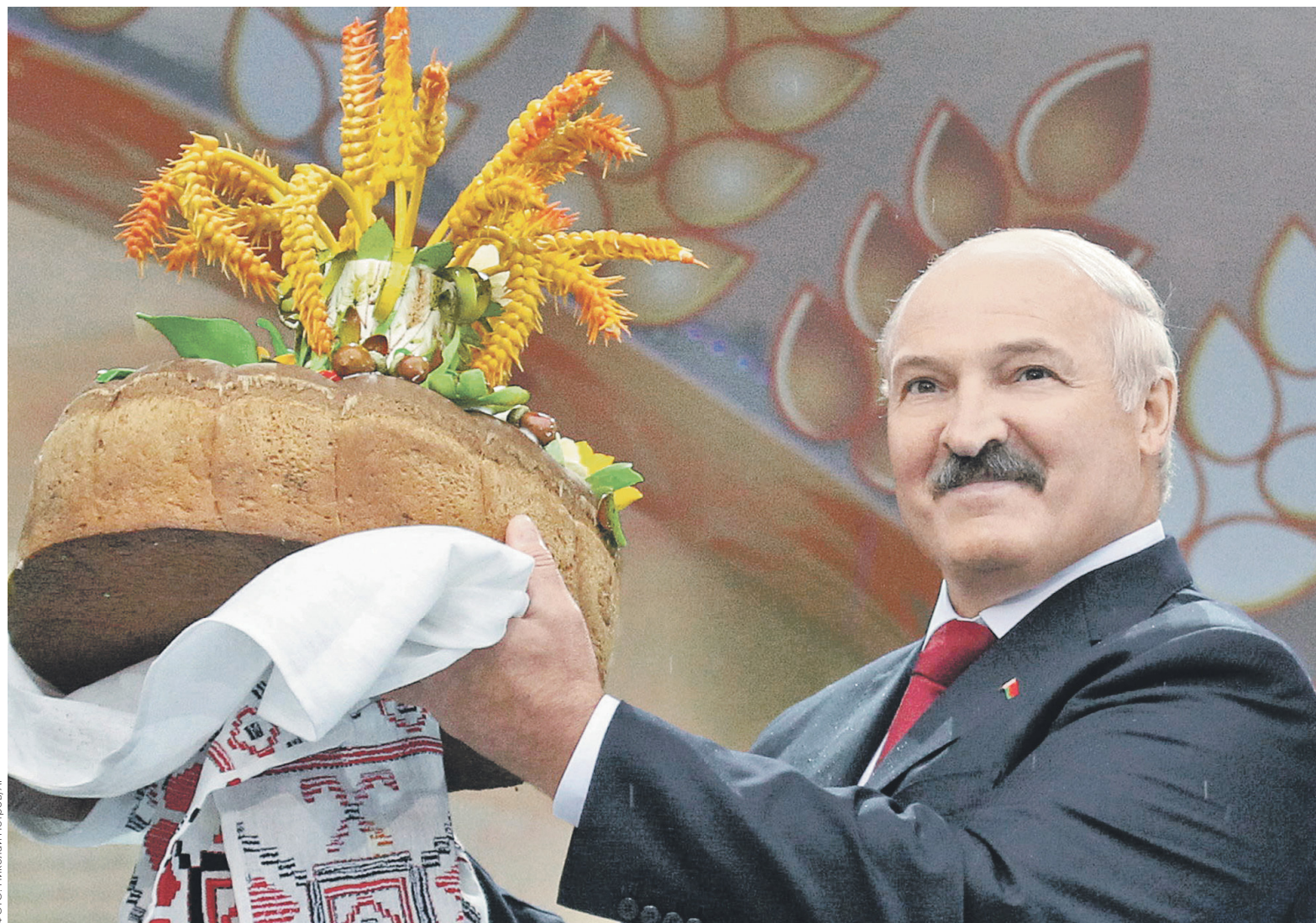
Предприятие «Белтаможсервис», которое российские контролирующие органы подозревают в участии в поставках санкционной продукции на территорию России, было учреждено Государственным таможенным комитетом Белоруссии в 1999 году. На фото: президент Белоруссии Александр Лукашенко