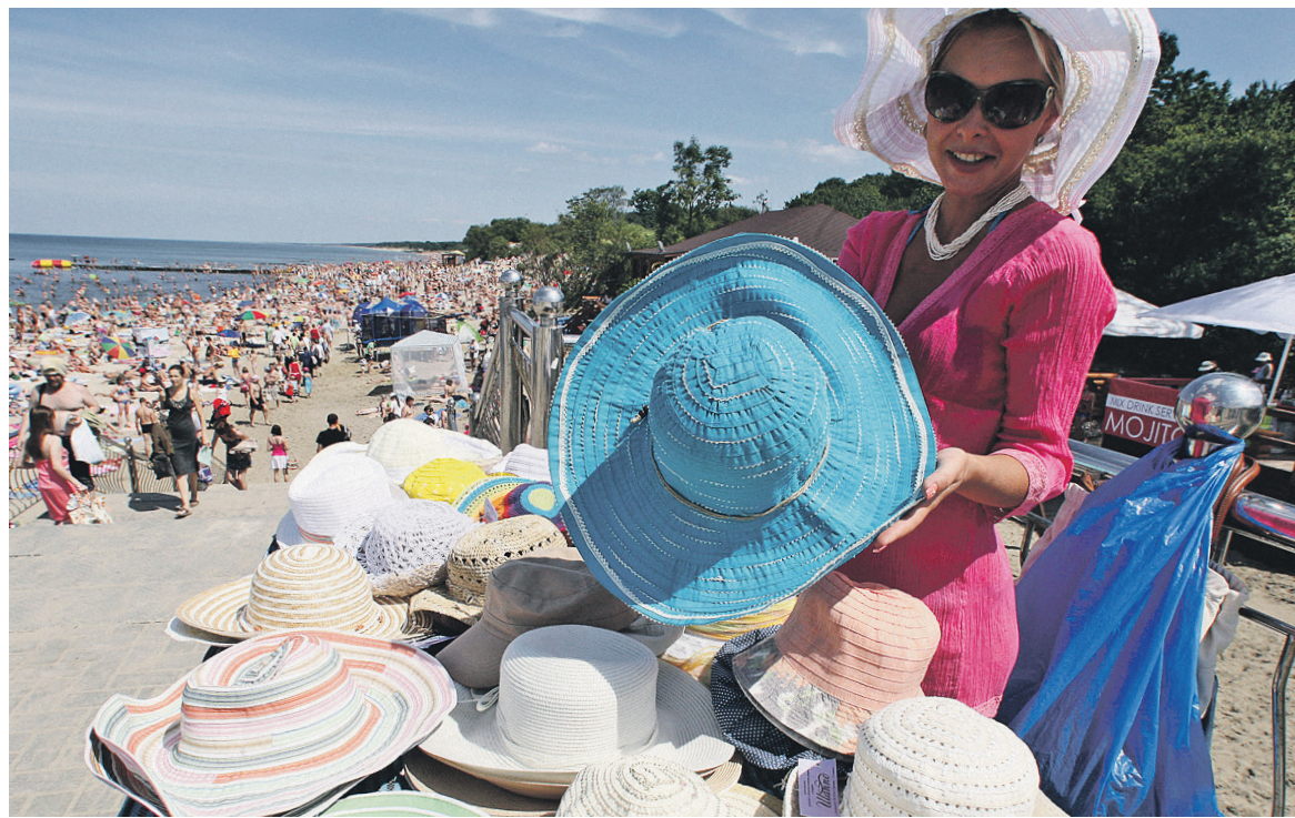
Больше всего занятость в неформальном секторе характерна для южных регионов. Среди отраслей по неформально занятым лидируют сферы торговли и ремонта, сельское хозяйство и строительство

По данным Росстата, скрытый фонд оплаты труда в стране постоянно растет: с 2011 года он увеличился с 6,3 трлн руб. (10,6%