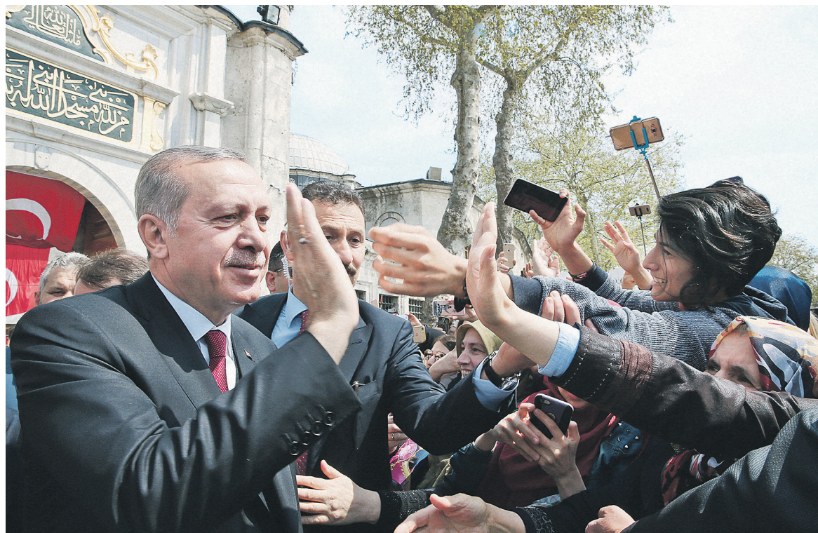
Референдум по переходу Турции на президентскую форму правления с парламентской завершился победой сторонников Эрдогана с незначительным перевесом голосов: за расширение полномочий президента проголосовали 51,41% избирателей, 48,59% — против