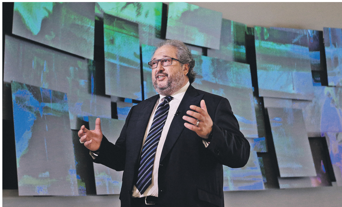
O1 Properties основана бывшим акционером ФК «Открытие» Борисом Минцем в 2010 году. Сегодня компания владеет и управляет портфелем из 15 бизнес-центров чистой арендуемой площадью 584 тыс. кв. м