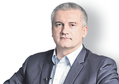
Сергей Аксенов, глава РБК

ЕЖЕДНЕВНАЯ ДЕЛОВАЯ ГАЗЕТА 21 апреля 2017 Пятница № 71 (2568)