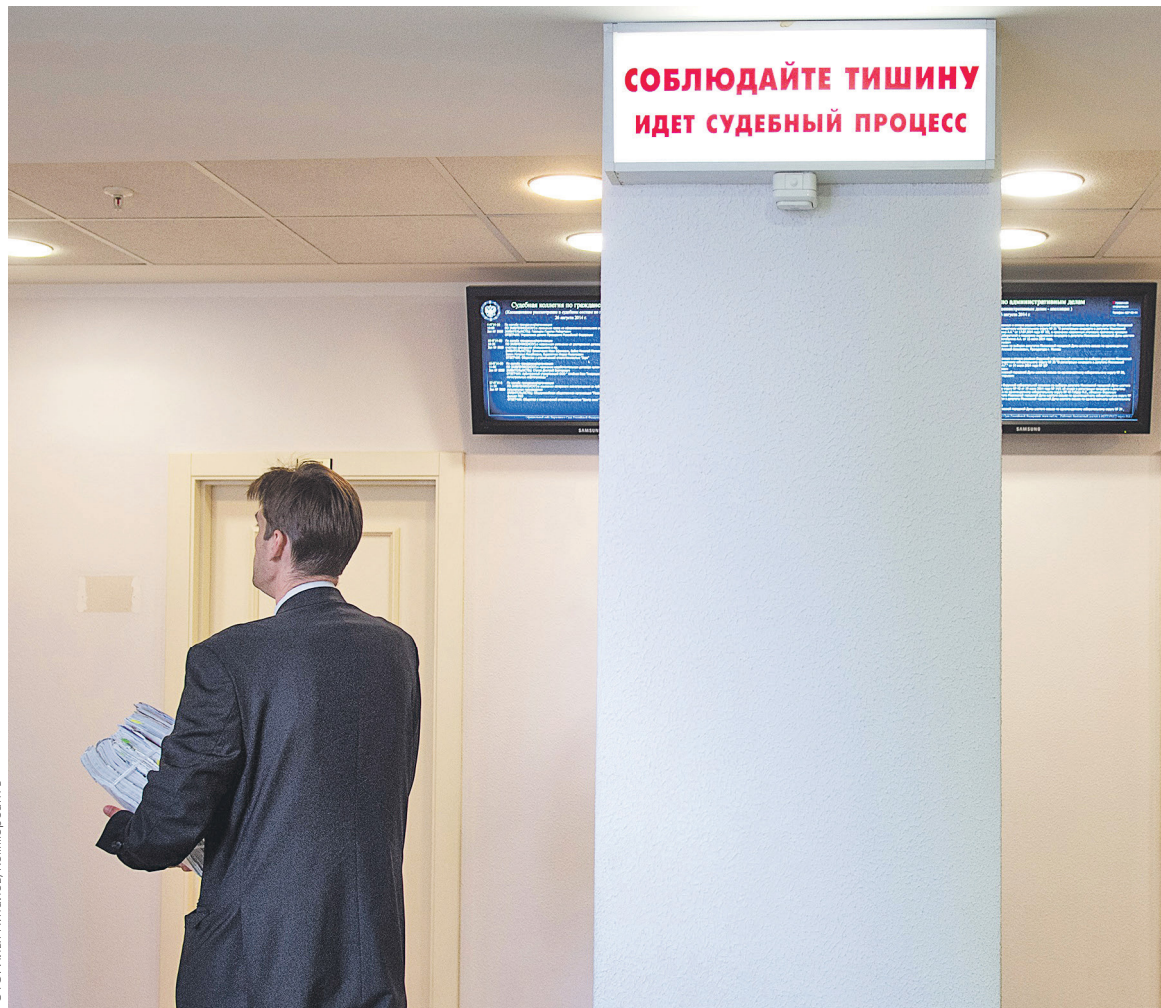
Согласно новому подходу, банк при наличии подозрений осуществляет платеж по исполнительному листу и одновременно информирует об этом Росфинмониторинг и только после этого принимает меры, направленные на прекращение отношений с клиентом

О подозрительности операций списания средств по исполнительным листам, согласно рекомендациям ЦБ, свидетельствует то, что по банковским счетам «должников» и (или) «взыскателей» рас-