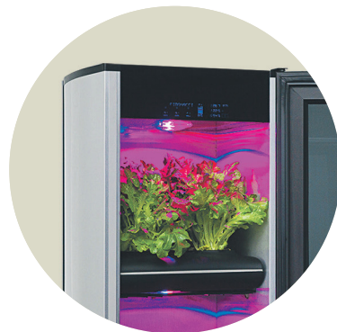
Средняя домашняя агроферма Fibonacsi — шкаф размером с холодильник

Продажи установок стартовали 20 марта 2017 года. Пока удалось реализовать пять агрегатов. Помимо этого подписано несколько договоров с партнерами и дилерами в Москве, а также дистрибьюторами