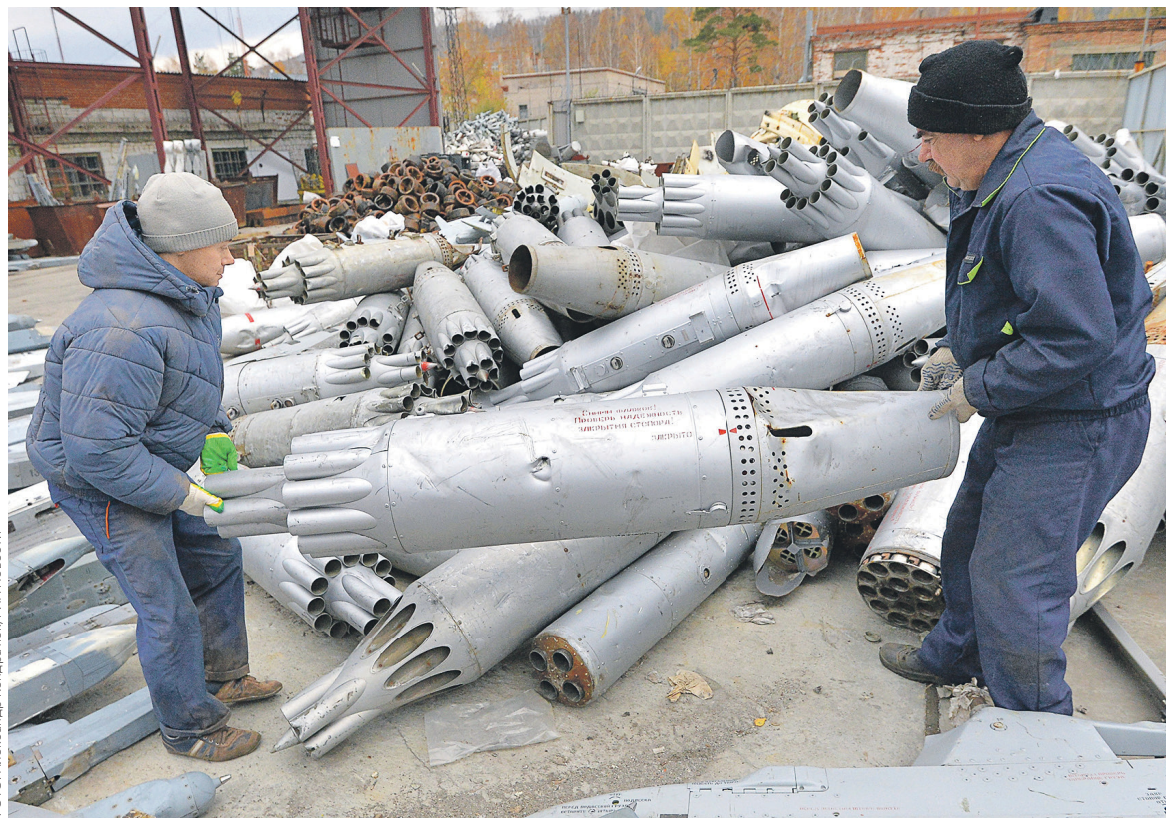
В 2017 году Минобороны планирует избавиться от 230 тыс. т металлолома

Письмо главы департамента Минобороны было составлено в ответ на поручение рассмотреть проект президентского указа, который, как писал ранее РБК, предоставляет Министерству обороны право реализовать ломозаготовительной компании «Транслому» лом черных и цветных металлов, образованных от утилизации военной техники, по рыночной стоимости без проведения торгов. Сейчас