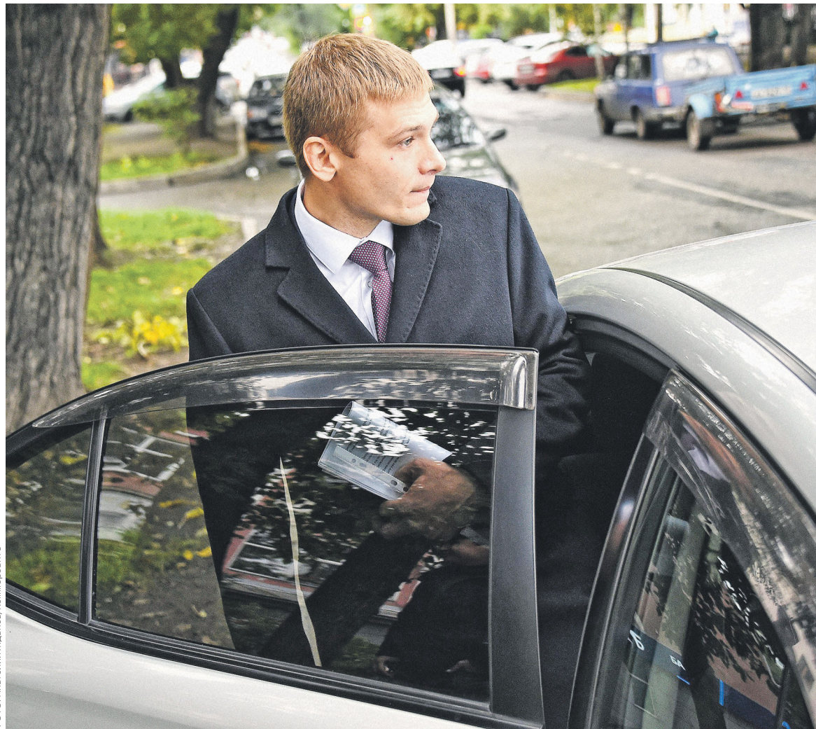
Лидер первого тура на выборах главы Хакасии коммунист Валентин Коновалов считает позицию избиркома республики противоречащей нормам закона

9 сентября, в первом туре выборов, Коновалов набрал 44,8% голосов, обойдя действующего главу региона Виктора Зиминова, получившего 32,42%. Второй тур был назначен на 23 сентября, но за два дня до этого Зимин заявил, что снимает свою кандидатуру «по состоянию здоровья», а позже сообщил, что сделал это, не желая допустить