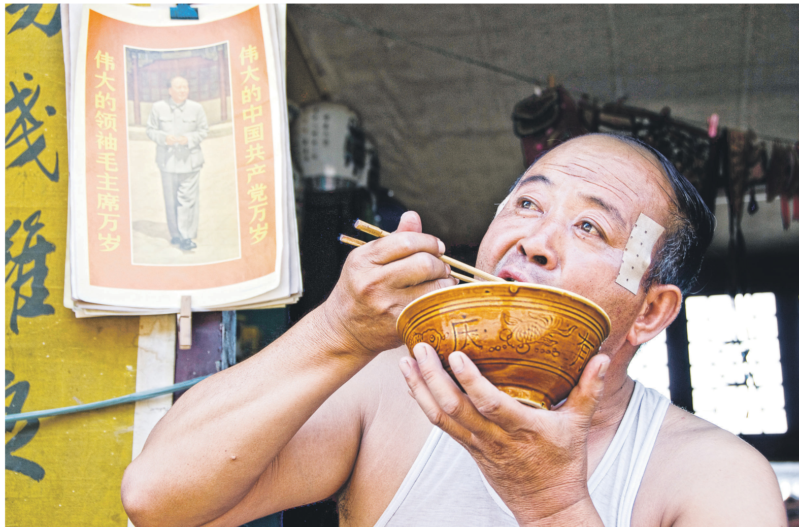
В прошлом году Китай закупил российских продуктов на $1,7 млрд, уступив по объему импорта только Египту