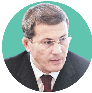
Врио главы Республики Башкортостан Радий Хабиров

Отставка Хамитова связана и с электоральными рисками. Кремль убедился, что наличие внутриэлитных конфликтов в регионе и неурегулированных отношений с федеральными бизнес-группами может быть использовано недовольной частью элит для того, чтобы разжечь протестное голо-