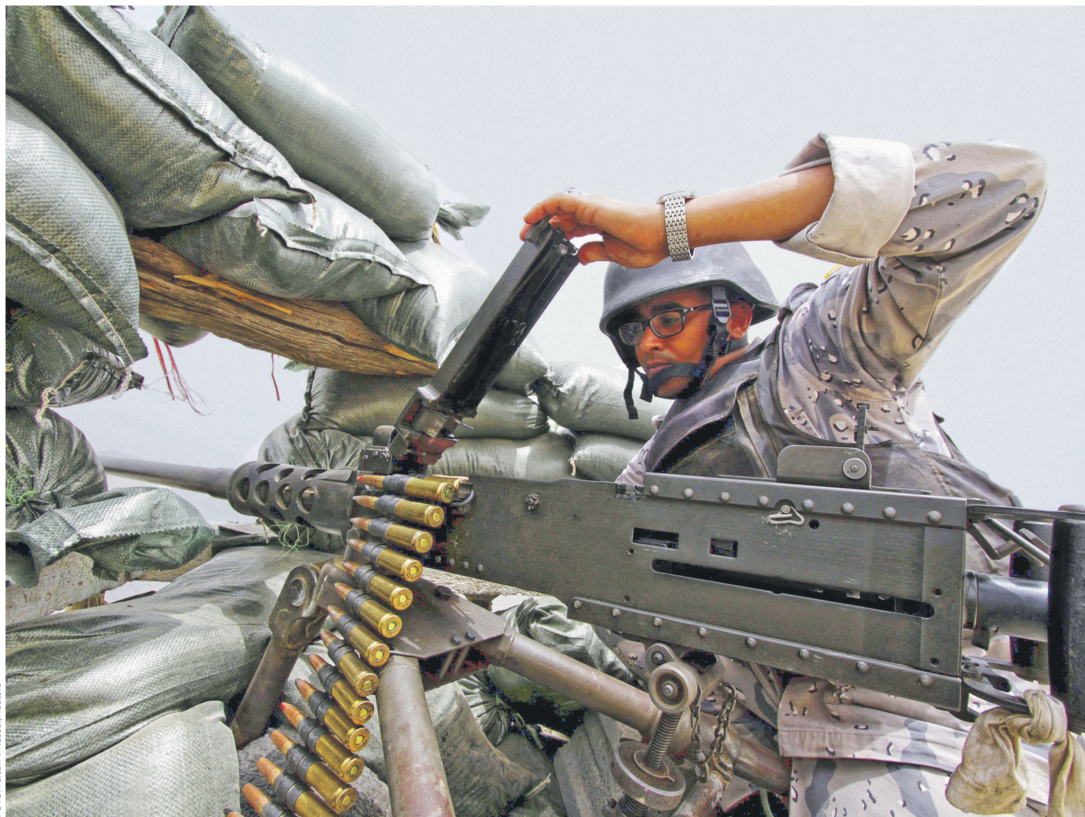
После пропажи саудовского журналиста Джамала Хашкаджи сенаторы США призвали приостановить военное сотрудничество с королевством. Сейчас Саудовская Аравия является крупнейшим импортером американского оружия

Об обращении сенаторов стало известно в четверг, спустя почти десять дней с момента исчезновения журналиста. Некоторые из них призвали приостановить военное сотрудничество с королевством. «До тех пор пока мы вооружаем их и оказываем им поддержку, саудовцы продолжают убивать простых граждан и журналистов. Президент должен немедленно приостановить продажу оружия и военную помощь Саудовской Аравии», — написал 11 октября сенатор-республиканец Рэнд Пол в своем Twitter. «Если этот человек был убит в саудовском консульстве в Стамбуле, это перейдет все границы, которые установлены в международном сообществе», — возмутился сенатор-республиканец Линдси Грэм, который ранее неоднократно защищал партнерство США с Эр-Риядом.