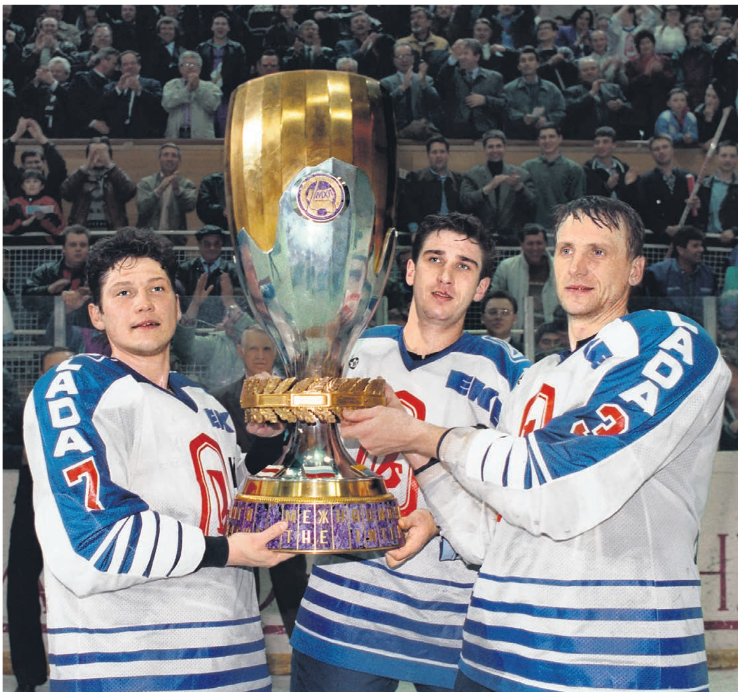
Тольяттинская «Лада», исключенная из числа участников чемпионата КХЛ, дважды — в 1994 и 1996 годах — выигрывала чемпионат России