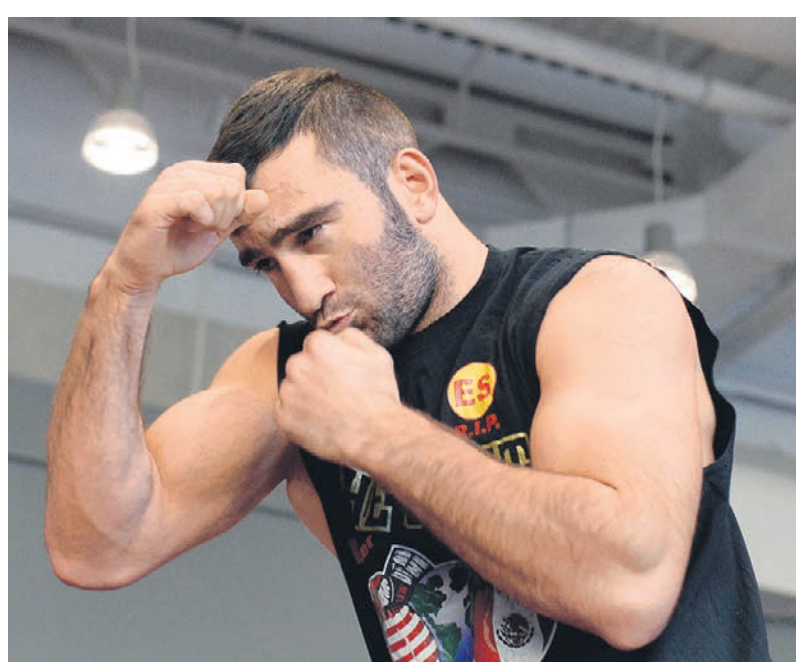
Федерация бокса России пытается добиться проведения главного боя в карьере Мурата Гассиева в России

Бой будет финальным в чрезвычайно масштабном проекте. World Boxing Super Series — это два турнира с участием 16 сильнейших бойцов