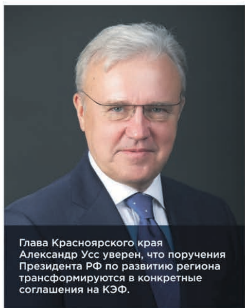
Глава Красноярского края Александр Усс уверен, что поручения Президента РФ по развитию региона трансформируются в конкретные соглашения на КЭФ.