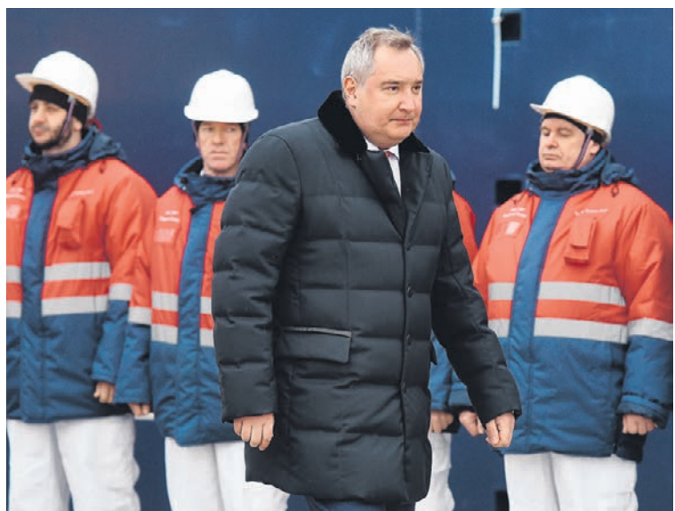
Дмитрий Рогозин призвал космическую промышленность поработать на нефтегазовый сектор

В аппарате вице-премьера от комментариев отказались. Ис-