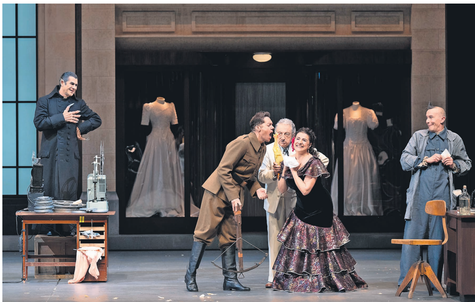
Поскольку действие перенесено в киностудию, в образах действующих лиц перемешаны и ужас, и мелодрама

Со стилем скорее повезло: в энергичном, поджаром звучании Les Musiciens du Prince есть блестящая «исторически информированная» выучка, есть отточенная фразировка и динамика, но все же есть и то непреодолимое россиниевское blo , без которого никакая режиссура «Цирюльника» не спасет. Да, у натуральной меди были помарки, а пару раз отчаянно стреми-