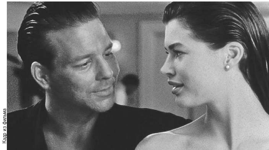
В 1989-м на съемках «Дикой орхидеи» он встретил Кэрри Отис, которая стала главной любовью его жизни.

В кино он быстро добился успеха. Его начали замечать уже в первых фильмах - Поллин Кейл , самый знаменитый критик той