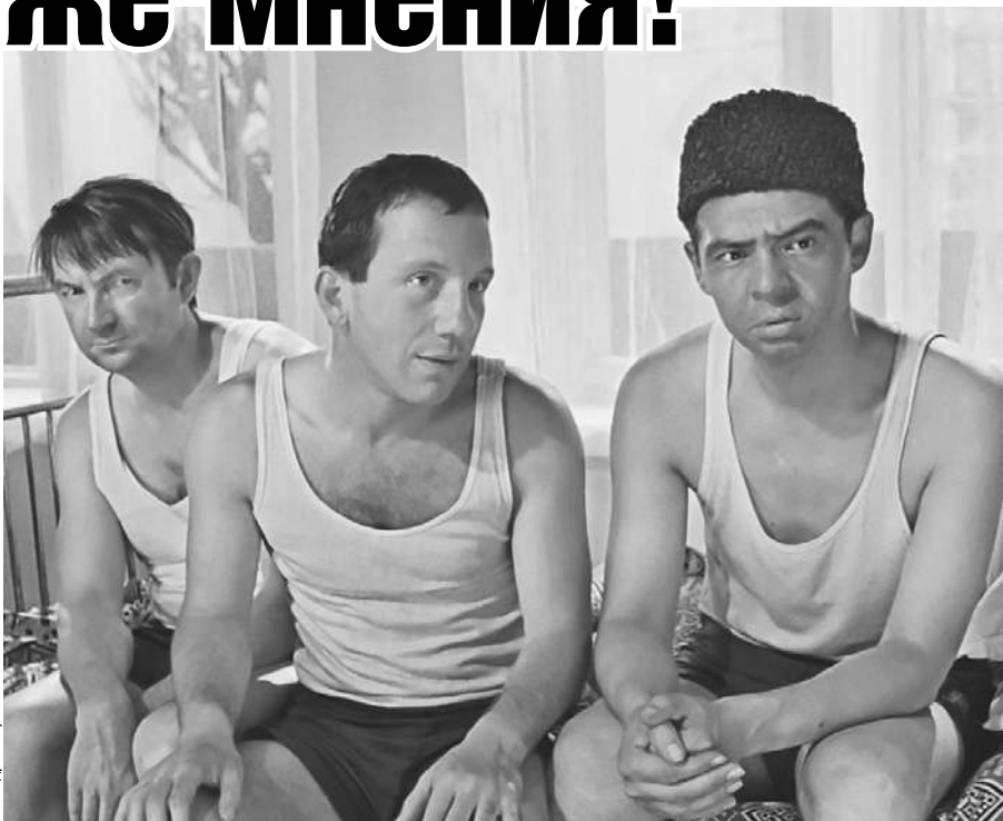
Как говорил легендарный Василий Алибабаевич из «Джентльменов удачи»: «Все побежали, и я побежал». Это и есть самая лаконичная формулировка психологического «эффекта толпы».

«Комсомолка» вспомнила пять самых известных социальных экспериментов, которые показывают, что заставляет одних людей подчиняться другим и обманывать самих себя.