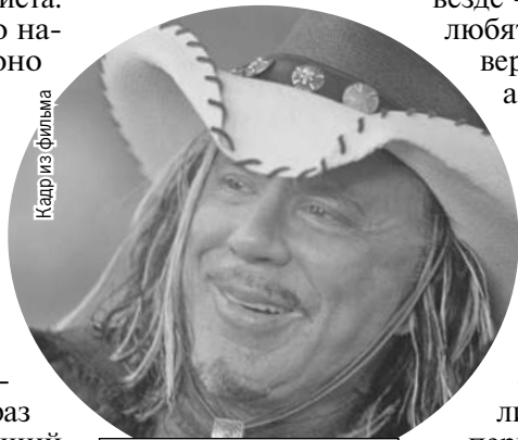
Бокс и неудачная пластика лишили Микки его неотразимой внешности.

пору, писала: «У него есть напор, есть магнетизм, и при этом - неожиданно - чистая, милая улыбка». Одна большая картина следовала за другой: « Жартела » Лоуренса Каздана , « Бойцовая рыбка » Копполы , « Год дракона » Майкла Чимино . Потом появились « 9 1/2 недель » - они казались неприличными не только посетителям советских видеосалонов, но и американским прокатчикам и пролежали на полке три года. А потом, перед выпуском,