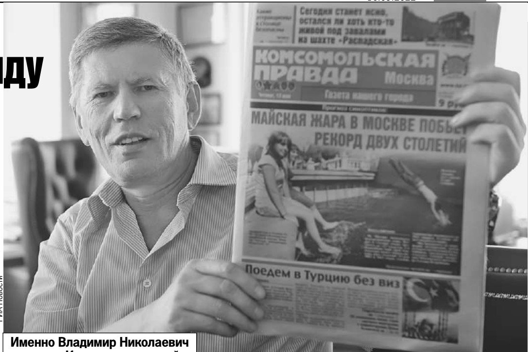
Именно Владимир Николаевич создал «Комсомолку» такой, какой ее любят миллионы читателей.

Он парень из простой семьи. Отец был краеведом. Володя у