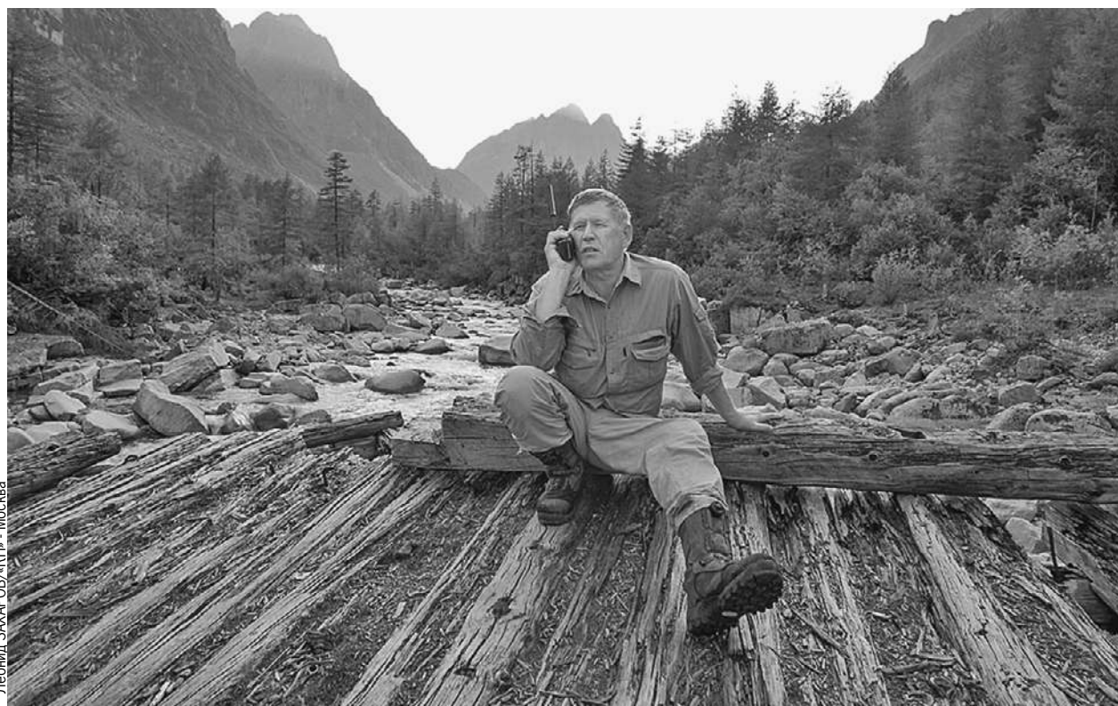
Главный редактор обожал путешествия по самым труднодоступным местам. На этом фото он связывается с редакцией из Мраморного ущелья, где в Читинской области добывали первый советский уран.