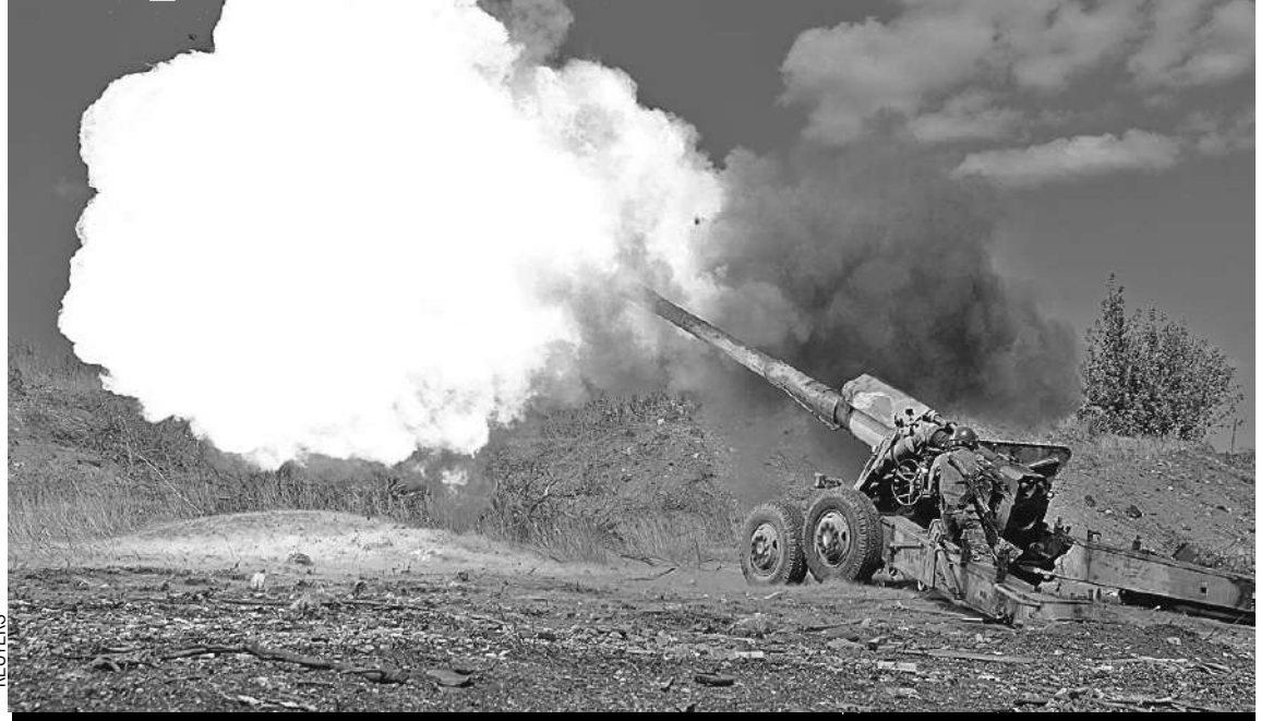
На Изюмском направлении нашей артиллерии пришлось лицом к лицу столкнуться с НАТО - их инструкторами и даже солдатами. Теперь фронт стабилизировался.

- Оружия у нас много. С точки зрения людей... Очевидно, что если ты воюешь в режиме добровольческой армии, а противник проводит тотальную мобилизацию, он имеет превосходство. А это затрудняет достижение целей спецоперации. Поэтому в обществе постоянно идут дискуссии: «Нужна ли нам