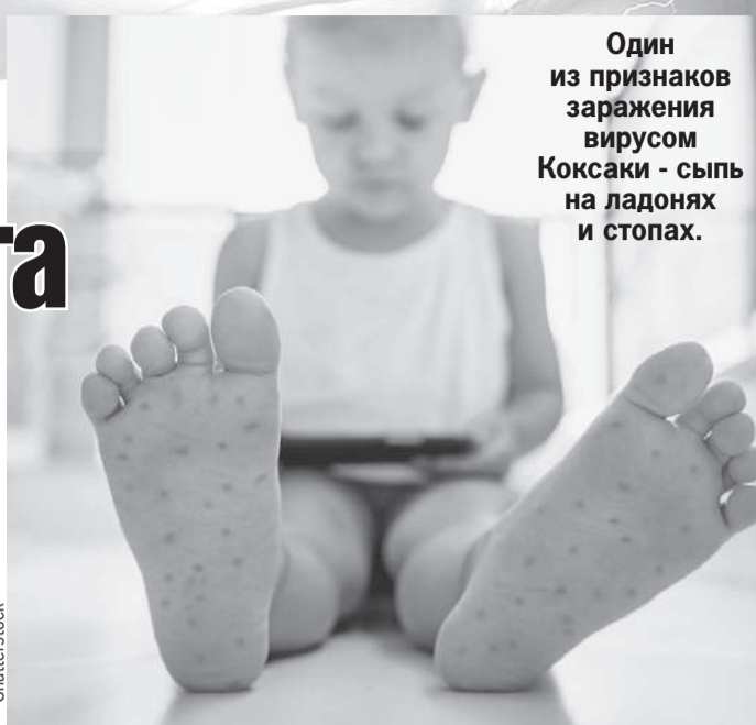
Один из признаков заражения вирусом Коксаки - сыпь на ладонях и стопах.

ру, ноги и руки часто остаются холодными;