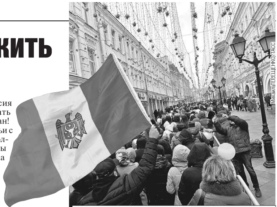
В Москве в день выборов президента Молдавии люди говорили о дружбе с Россией.

Кстати, на второй тур пришли многие из тех, кто в первом оставался дома, понимая, что это последняя возможность высказать мнение, отличное от того, что навязывают Молдавии сторонники «евровыбора».