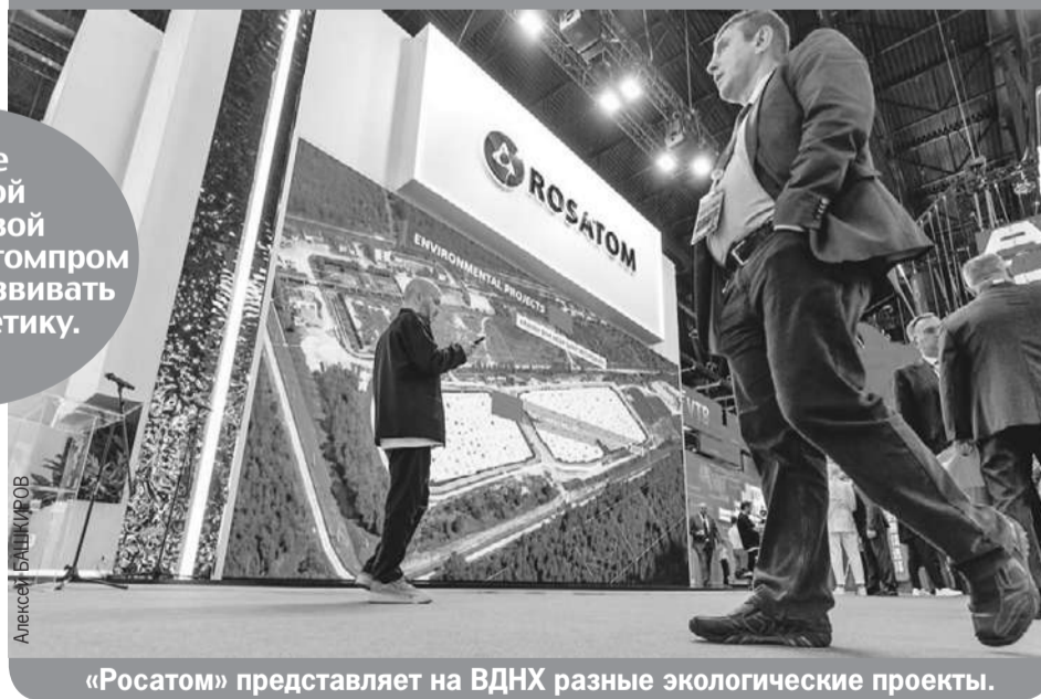
«Росатом» представляет на ВДНХ разные экологические проекты.