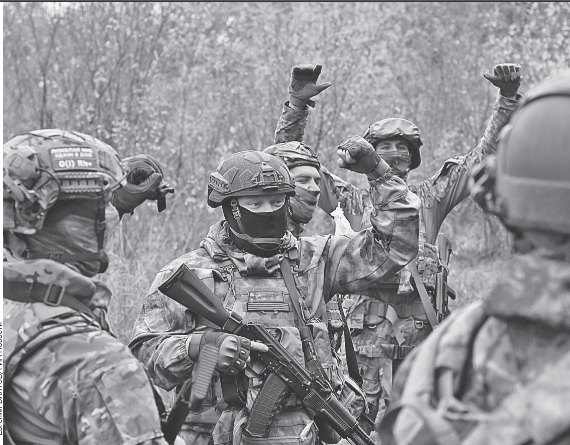
Курсанты учебного центра инженерно-саперного батальона имени генерала Карбышева, обучаясь на «тропе сапера» в ЛНР, на осеннюю непогоду не оглядывались.

Мало сказать, что наша армия за лето и осень (с июня по октябрь) на большинстве участков фронта перехвати-