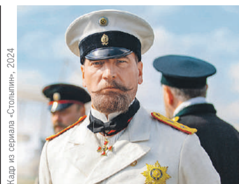
Кадр из сериала «Столыпин», 2024