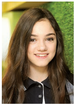
Иван МАКЕЕВ/«КП» - Москва