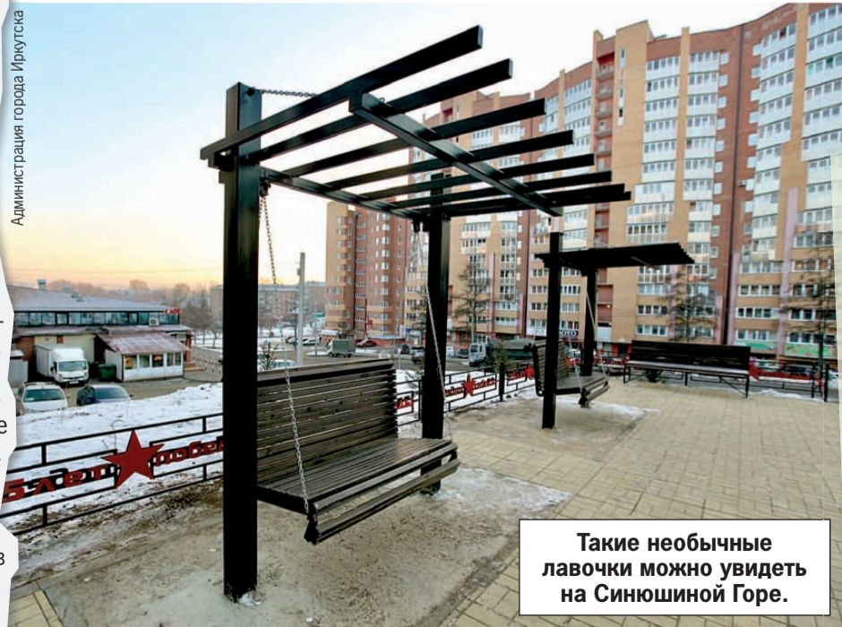
Такие необычные лавочки можно увидеть на Синюшиной Горе.