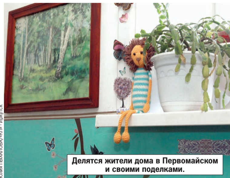
Делятся жители дома в Первомайском и своими поделками.