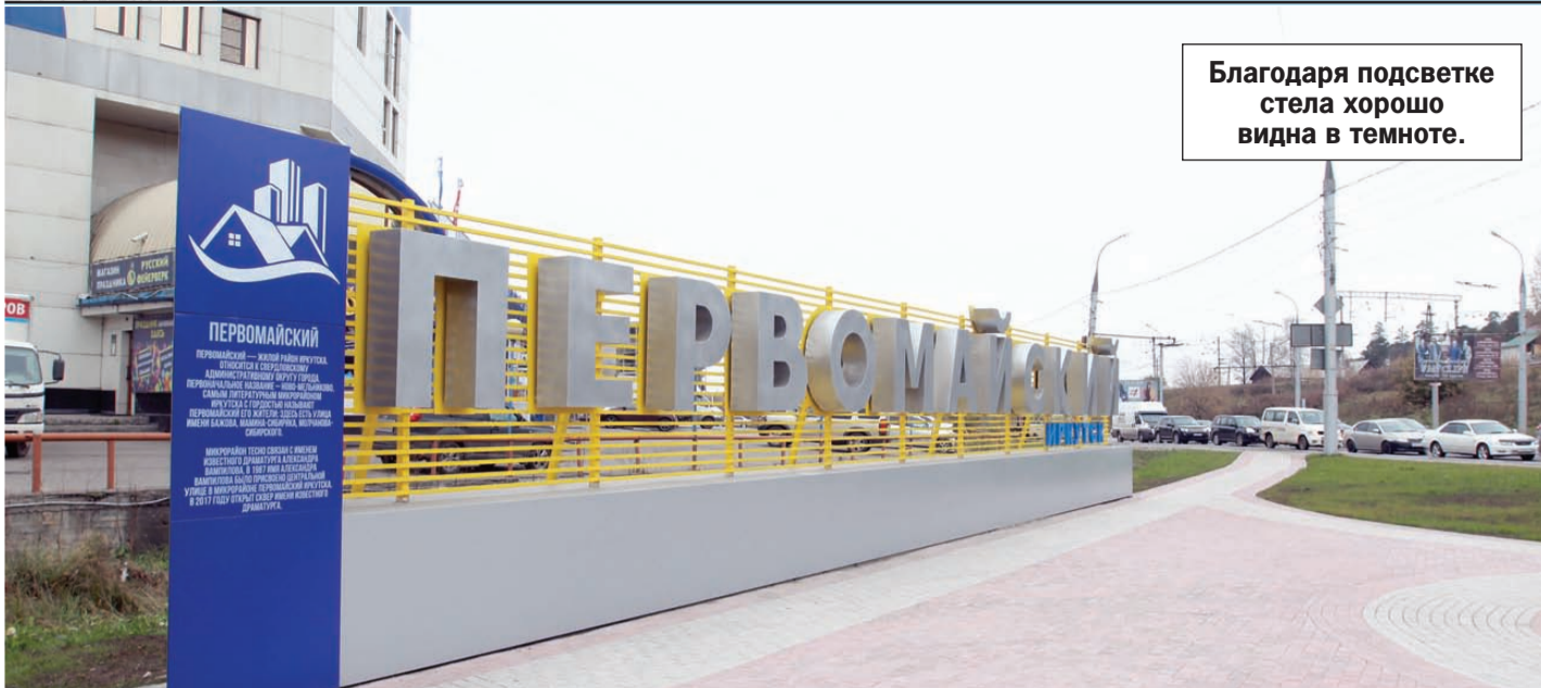
Благодаря подсветке стела хорошо видна в темноте.