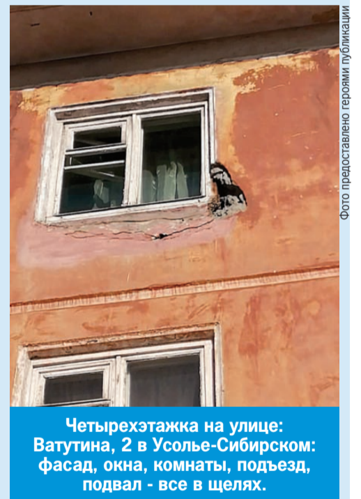
Четырехэтажка на улице Ватутина, 2 в Усолье-Сибирском: фасад, окна, комнаты, подъезд, подвал - все в щелях.

алисты уверены, что необходимо обновить карты сейсмического районирования города, которым уже больше 40 лет. Это поможет не только при строительстве новых зданий, но и узнать, как изменился грунт под имеющимися домами.