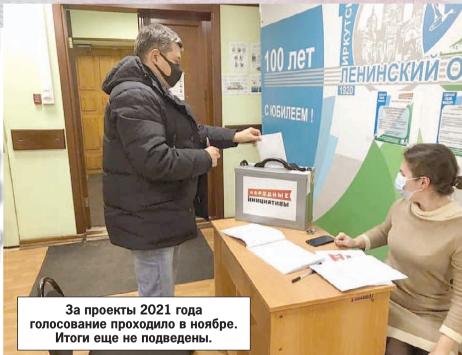
За проекты 2021 года голосование проходило в ноябре. Итоги еще не подведены.

Благоустройство сквера 75-летия Победы на бульваре Рябикова, 26.