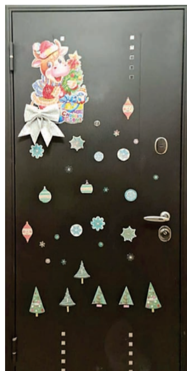
Вот так празднично можно оформить дверь.

Еще больше фото - на сайте новостииркутска.рф