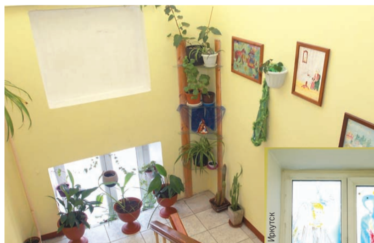
Картины юных художников украшают подъезд на Грибоедова, 2.

всех, кто потрудился над созданием здесь уюта, но статьи не хватит, чтобы перечислить всех жильцов! А каждый из них заслуживает особого