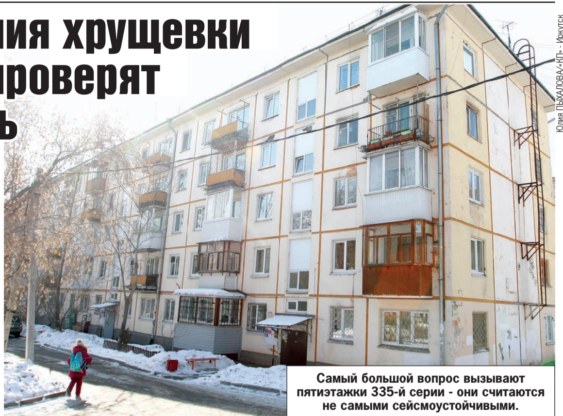
Самый большой вопрос вызывают пятиэтажки 335-й серии - они считаются не самыми сейсмоустойчивыми.

Восемь домов, признанных аварийными, не отвечают нормам сейсмостойкости. Эти здания опасны, - прокомментировал ситуацию губернатор Иркутской области Игорь Кобзев в своем официальном аккаунте в «Инстаграме». - Пять из них находятся в Усолье-Сибирском, два в Зиме, один в Хомутово. Людей нужно расселять, и как можно быстрее. На переселение и снос необходимо более миллиарда рублей. Ищем возможности войти в действующие жилищные программы. Это даст возможность получить деньги из госказны. Работаем над вопросом строительства в Усолье-Сибирском и Ангарске новых многоквартирных домов для жителей хрущевки. В Зиме и