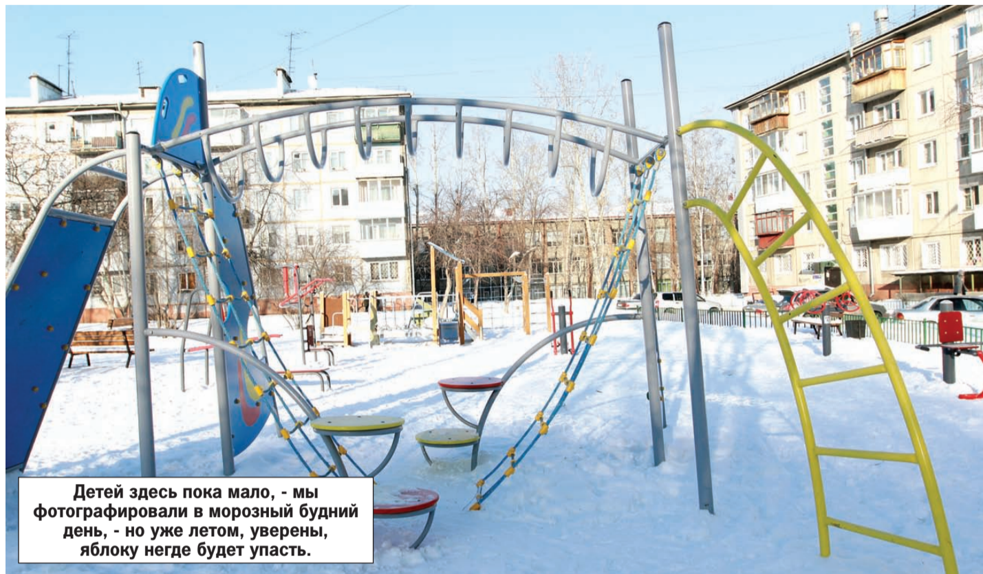
Детей здесь пока мало, - мы фотографировали в морозный будний день, - но уже летом, уверены, яблоку негде будет упасть.