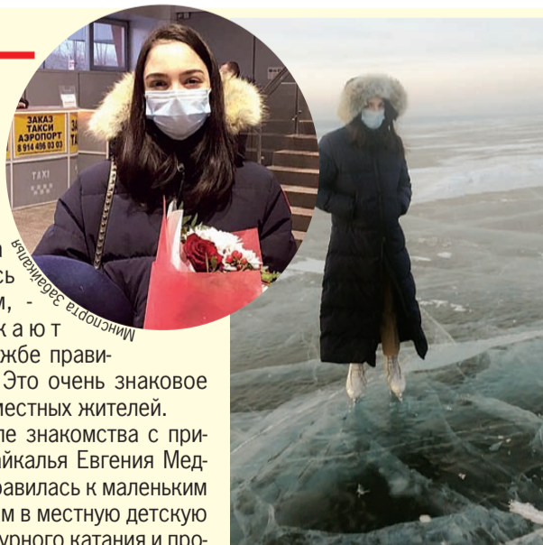
От прозрачной глади Кенона спортсменка осталась в восторге.

Ну а после знакомства с природой Забайкалья Евгения Медведева отправилась к маленьким спортсменам в местную детскую секцию фигурного катания и провела для ребят мастер-классы. Так что через несколько лет ждем появления новых чемпионки из Читы!