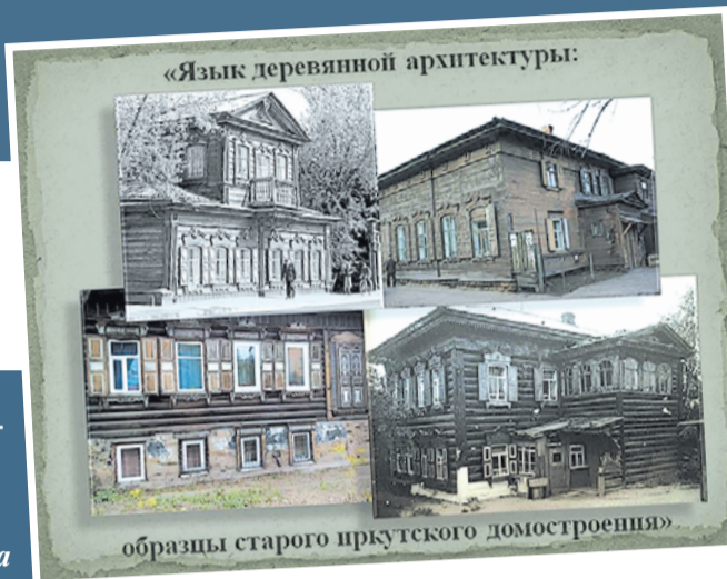
Музей городского быта

Куда и когда идем Музей городского быта - ул. Декабрьских Событий, 77 Ежедневно с 10.00 до 17.30, кроме вторника