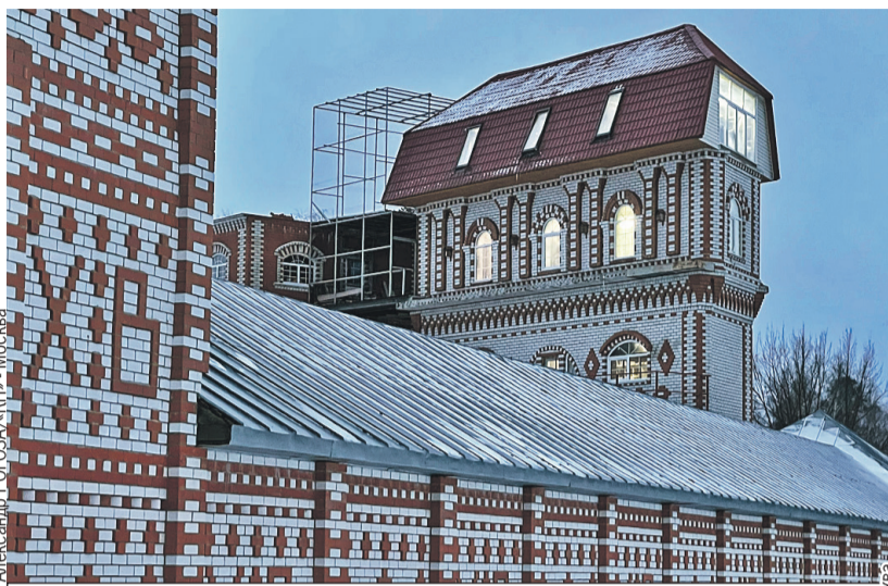
Так выглядит отстроенный в 90-х монастырь в деревне Острово.