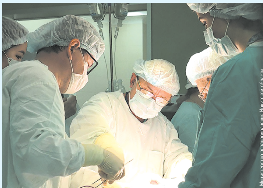
Министерство здравоохранения Иркутской области

Как сообщили «КП» - Иркутск» в пресс-службе Министерства здравоохранения Иркутской области, колоэзофагопластику второкласснику провели несколько месяцев назад. Сейчас школьник идет на поправку.