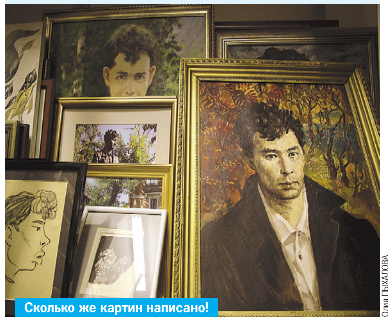
Сколько же картин написано!