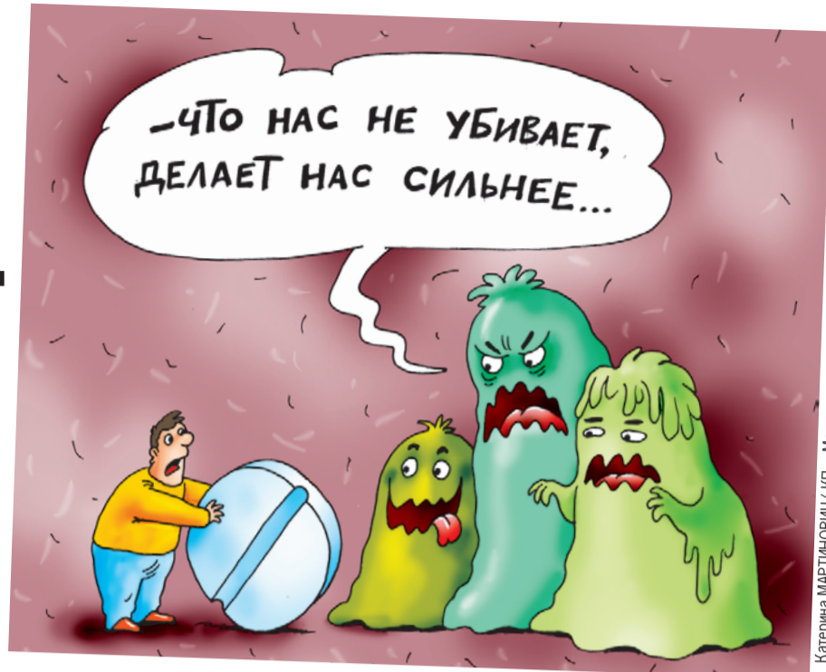
Катерина МАРТИНОВИЧ/«КП» - Москва

87,9% заявляют, что в целом им известно об опасности необоснованного применения антибиотиков. Но почти половина опрошенных (41,6%) уверены, что антибиотики убивают вирусы и эффективны при ОРВИ (простуде). Внимание, правильный ответ: против вирусов антибактериальные препараты бессильны,