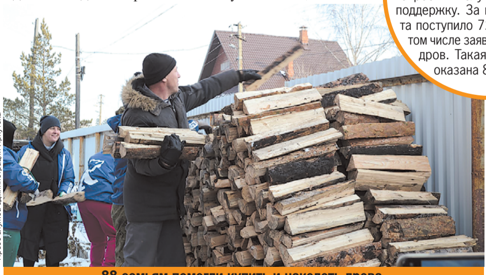
88 семьям помогли купить и наколоть дрова.