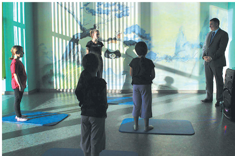
Дети из семей мобилизованных могут выбирать занятия по интересам - и творчество, и спорт.

- Увеличилось количество жалоб на телефонных мошенников, - сообщает Руслан Болотов. - Призываю вас быть бдительными, не поддаваться панике. В случае поступления звонка с требованием оказать какую-либо помощь военнослужащим или пере-