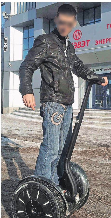
Мальчику, которому колот глаза старший Кожепаров, уже 31 год, он видит.

- Мать так и считала, что сыновей засадили зря, - рассказывает он, - и про Миха-