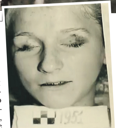
Девочка, убитая, чтобы отвести подозрения от брата.

Дом нежилой, забор кусками сташен к фасаду, я