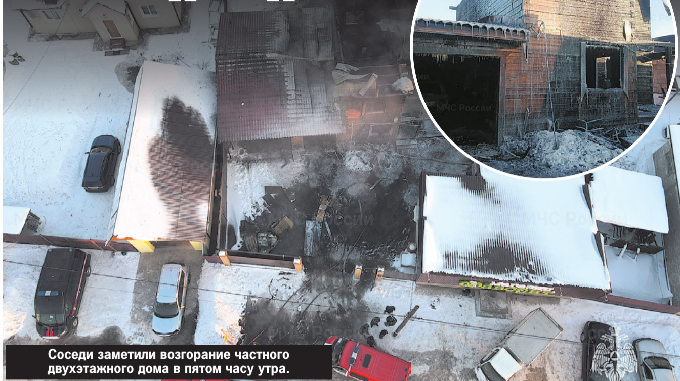
Соседи заметили возгорание частного двухэтажного дома в пятом часу утра.