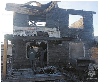
ГУ МЧС России по Иркутской области

РАДИО КОМСОМОЛЬСКАЯ ПРАВДА FM.KP.RU Иркутск 91,5 FM | Братск 99,5 FM