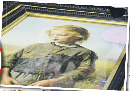
Иркутский областной художественный музей им. В.П. Сукачева