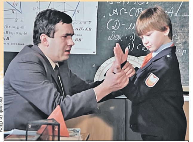
Кажется, кто-то не сдал «контрабанду»...

Из этой же среды пришло и слово «параша»: заключенные называли