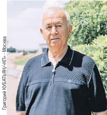
Григорий КУБАТЬЯН/«КП» - Москва

- Если какой-то уровень воды в Каховском водохранилище сохранится, придется прокладывать дополнительные трубы для ее подачи. Полив можно организовать и из артезианских источников, но там вода слишком соленая. Так что перебарщивать нельзя - иначе будет засоление почвы и земля может стать непригодна. А восстанавливать ее дорого и сложно.