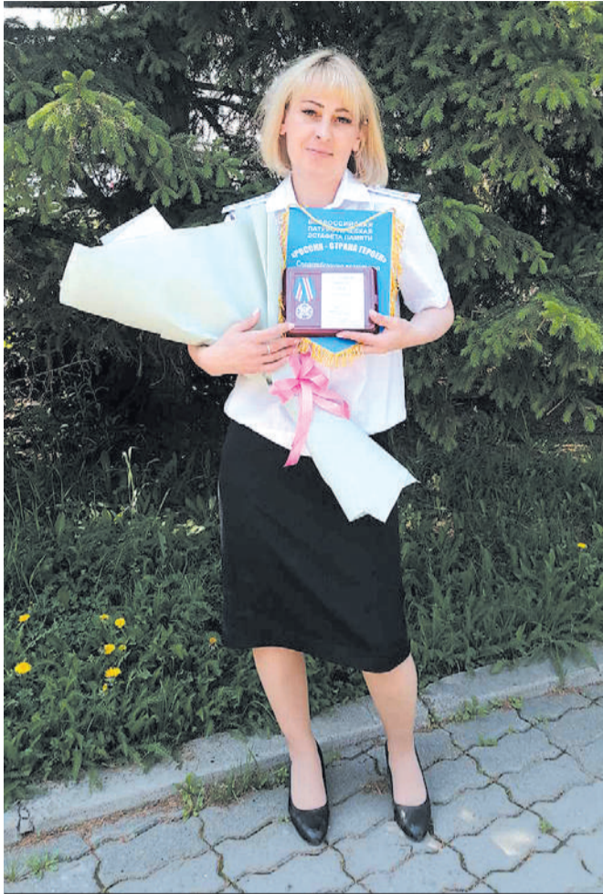
Сибирячка увидела, что незнакомец схватил ребенка и потащил в лесопарк, и бросилась за ними.