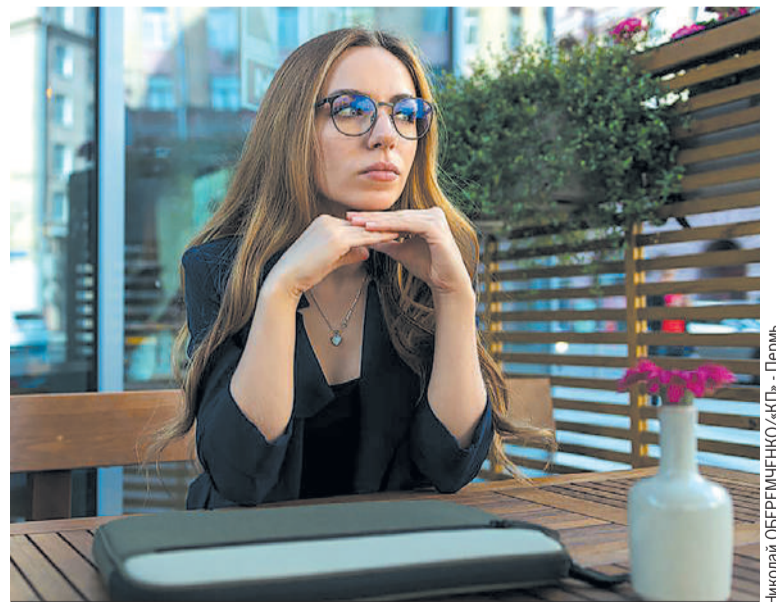
Красивым девушкам «на северах» тоже найдется работа, например официанткой.

При этом сами соискатели в поисках места под солнцем на вахту не стремятся. Интерес по стране составляет только 5%. При этом большую часть желающих составляют люди с опытом, имеющие стаж от 6 лет.