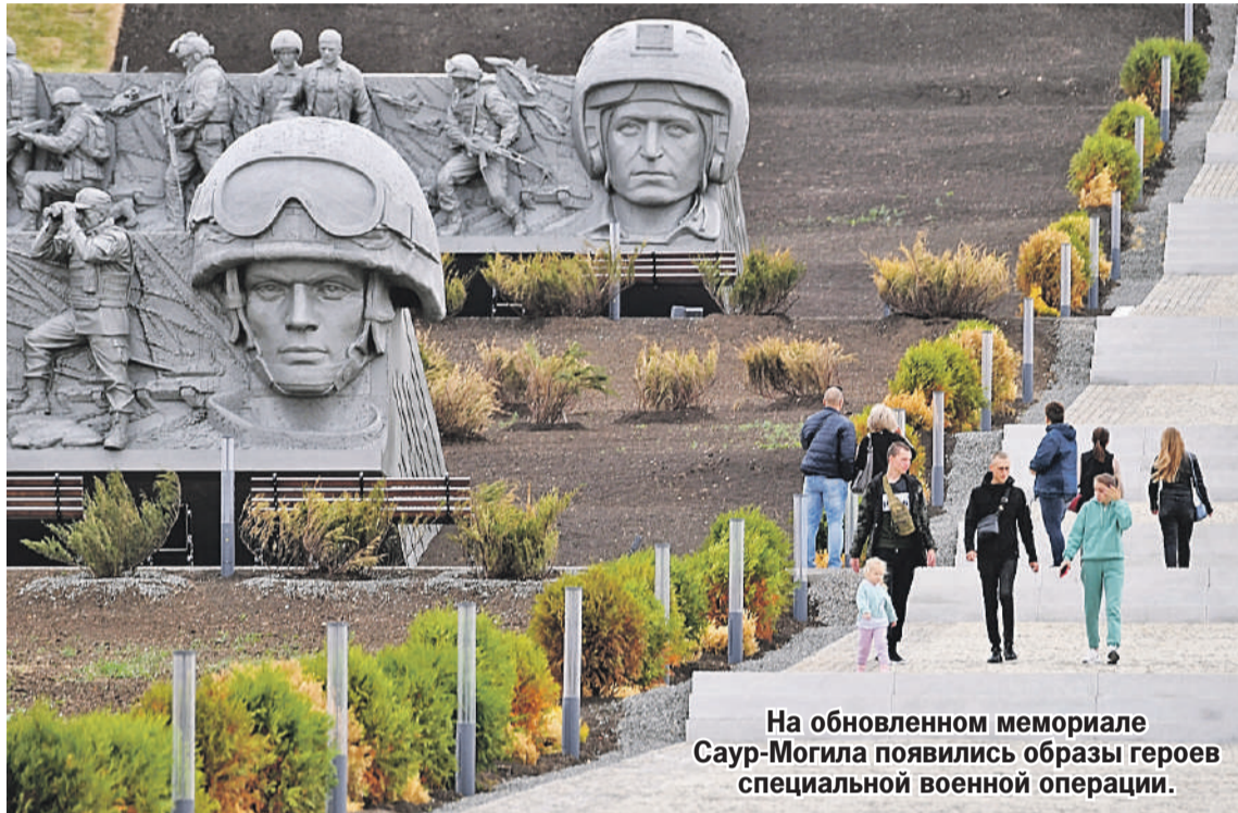
На обновленном мемориале Саур-Могилу появились образы героев специальной военной операции.

- Да, известно, есть проект. Стройка идет полным темпом, с опережением графика. Памятник будет находиться в Гатчинском районе Ленинградской области. Выбрано место не случайно - близко к аэропорту Пулково. И туристам будет удобно. Кроме того, по соседству с местом мемориала находилась так называемая детская спецбольница. Туда собирали детей в возрасте от 7 лет и откачивали у них кровь немцы. Считалось, что детская кровь очень полезна