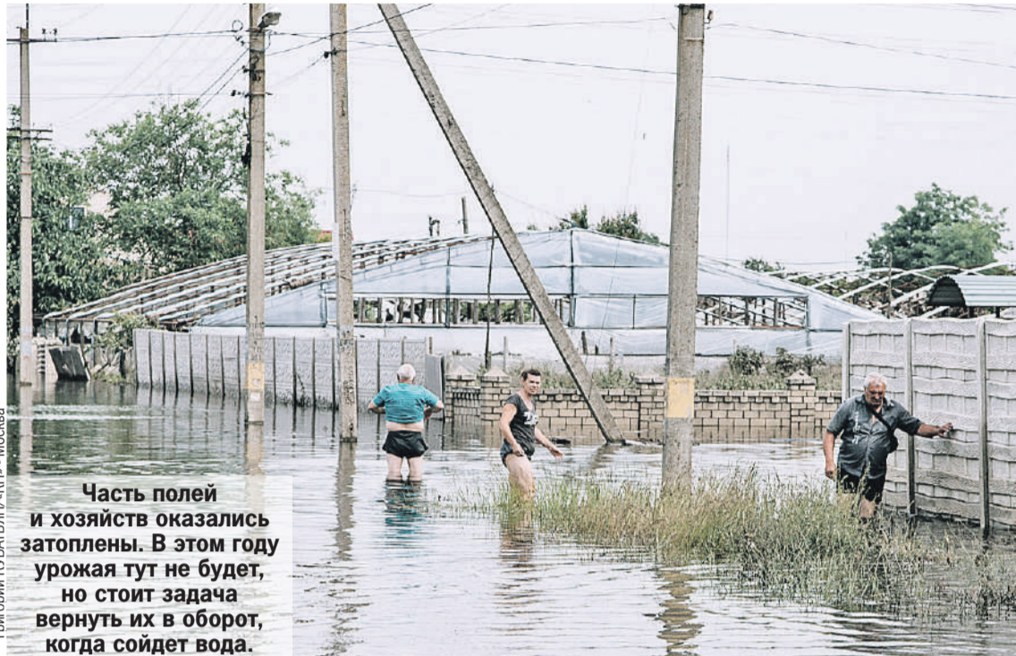
Часть полей и хозяйств оказались затоплены. В этом году урожая тут не будет, но стоит задача вернуть их в оборот, когда сойдет вода.

- В Херсонской области больше 5 тысяч фермерских хозяйств, не считая приусадебных. И было 8 тысяч гектаров закрытых водо-