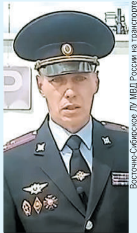
Полковник поймал грабителя.

Возбуждено уголовное дело по статье «Кража».