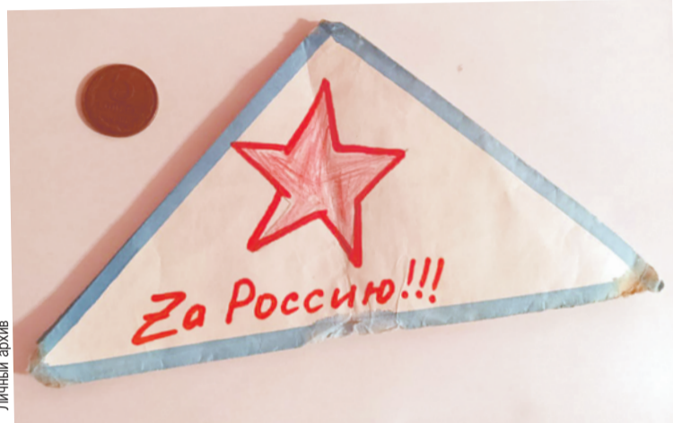
Весточку из родного края боец перечитывал много раз.