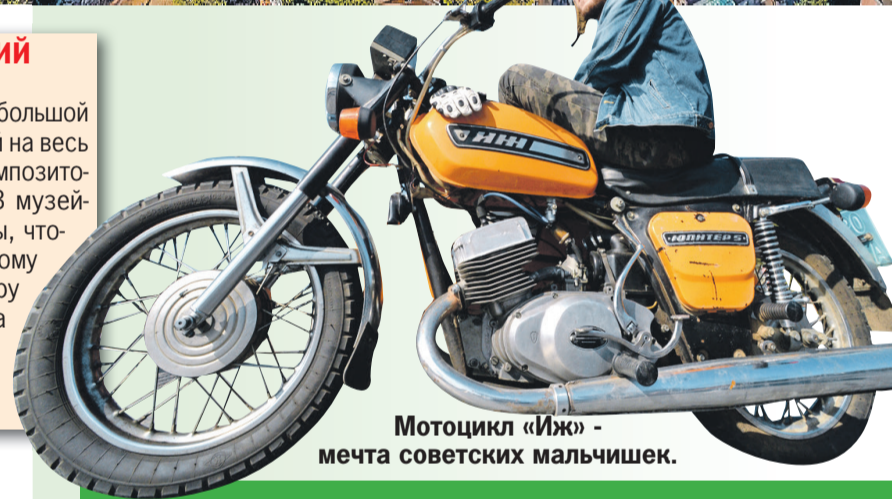
Мотоцикл «Иж» - мечта советских мальчишек.