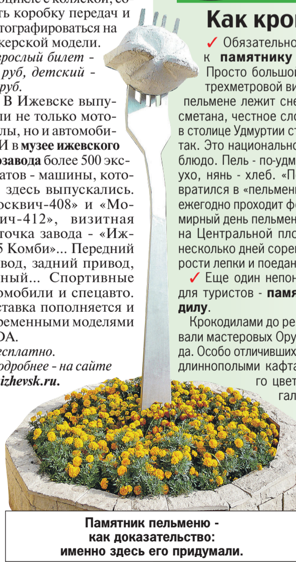
Памятник пельменю - как доказательство: именно здесь его придумали.

Все самые интересные места родной страны - в проекте «Отдых в России» на сайте