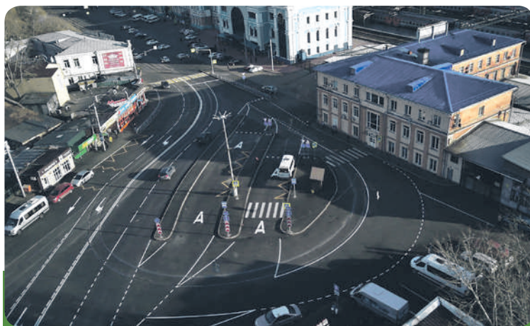
Улица Терешковой после капитального ремонта.

Также на территории Русско-Амурского мемориального комплекса выложили плиткой дорожки, смонтировали перголу и скамьи, провели ремонт входной группы и реставрацию памятного знака в виде