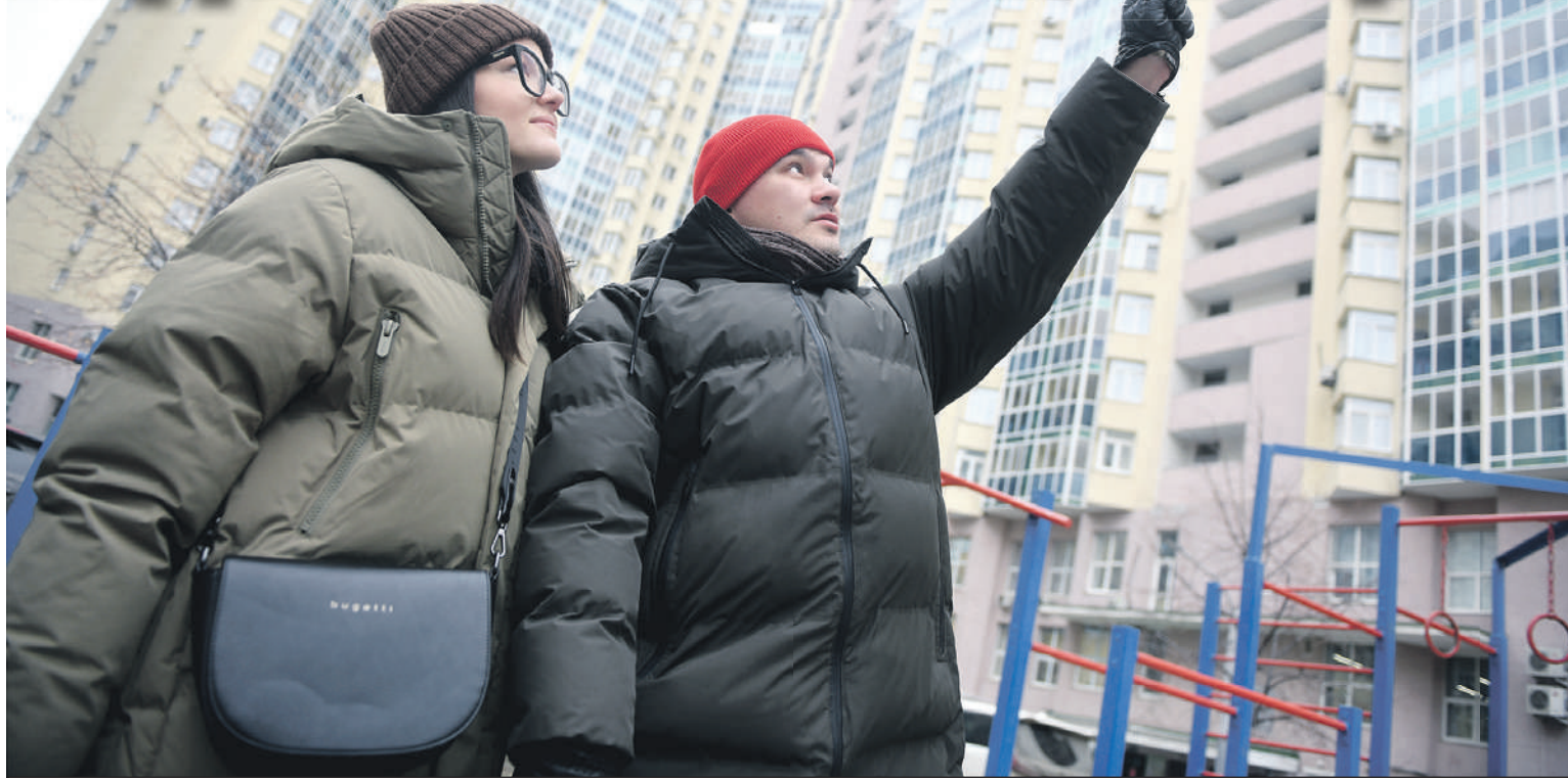
Двухкомнатная квартира в среднем обойдется в 8 миллионов рублей.