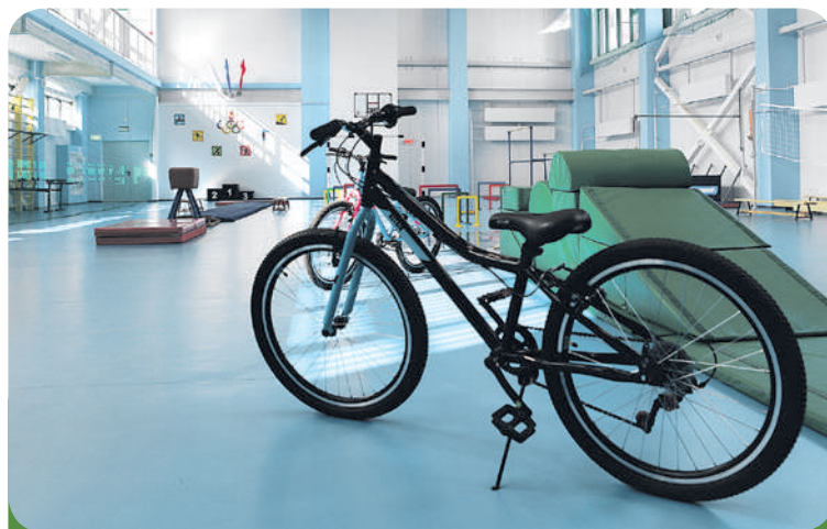
Спортзал в новом блоке школы №57.