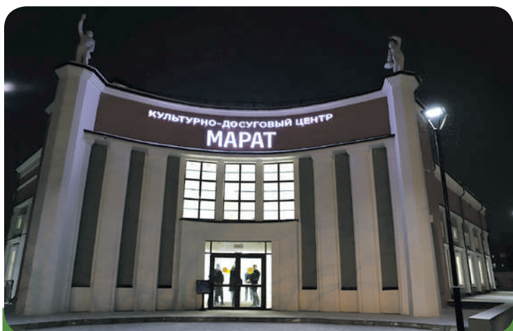
Культурно-досуговый центр «Марат» торжественно открылся в январе этого года.

Мэр уточнил, что обе инициативы являются составляющими создания единой набережной протяженностью 11 километров, которая включает участки от плотины ГЭС до бульвара Постышева, далее до Академического моста, бульвар Гагарина, Цесовскую и Нижнюю Набережные, а также участок от Московских ворот до устья Ушаковки.