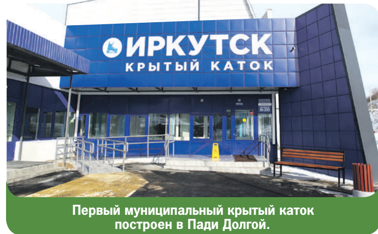
Первый муниципальный крытый каток построен в Пади Долгой.

запросов изменился, - отметил Руслан Болотов. - Материальное обеспечение не вызывает нареканий, но требуется спецтехника и оборудование. Мы постоянно на связи как с самими бойцами, так и с их семьями. Более того, скоро в Иркутске начнет производиться необходимое для фронта оборудование.