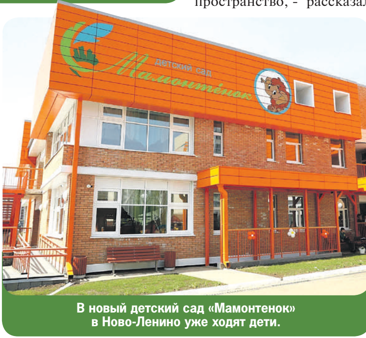
В новый детский сад «Мамонтенок» в Ново-Ленино уже ходят дети.

В 2024 году в Иркутске комплексно отремонтируют 18 участков улиц общей протяженностью более 19 километров. В план дорожного ремонта на 2024 год включены улицы Ленинградская, Сеченова, Горького, Розы Люксембург (Малая Роза), Якоби, Чайковского, 25 Октября, Во-