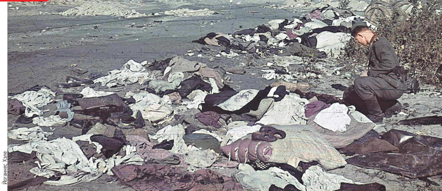
Бабий Яр. Эсэсовец в поисках ценностей копается в вещах только что расстрелянных людей.

Для евреев на Украине ужас начался с первых дней войны. Немцы действительно с удивлением отмечали, с каким остервенением их новые украинские помощники принялись за еврейские погромы. Вот строки из донесения Отдела VI А начальника полиции безопасности и СД (Службы