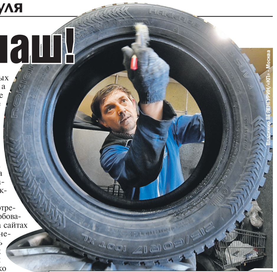
Владимир ВЕДЕНГУРИН/«КП» - Москва

Третья, а для нас, пожалуй, что и главная, черта нового сезона - практически завершилась трансформация