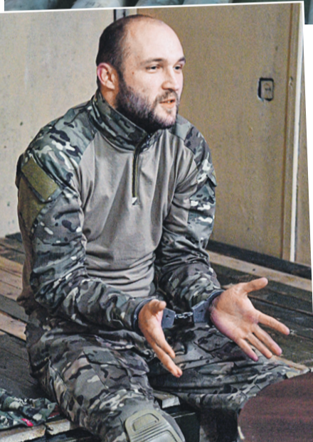
Пленные понимают, что издеваться над ними никто не будет, и охотно рассказывают, что происходит в ВСУ.