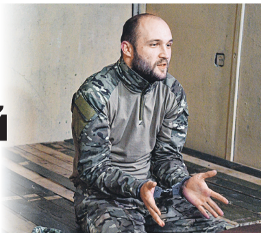
Павел ЛИСИЦЫН/РИА Новости