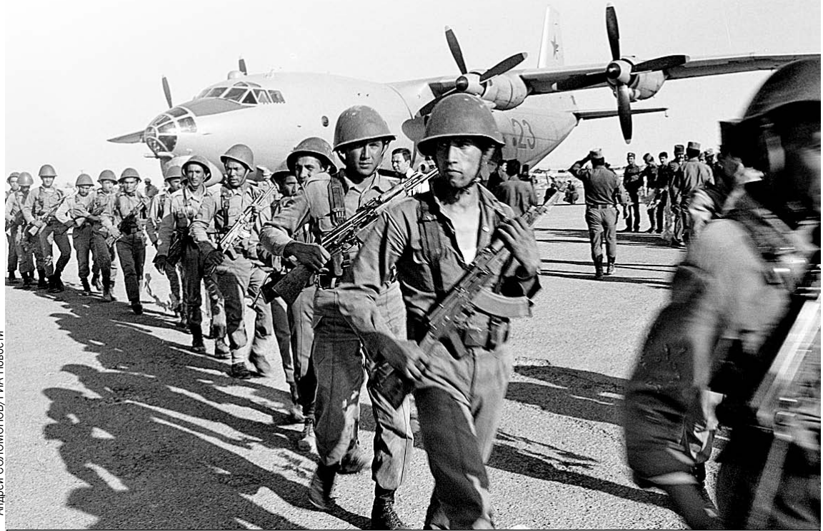
Советский спецназ высаживается в Афганистане. Весна 1988-го.

В самом СССР эта война поначалу держалась в секрете. Газеты и телевидение хранили молчание о ее размахе и потерях, сообщая лишь об исполнении «интернационального долга» в Демократической Республике Афга-