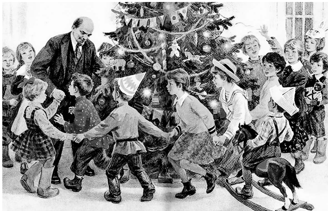
Детский новогодний хоровод с дедушкой Лениным. Поздравительная открытка. 1950-е годы.

ной хороминой на Красной площади, в Тайницком саду у зданий Старых и Новых приказов и у Лобного места, перед Спасскими воротами.