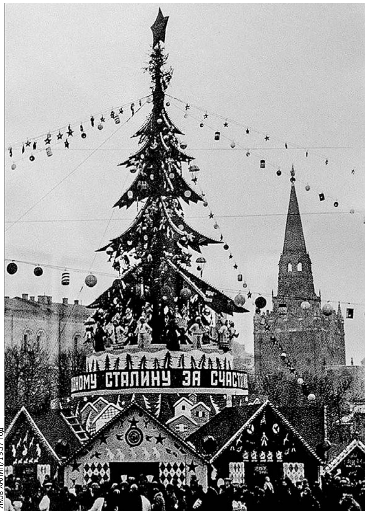
Москва, елка у Троицких ворот. В Кремле - товарищ Сталин, а на новогодней елке среди украшений - здравница в честь великого вождя. 1937 год.

Оказывается, в то время государь заложил не один, а целых три Александровских сада - Верхний, Средний и Нижний - от Угловой Арсенальной до Водовзводной башни: для «красоты, прогулок и праздных забав». Сегодня сад перестали делить на части: теперь он просто один Александровский. Но 200 лет назад народ охотнее всего шел именно к верхней большой рождественской и новогодней елке - у декоративного грота «Руины».