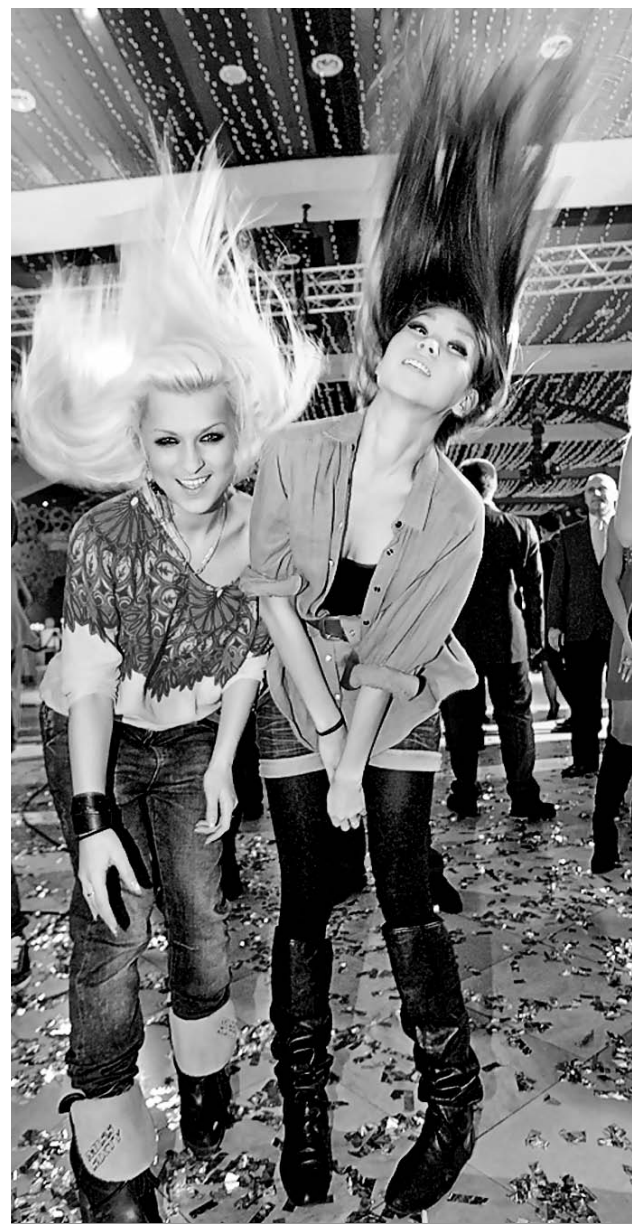
Раз в год на корпоративе взрослые дяди и тети отжигают так, что некоторым потом стыдно идти на работу...

Подготовила Любовь АРБАТСКАЯ («КП» - Иркутск).