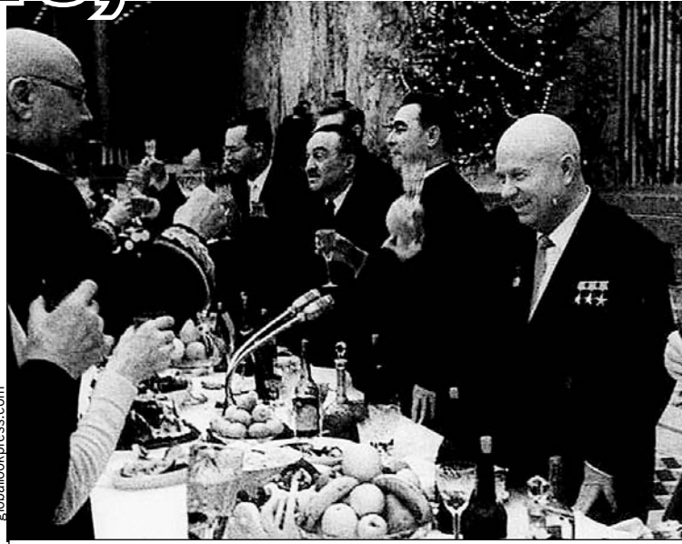
Маршал Советского Союза Семен Тимошенко (на фото - слева) поздравляет первого секретаря ЦК КПСС Никиту Хрущева с Новым годом. Справа от Никиты Сергеевича - его соратники Леонид Брежнев и Анастас Микоян. Москва, Кремль, декабрь 1963 г.

Постышев так и сделал: осудил «левый елочный загиб» и рекомендовал «положить ко-