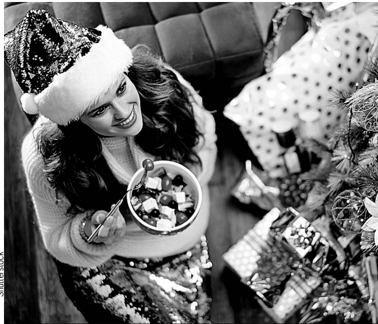
Даже полезной закуски должно быть в меру.

цепт. Картофеля кладите самый минимум, как будто это дорогой деликатес. Вторых, вместо покупного майонеза возьмите более легкую заправку (например, греческий йогурт или сметану) или сделайте домашний майонез. Так вы будете знать, что использовали самые све-