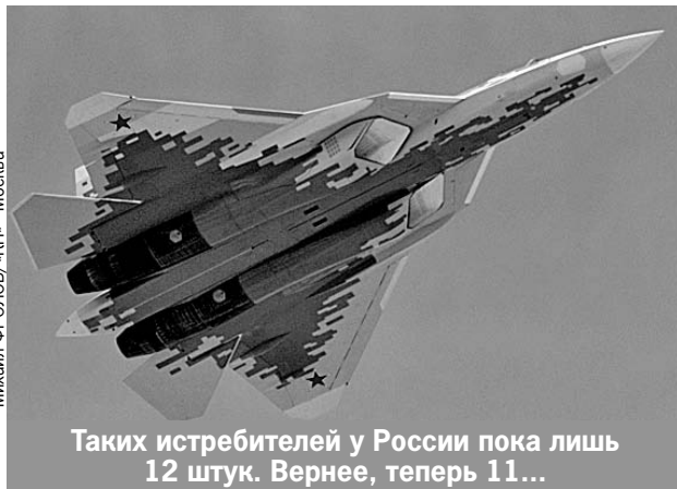
Таких истребителей у России пока лишь 12 штук. Вернее, теперь 11...

Срочно поднятый в воздух поисково-спасательный вертолет быстро обнаружил дымящуюся воронку от врезавшегося в землю истребителя. А в нескольких километрах - приземлив-