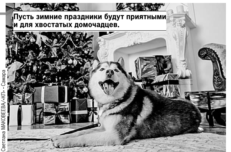
Пусть зимние праздники будут приятными и для хвостатых домочадцев.

Любите своего питомца? Тогда не ставьте дома натуральную елку. Небольшая, искусственная куда безопаснее. Новогоднее дерево может упасть на животное, питомец может начать его грызть, пить воду из емкости для