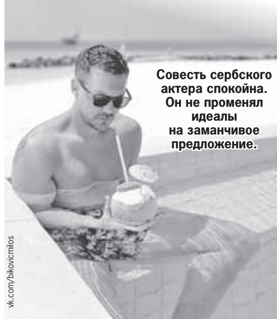
Совесь сербского актера спокойна. Он не променял идеалы на заманчивое предложение.