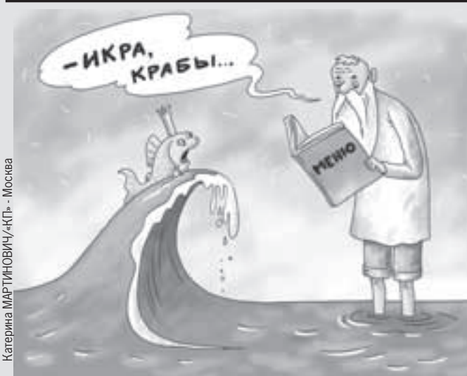
Катерина МАРТИНЮВИЧ/КТР - Москва

Неожиданно наш рынок оказался заполнен импортной черной икрой (подробнее на стр. 14 - 15). Мы спросили: