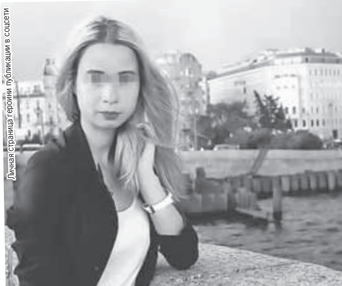
Личная страница героини публикации в соцсети

Сначала скандал вокруг учительницы разгорелся в школе, а потом дело дошло до Следственного комитета и уголовной статьи.