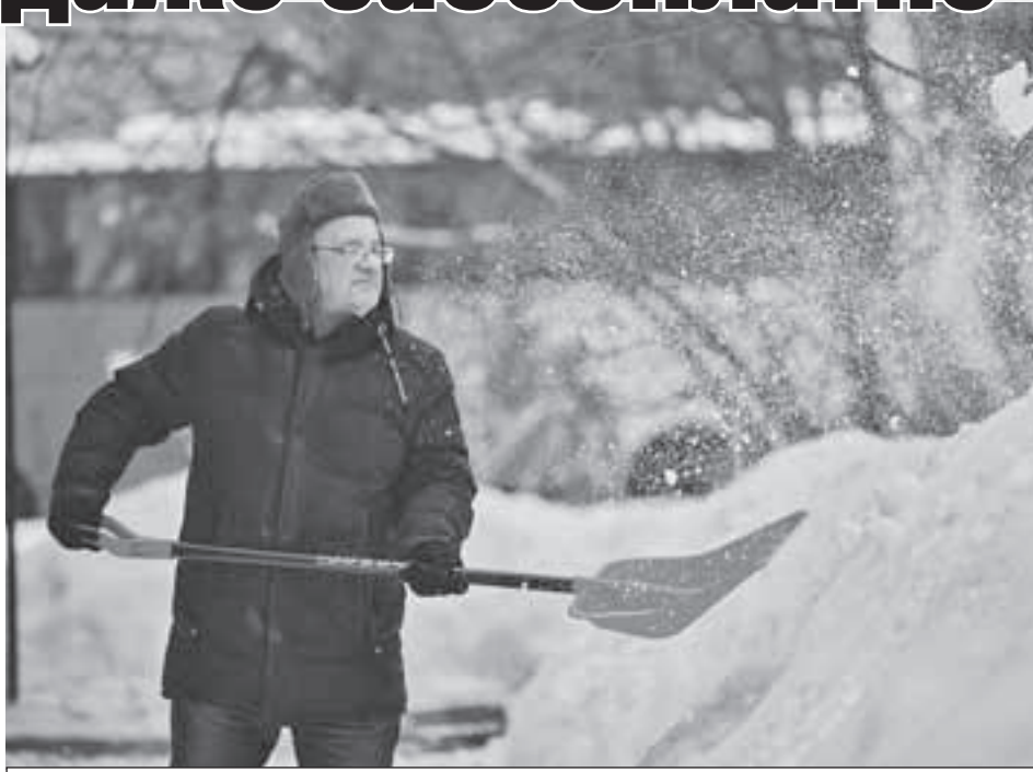
Килограммы - минус, настроение - плюс!

Поначалу, чтобы сохранить пути отступления, я соседям объяснял, мол, работаю за так, для здоровья.