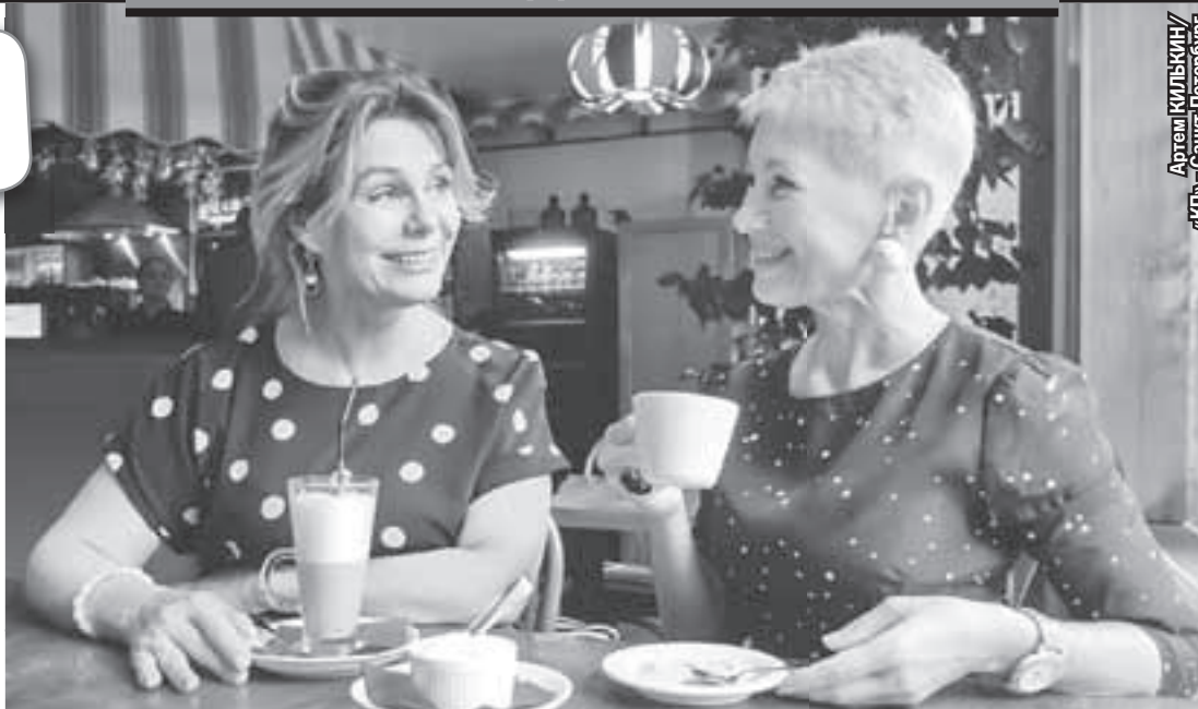
Артем КУЛЬКОВИЧ / «КП» - Санкт-Петербург

«Мы - первое поколение бабушек, которым некогда заниматься внуками, так как повысили пенсионный возраст. Моим внукам 12 и 11 лет, когда выйду