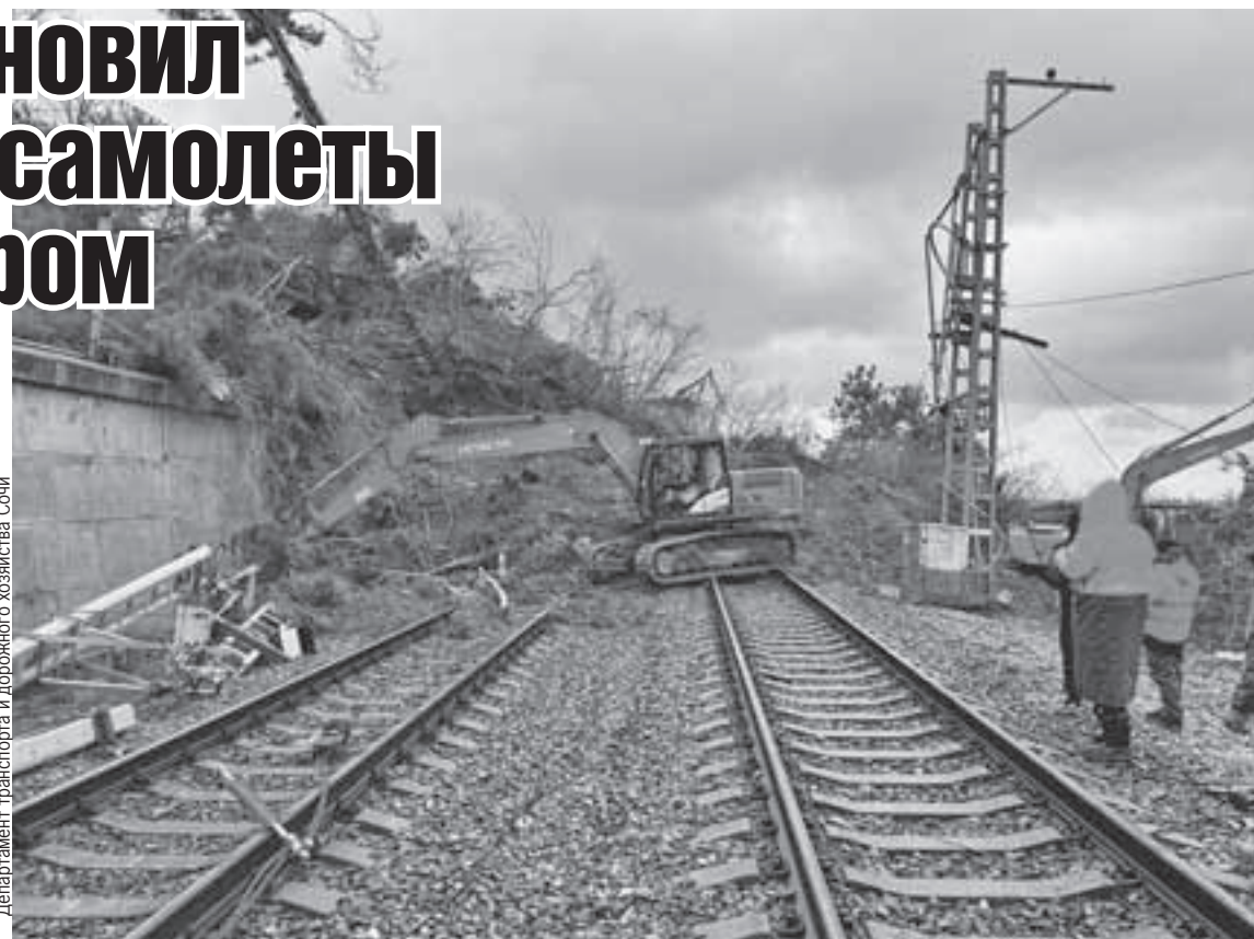
Департамент транспорта и дорожного хозяйства Сочи

- Мы усилили все службы для оперативного обслуживания пассажиров и воздушных судов. Увеличено количество операторов кол-центра, выставлены дополнительные кулеры для воды. Чаше убирают санитарные зоны, рабо-