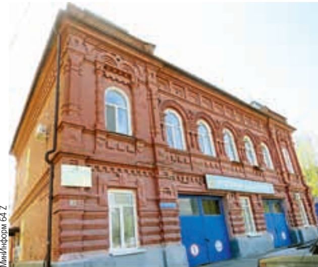
Комитет также утвердил границы территории и предмет охраны для памятника.

Историки сообщают, что документы о создании городских пожарных команд были уничтожены. Предположительно 5-я пожарная часть была образована в 1870-е годы. Ее разместили в отдельном, новом специализированном здании. Строение не имело каланчи, так как рельеф Дегтярной площади и окружаю-