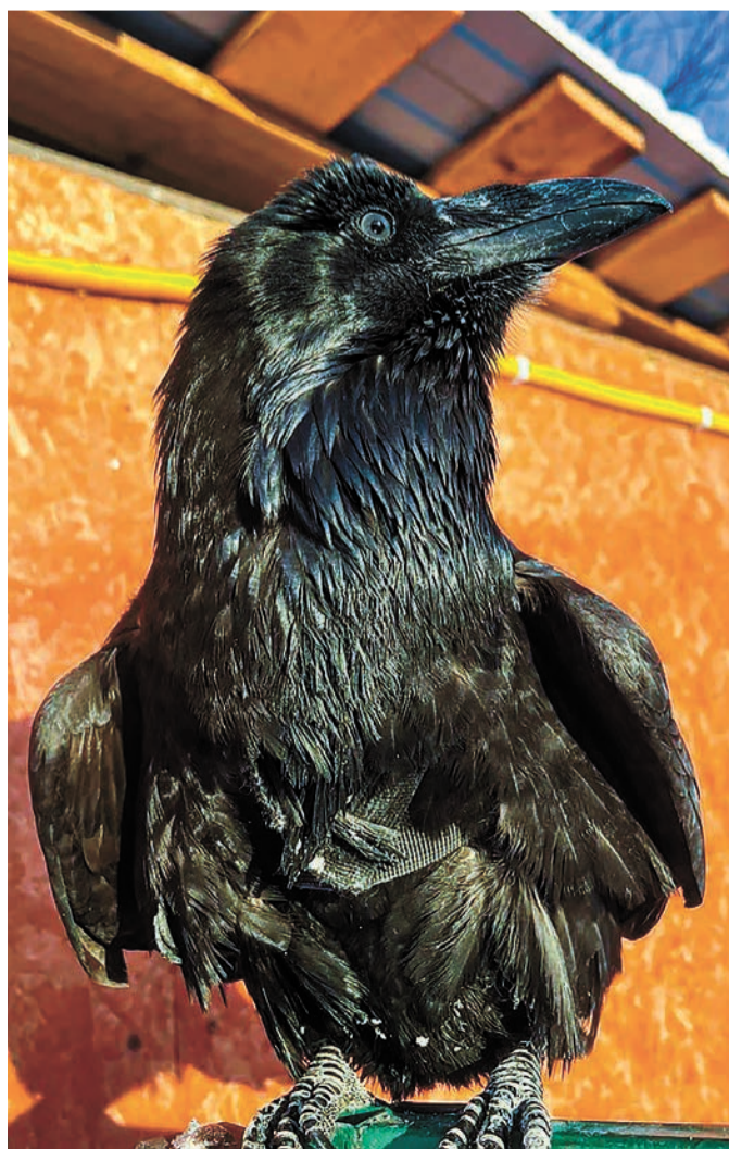
Ворон несет в клюве всё, что плохо лежит.

- Надеюсь, Гера проживет долго и счастливую жизнь! - подытожила югорчанка.