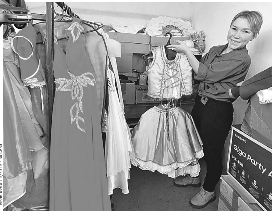
Театральный кружок в сибирском селе Неудачино: немецкие народные платья здесь - неременный атрибут.

Несчастные Казармы стояли у села Вагай, имеющего в округе славу не то