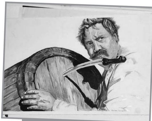
«Я мзду не беру, мне за державу обидно!» - словно говорит таможенник Верещагин из «Белого солнца пустыни» на этом рисунке Бута.