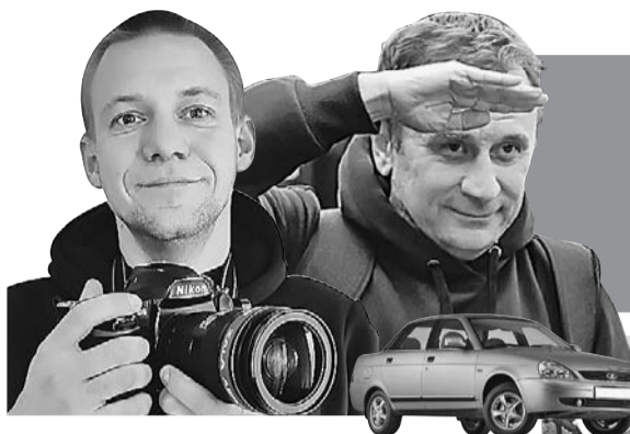
Владимир ВОРСОВИН (текст)

Читайте на сайте KP.RU все путевые заметки нашей экспедиции (там же - видео, которое мы снимали в пути).