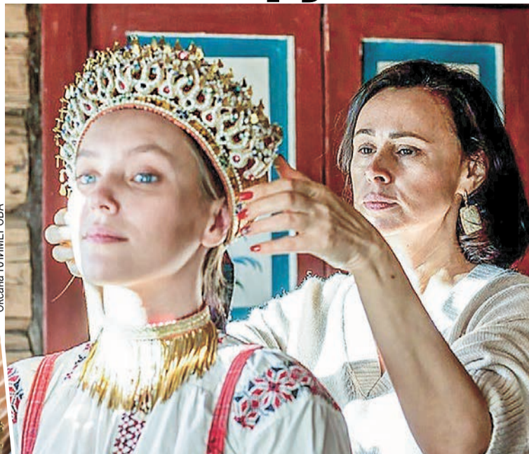
Самое сложное - сделать выкройку головного убора.