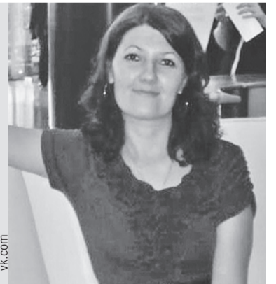
43-летняя женщина спала, когда бывший муж накинулся на нее.