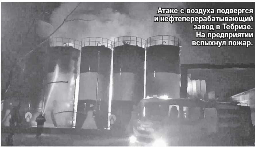
Атаке с воздуха подвергся и нефтеперерабатывающий завод в Тебризе. На предприятии вспыхнул пожар.

Многие аналитики полагают, что дело не обошлось без участия США. Американцы видят две