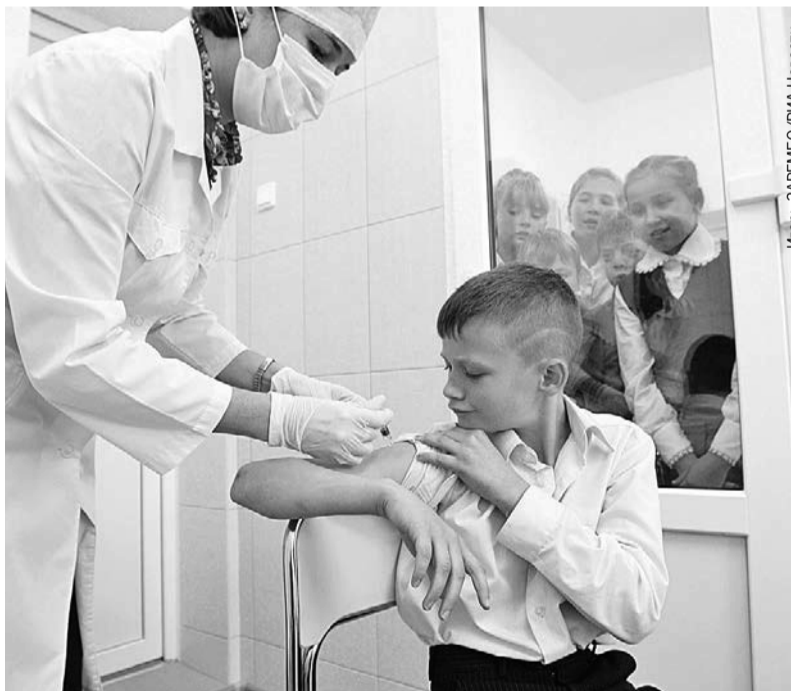
Колоть вакцину нужно прямо сейчас - вторую волну заразы обещают в феврале.

- Антитела к вирусу гриппа одного штамма не могут полностью защитить от другого, тем более если эти штаммы относятся к разным подтипам вируса (А и В), - сказала врач.