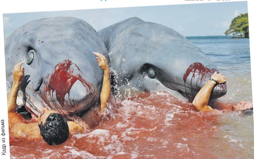
Из всех искусств страшнейшим для нас является кино: кадр из фильма «Угроза из глубины».