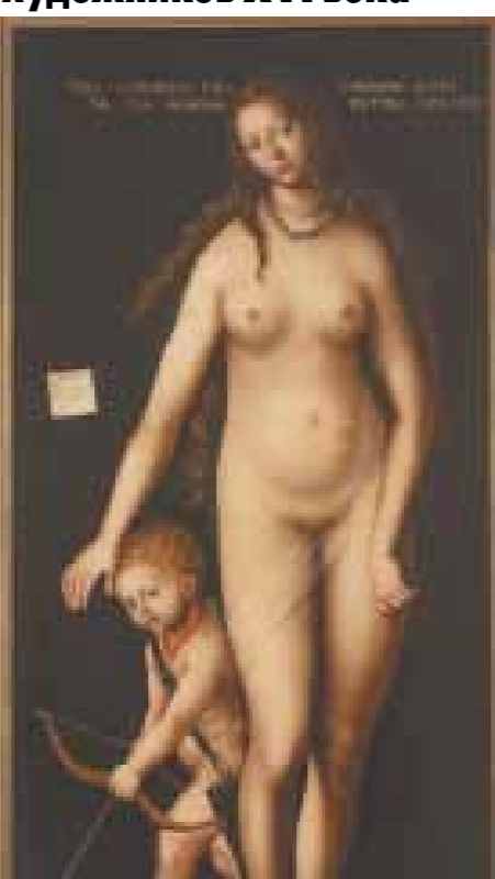
Лукас Кранах Старший. «Венера и Амур».

намекает на живительную силу христианской веры, утоляющую духовную жажду праведников. Пейзаж — тоже символ: гора — духовное возвышение над мирской суетой; скала — непоколебимая твердость и нерушимость истинной веры.