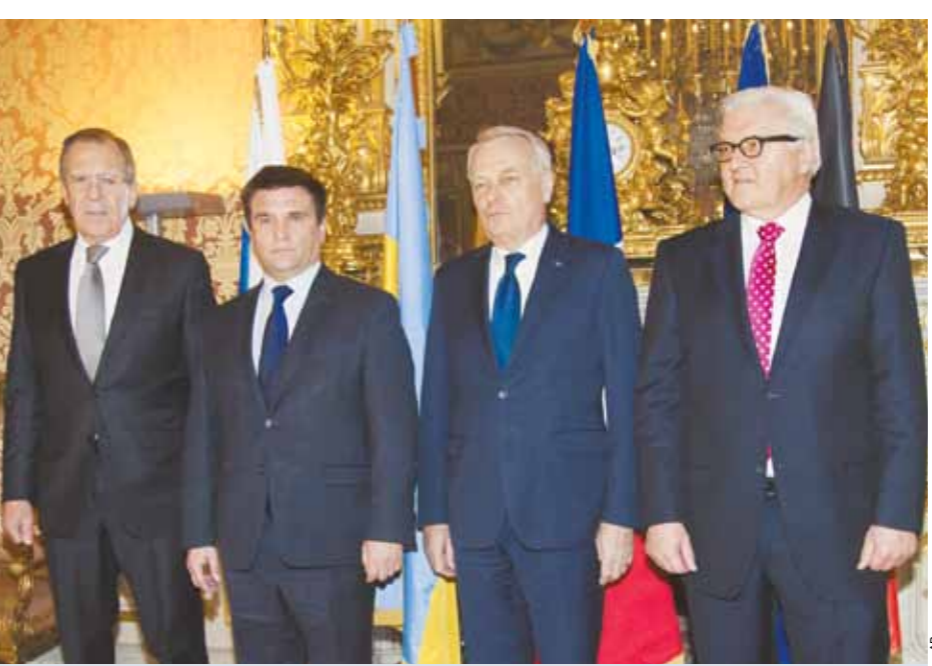
Украинского министра иностранных дел Климкина буквально заставили встать на протокольном фото рядом с нашим Лавровым. Но это, похоже, было единственное, что удалось Штайнмайеру и Эйро.

году президент Франции на встрече со своими коллегами по урегулированию конфликта говорил о минимально необходимых 80 днях с момента принятия закона до даты голосования. Естественно, успеть принять все это в течение оставшихся трех недель Порошенко не сможет. Тем более что на данный момент Верховная рада в принципе неработоспособна — после фактического развала парламентской коалиции у украинского президента нет не только 300 голосов для принятия конституционных поправок, но даже 226 не факт, что наберутся. Порошенко стоит перед неизбежностью досрочных выборов в Раду, потому как этот состав парламента более не работоспособен. И как бы ему ни хотелось отложить этот вопрос в долгий ящик, скорее в середине года состоятся пере- выборы Верховной рады, чем волеизъявление на Донбассе.