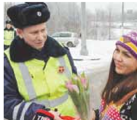
В весенний день хочу сказать Вам, Что Правила дорожного движенья Неукоснительны для соблюдения!