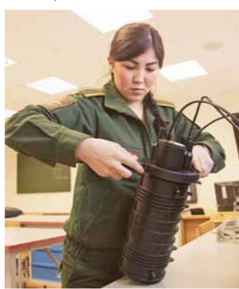
Курсанты женского пола изучают такие спортивные дисциплины, как гимнастика, рукопашный бой с оружием и без, преодоление препятствий, легкая атлетика.

Самыми сложными курсами считаются первый и четвертый. На первом нужно суметь перестроить себя психологически, научиться выдерживать сложный армейский ритм. На четвертом курсе начинается в полном объеме изучение спецпредметов, и учебные нагрузки выносятся также непросто.