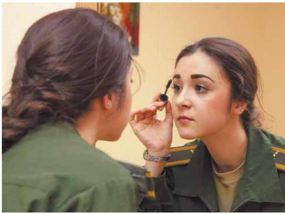
Коррижи. Вот и все «украшательства», ничего лишнего. И только в тумбочках яркие косметички.

Девочки живут по четыре человека в больших комнатах. На кровати поверх уставных шерстяных одеял светлые покрывала. Возле кровати