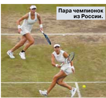
Пара чемпионок из России.