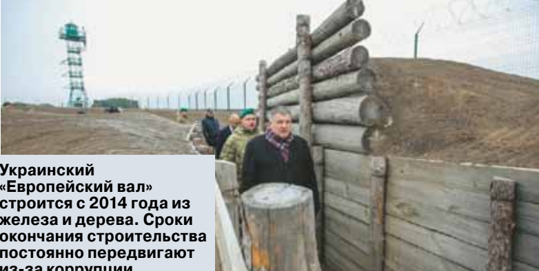
Украинский «Европейский вал» строится с 2014 года из железа и дерева. Сроки окончания строительства постоянно передвигают из-за коррупции.

Между тем в правительстве Украины заявили, что Киев нисколько не интересуется возведение забора, так как полуостров до сих пор остается украинской территорией. В частности, такую мысль высказал замминистра по вопросам временно оккупированных территорий Юрий Гримчак. Чиновник уверен, что российские власти укрепили рубеж между Крымом и его страной