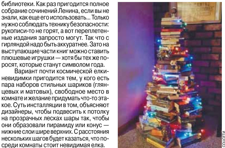
Книжная ель — это модно и интеллигентно, если не забывать о пожарной безопасности.