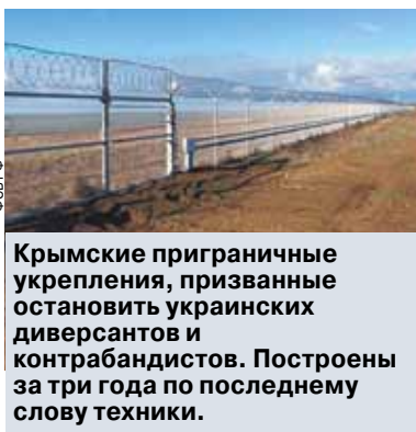
Крымские приграничные укрепления, призванные остановить украинских диверсантов и контрабандистов. Построены за три года по последнему слову техники.

Общая длина инженерных сооружений превышает 60 км. При этом там установили несколько сотен радиолучевых и вибрационных датчиков, а также камер видеонаблюдения. В результате контроль над местностью