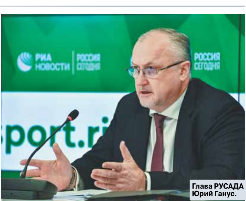
Глава РУСАДА Юрий Ганус.

от участия во всех международных соревнованиях», «мы лишимся права проводить на территории России соревнования международного уровня», «лишимся права участия в управлении международными спортивными организациями». Глава РУСАДА считает, что, отказываясь от выполнения условия, мы стоим на краю пропасти, и в связи с этим просит президента «защитить настоящее и будущее нашего чистого спорта, настоящие и будущие поколения спортсменов». Что будет дальше? Как в любой ситуации, возможны три варианта сценария. Первый мы назовем пессимистичным, хотя у кого-то может быть другая оценка. Доступ к базе открыт не будет. Таким образом будут защищены имена прославленных спортсменов, которые окажутся запятаны разве что подозрениями, но не доказательствами. Но тогда пропасть, о которой говорит не только Ганус, но и наша великая чемпионка Елена Исинбаева, откроет России всю свою бездонную глубину. Эксперты открыто говорят о том, что ВАДА пойдет на жесткие меры, потому что слишком сильной критике подверглось агентство после восстановления статуса РУСАДА. Российский спорт вполне может оказаться в изоляции, последствия которой и вправду можно отнести как катастрофические. Наши атлеты начнут менять спортивное гражданство, а будущие победители так и не будут воспитаны. Сценарий второй, оптимистичный