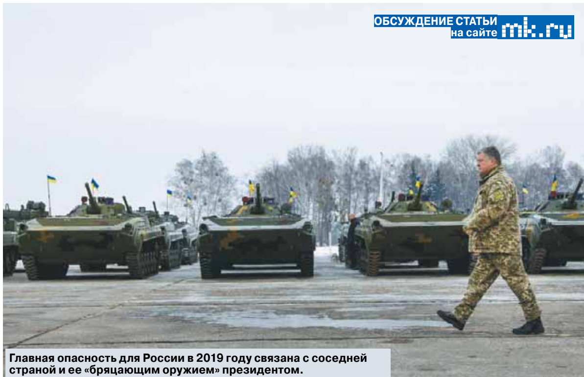
Главная опасность для России в 2019 году связана с соседней страной и ее «бряцающим оружием» президентом.

Чтобы разрушиться на деле, абсолютное политическое вакуум, каким является, скажем, война между Россией и Украиной, должно сначала разрушиться на словах. В 2018 году процесс такого разрушения в киевских политических кругах шел полным ходом. Введение военного положения из-за третьестепенного инцидента на море. Рассказы самых высоких киевских чиновников, включая секретаря Совета национальной безопасности Турчинова, о том, что Россия вот-вот «нападет на Украину» — все это, прежде всего, часть местечковых внутривнутриполитических игр. В киевской верхушке не хотят большой войны с Россией. Там хотят постоянно поддерживать ситуацию «на грани» и