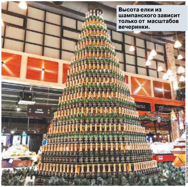
Высота елки из шампанского зависит только от масштабов вечеринки.