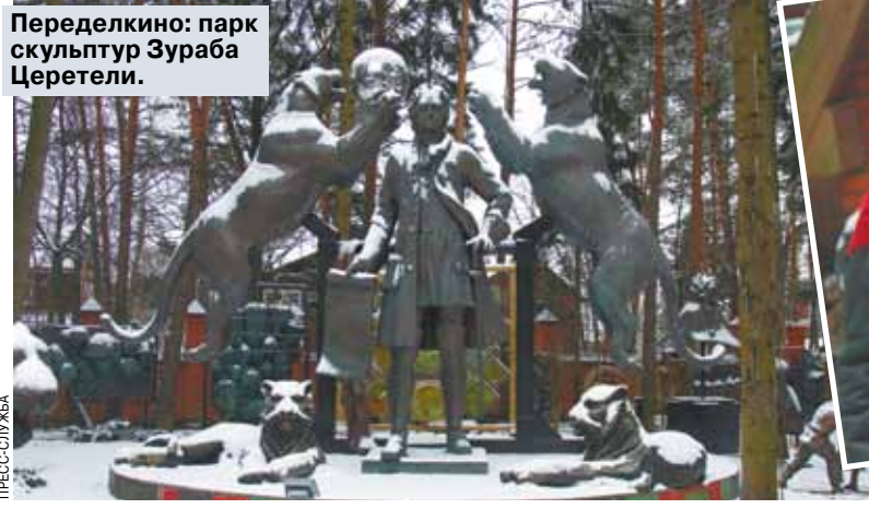
Переделкино: парк скульптур Зураба Церетели.

Президент Российской академии художеств накануне своего юбилея