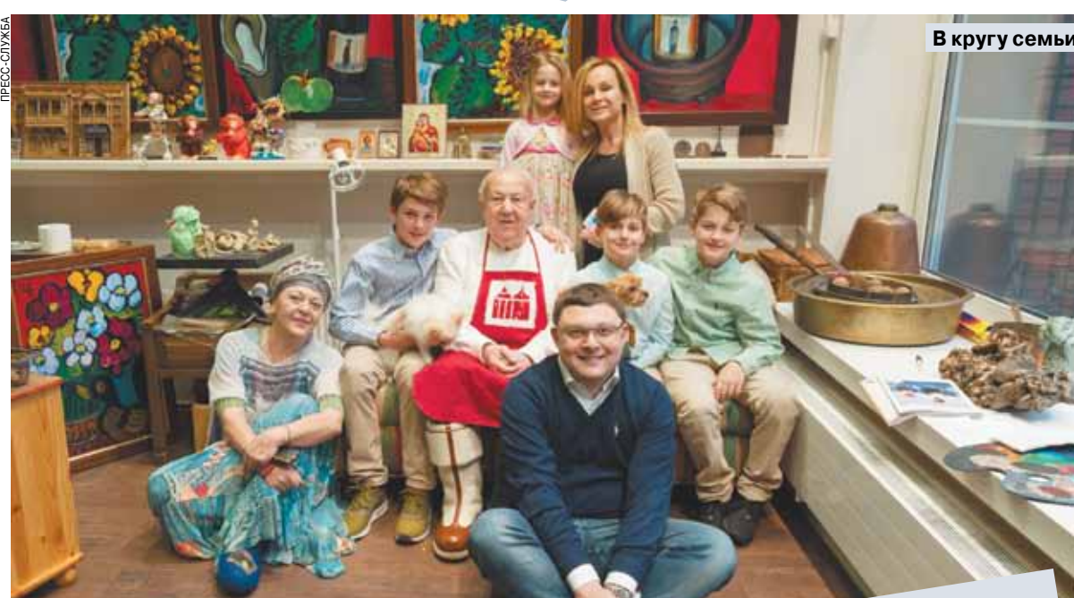
В кругу семьи.

— Прибегаю. Это жизнь моя. Вот сейчас на семинар искусствоведов 88 человек со всей страны приехали. Я с ними поговорил, интеллигентно так,