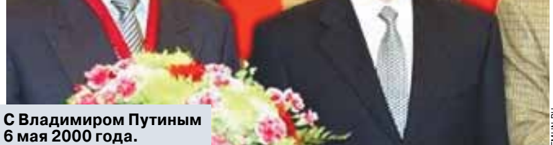
С Владимиром Путиным 6 мая 2000 года.