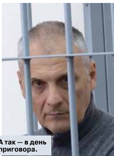
А так — в день приговора.