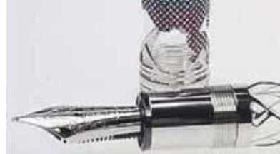
Ценности, изъятые у Хорошавина после ареста.

Уровень жизни губернатора Сахалина был не просто очень высоким, а сверхвысоким. Это проявлялось во всем, включая грандиозный автопарк.