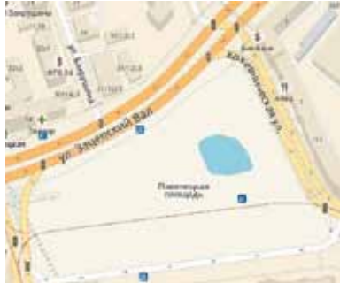
На месте долгостроя сначала появилось озеро, а потом — снежные горы.

На снимках со спутников в районе вокзала видна яма с зеленой водой, больше похожая на кратер от метеорита.