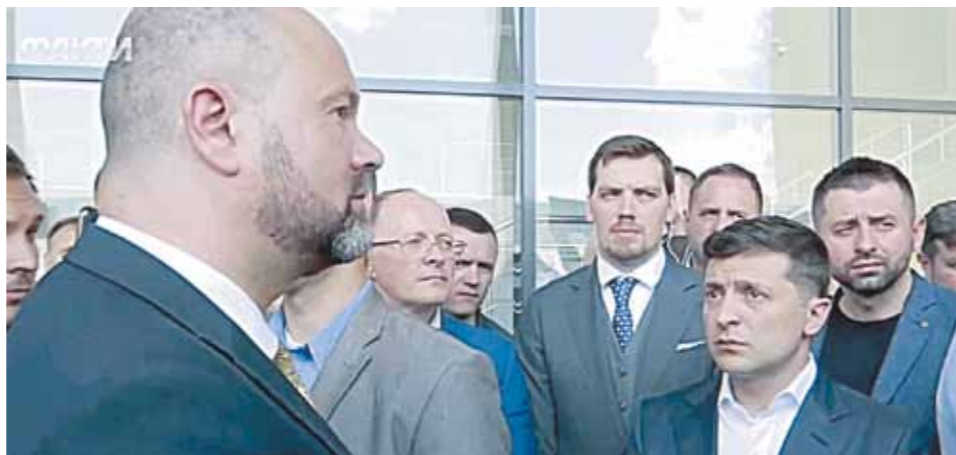
В последние дни перед выборами Зеленский увлекся прилюдным разносом чиновников, как это было в Николаеве (на фото).