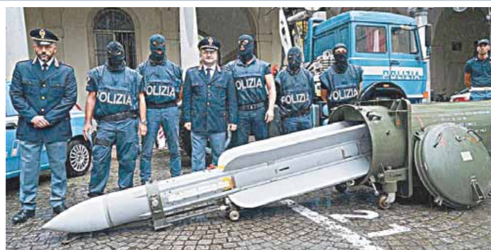
Итальянская полиция выясняет, зачем неонацистам потребовалась ракета «воздух-воздух».

Сразу после инаугурации Зеленский решил сделать себе имя на борьбе с Порошенко и командой.