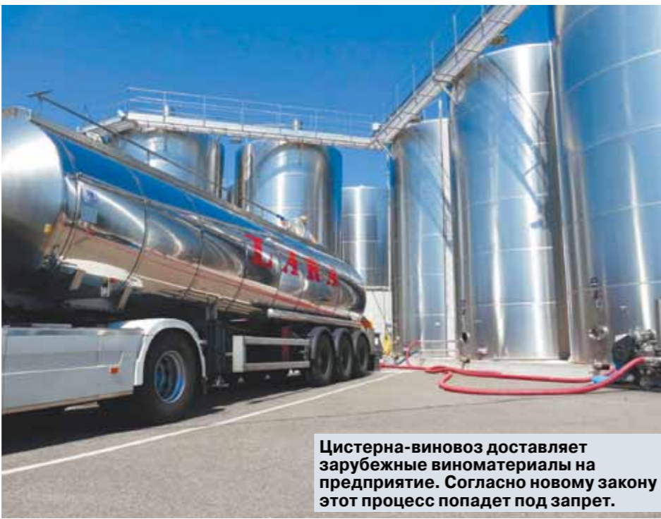
Цистерна-виновоз доставляет зарубежные виноделия на предприятие. Согласно новому закону этот процесс попадет под запрет.