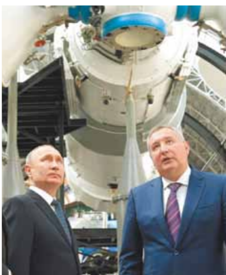
Дмитрий Рогозин рассказывает Владимиру Путину о светлом будущем.

Рогозин попытался выкрутиться: «Я вам могу сказать 45, 46, 47, но это пусть мои коллеги называют, я зачем буду забегать на их поляну? Здесь статистика — вещь такая, специфическая, потому что мы отнесли сюда именно ракеты космического назначения для выведения конкретных космических аппаратов.