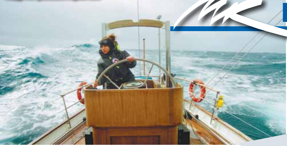
Кадр из фильма Aquarela.