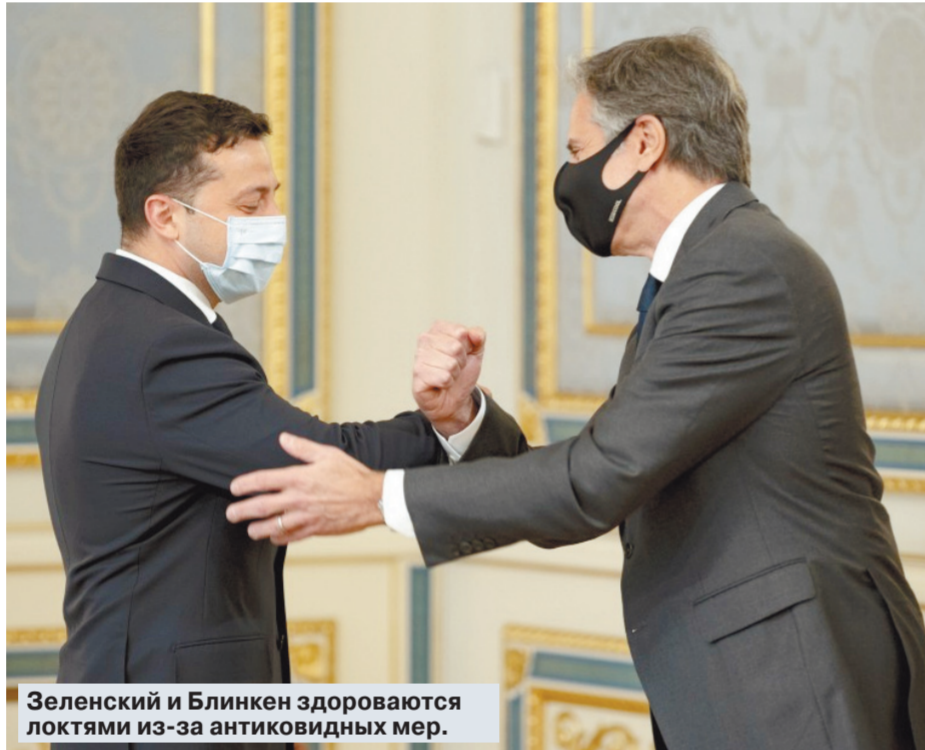
Зеленский и Блинкен здороваются локтями из-за антиковидных мер.

Глава Госдепа США Энтони Блинкен прилетел в Киев на два дня, чтобы встретиться с президентом Украины Владимиром Зеленским.