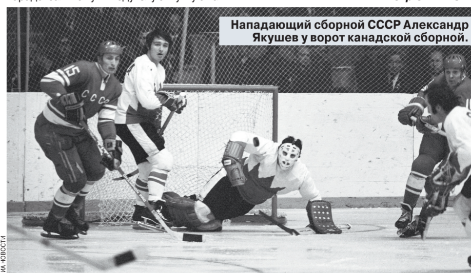
Нападающий сборной СССР Александр Якушев у ворот канадской сборной.