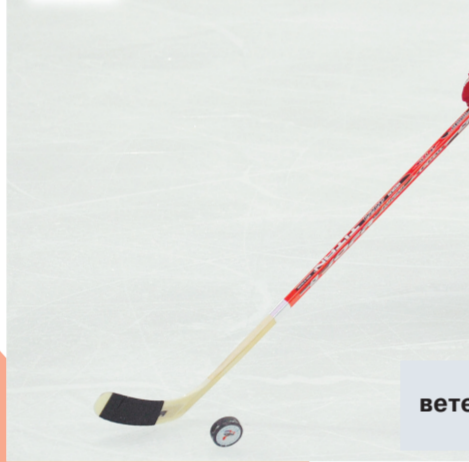
Александр Якушев во время матча ветеранов хоккея, посвященного 40-летию суперсерии 1972 года.

И не просто спортсмен, а легенда отечественного и мирового хоккея — форвард ЦСКА и сборной Анатолий Фирсов, к тому же орденносец. Могли как офицера сослать служить в самый дальний гарнизон страны — на Кушук, но предпочли обойтись с ветераном (Фирсову шел 32-й год) без шумихи — из состава сборной просто исчезла его фамилия. «Фирсов не поехал в Канаду в знак протеста из-за увольнения Тарасова, — вспоминал Якушев. — Он был благодарен Тарасову за все, что тот для него сделал: в 18 лет взял из «Спартака» в ЦСКА, много внимания уделял индивидуально, ценил, уважал, их отношения переросли в дружбу. Конечно, Фирсов был нам здорово помог в этой серии, с его мастерством, обводкой, шайками и бросками».