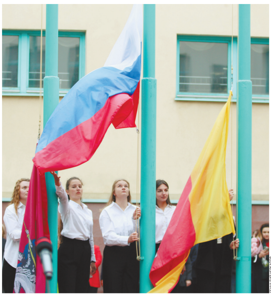
Старшеклассники в белых перчатках. Директор школы объявила, что они заслужили право поднять флаг своими успехами в учебе. «Теперь в школах будут создаваться такие специальные знаменные группы из прилежных учеников», — заметила одна учительница.