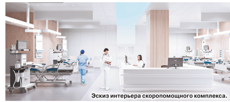
Эскиз интерьера скорпомощного комплекса.