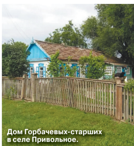
Дом Горбачевых-старших в селе Привольное.