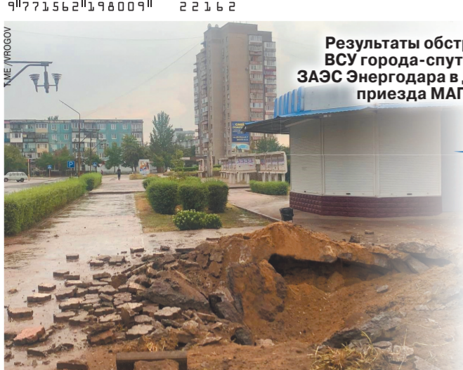
Результаты обстрела ВСУ города-спутника ЗАЭС Энергодара в день приезда МАГАТЭ.