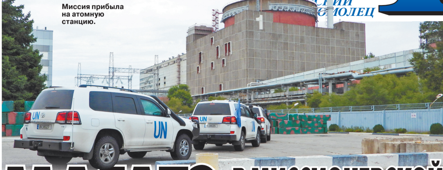
Миссия прибыла на атомную станцию.