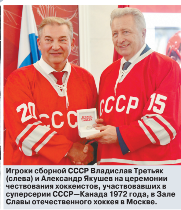
Игроки сборной СССР Владислав Третьяк (слева) и Александр Якушев на церемонии чествования хоккеистов, участвовавших в суперсерии СССР—Канада 1972 года, в Зале Славы отечественного хоккея в Москве.