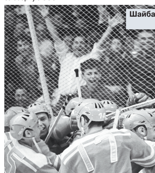
Шайба в воротах сборной команды Канады. Дворец спорта в Лужниках.

Я не скрыл своего удивления при этих словах, считая телосложение своего собеседника довольно могучим, но Якушев объяснил: «При росте 190 см я в то время был худенький, не взрывной, нужно было раскатиться, проще говоря, моя манера игры Тарасова не очень устраивала. Потому и говорю, что мог не попасть в состав».