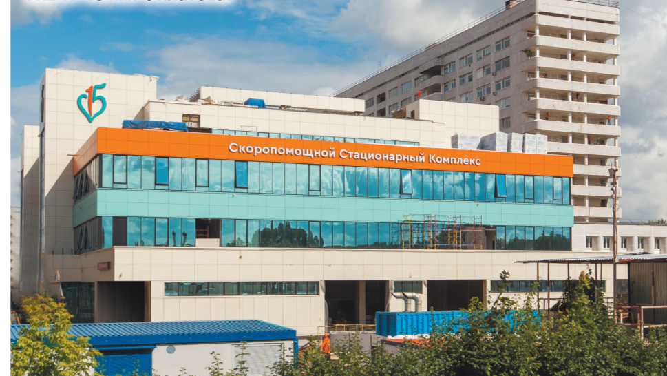
Скорпомощный комплекс ГКБ № 15 им. Филатова.