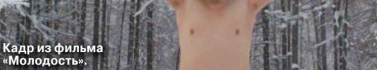
Кадр из фильма «Молодость».

Из-за отсутствия «Кинотавра» скопилось много российских картин, которые ждали своего выхода. К тому же российский кино дорожка на крупные международные фестивали закрыта, и это усугубило ситуацию. Эта лавина должна была найти выход. Потому и возникла новая программа в рамках ММКФ «Русские премьеры».