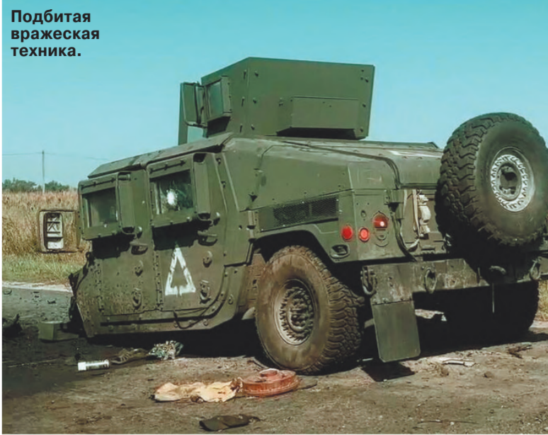
Подбитая вражеская техника.