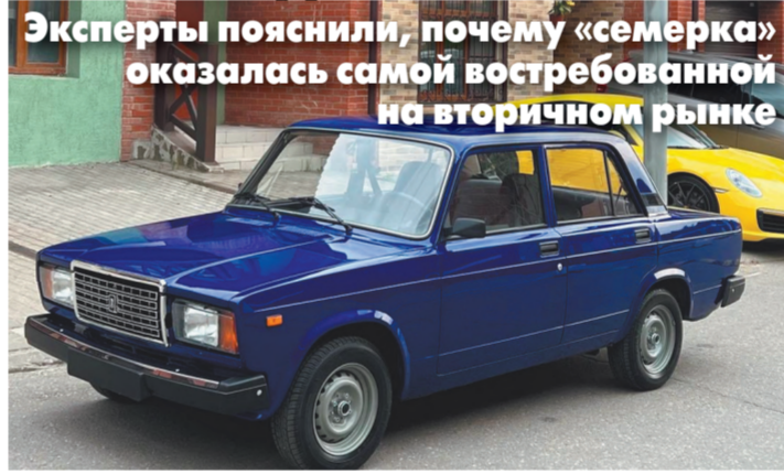
Эксперты пояснили, почему «семерка» оказалась самой востребованной на вторичном рынке

Подержанные автомобили вновь пошли в рост — и по цене (что, впрочем, не прекращалось в последние годы), и по цифрам продаж. Продажи б/у машин в июле этого года достигли пика по отношению к июню, и к прошлому году. При этом больше всего было продано архаичных по нынешним временам «Жигулей» — «ВАЗ-2107», — снятых с производства еще в 2012 году! С чем связан неожиданный ренессанс модели, которую в Москве (но не в регионах!) давно списали со счетов, — выяснял «МК».