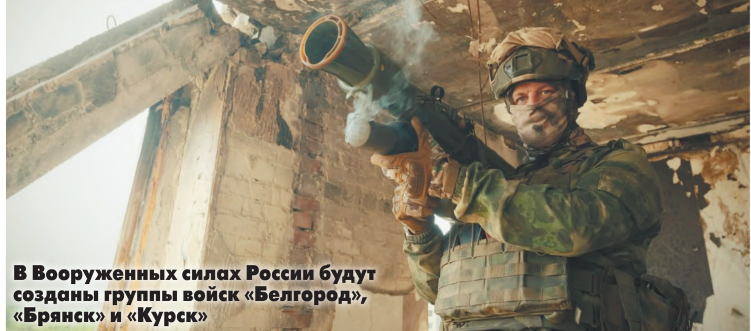
В Вооруженных силах России будут созданы группы войск «Белгород», «Брянск» и «Курск»