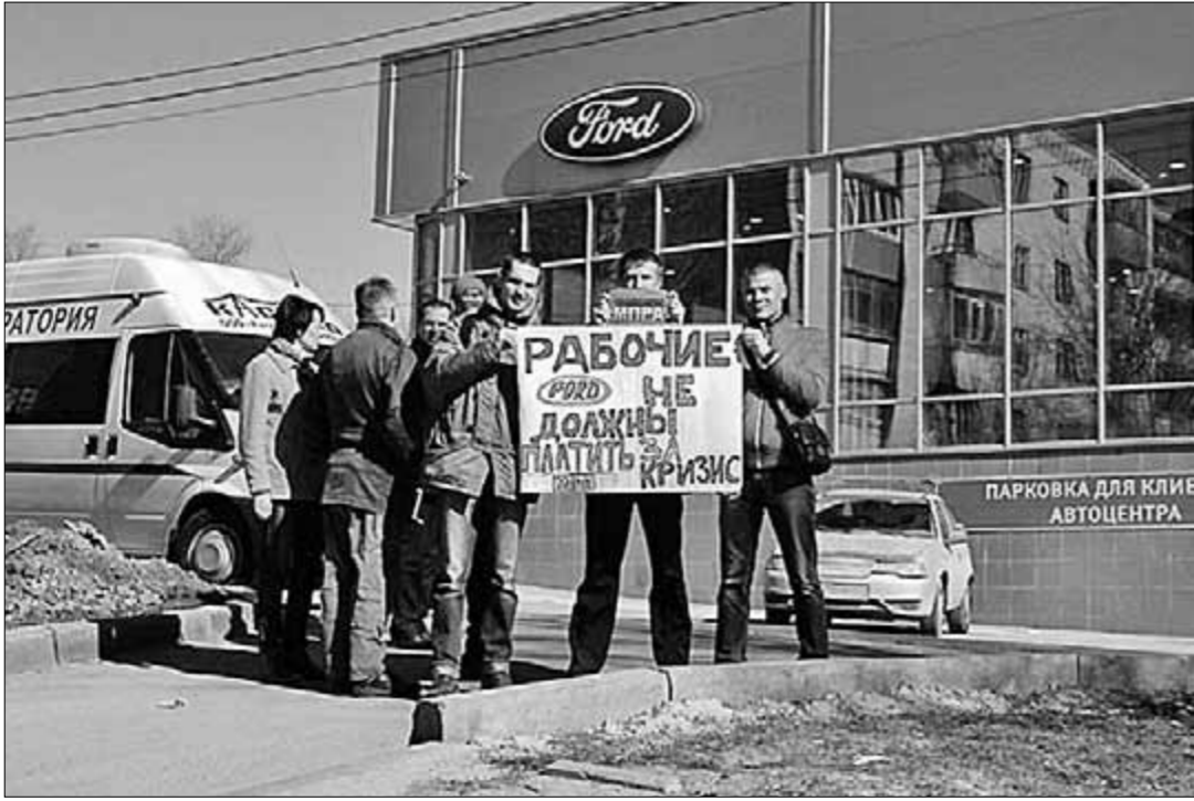
Перед зданием дилерского центра «Форд» в Калуге прошла акция солидарности с рабочими, бастующими в городе Всеволожске Ленинградской области, где расположен один из заводов автоконцерна.

что за последние два года средняя зарплата работников «Форда» упала до 27 тысяч рублей в месяц. Причина — режим неполной рабочей недели, введённый на предприятии, и длительные простои по вине работодателя.