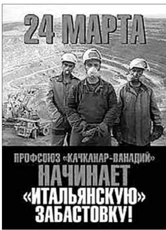
Цель забастовки — показать руководству ЕВРАЗа, что наступление на права и интересы рабочих Качканарского ГОКА приведёт к незамедлительной реакции всего трудового коллектива.

На крупнейшем предприятии Свердловской области ОАО «ЕВРАЗ КГОК» (Качканарский горно-обогатительный комбинат), где трудятся более 6500 человек, профсоюзом «Качканар-Ванадий» объявлена забастовка. В её организации рабочим активистам помогает руководство Свердловского обкома КПРФ.