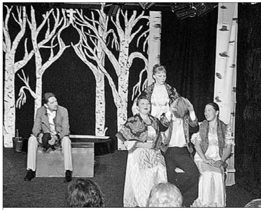
● «Играем Пушкина».

Двадцать лет назад эта идея казалась совершенно невероятной. Затеять театральный фестиваль «Русская классика» в маленьком подмосковном городке Лобня, когда и в самой столице людям было не до театра, казалось затеей фантастической. К тому же фестиваль ориентировался исключительно на русскую драматургию! Но подтвердилось: если люди страстно любят своё дело, настойчивы в достижении цели, а цель благородна, всё у них получится.