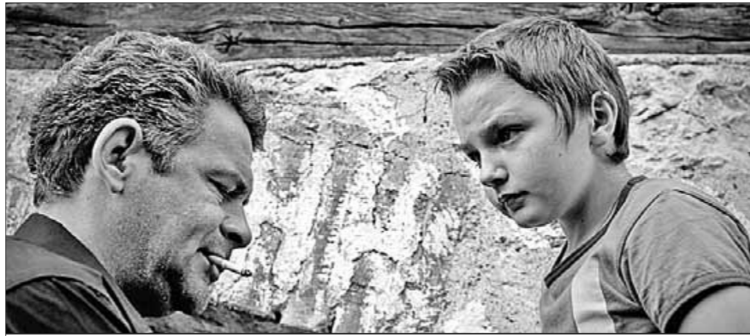
● Кадр из фильма «Анклав».

но-этических проблем нашего времени. Действие происходит в Косове, отторгнутом у Сербии при попустительстве европейского сообщества. Теперь здесь самостоятельное албанское государство. Война за эту землю закончилась, но мир так и не наступил. Коренные жители-сербы терпят притеснения и унижения. Картина не претендует на политическое осмысление происходящего. Но гуманистический посыл ясен: нельзя, чтобы люди жили на своей земле в анклавах, как в резервациях. Образ расстрелянного колокола, который никак не удаётся воздвигнуть над православной часовней, вырастает до символа поруганной веры