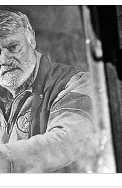
● Кадр из фильма «Жнец».

События в такси принимают этически-криминальный оттенок, когда в автомобиле Панахи подсаживается его бывший сосед, уважаемый мужчина, повествующий о том, что ему не хватило мужества донести на грабителя после того, как увидел в новостях публичную казнь. Впрочем, наиболее увлекательным кажется эпизод, в котором появляется племянница режиссёра, десятилетняя болтушка, рассуждающая обо всём на свете и рассказывающая о своём домашнем задании — снять для школьного конкурса собственный фильм по всем правилам цензуры: героини в платках, только исламские имена (желательно в честь одного из пророков), никакого насилия, ругательства, счастливого конца и отступительной чернухи. Словом, «Такси» — это целый набор маленьких историй разного жанра, в которые Панахи вло-