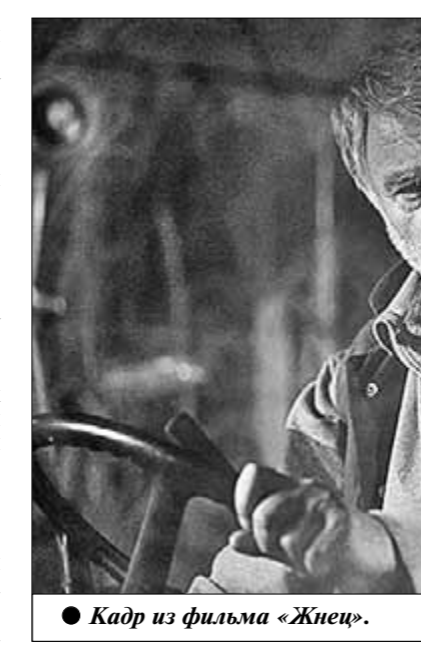
● Кадр из фильма «Жнец».

И вот теперь местом действия очередного тельца выбран колесийный — вопреки всем запретам — по суматошным и неутопленным улицам Тегерана жёлтый автомобиль, за рулём которого сидит сам представитель «новой волны»