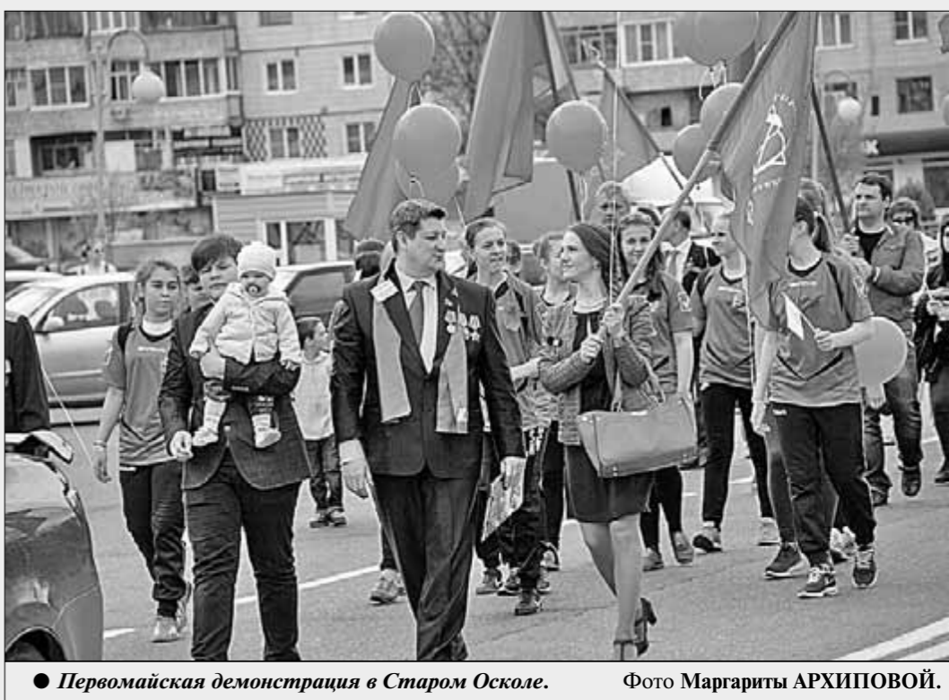
Первомайская демонстрация в Старом Осколе.

Наш почтовый адрес: 127137, Москва, а/я 22, редакция газеты «Правда». Электронный адрес: pravda@cnt.ru