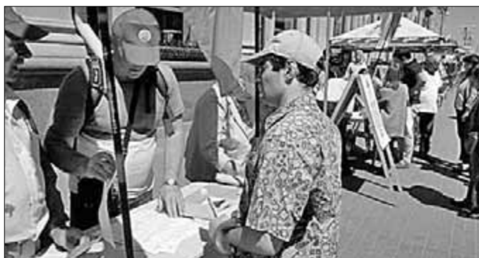
Коммунисты приступили к сбору подписей в поддержку выдвижения кандидатом в президенты Республики Беларусь действующего главы государства Александра Лукашенко.

В ОКТЯБРЬСКОМ РАЙОНЕ сбор подписей избирателей проходил на площадке перед зданием железнодорожного вокзала. Только за первые пару часов работы инициативной группы подписи и паспортные данные в поддержку кандидата оставили десятки человек.