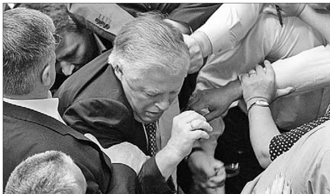
Таковы аргументы у сторонников нынешней украинской власти. Сайт yandex. ru.

Пресс-служба ЦК Приднестровской коммунистической партии.