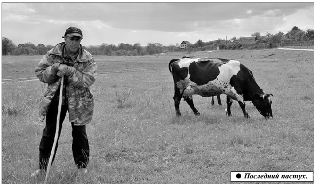
● Последний пастух.

Надо вернуть животноводство в каждую деревню, что позволит не только создать там новые рабочие места, но и стимулы для благополучного проживания. Выход видится в создании малых производственных кооперативов, прежде всего в молочной отрасли. Для таких кооперативов не требуется крупных капитальных вложений. Коровы могут содержаться на подворьях членов кооператива, которым придётся сложиться и потратиться на покупку небольшого подержанного трактора, косилки, пресс-подборщика. Часть этой техники может быть в наличии у некоторых членов кооператива. Смысл создания кооператива в том, чтобы обеспечить заготовку кормов для коров, принадлежащих пожилым крестьянам. Часть пенсионеров хотели бы держать корову, но не хватает сил заготовить для неё корма (примерно десять везов сена и соломки на зимовку). Вторая причина — трудно нанять пастуха в селе, где осталось всего два-три десятка коров, расселённых по домам, расположенным друг от друга на протяжении 3—4 км.