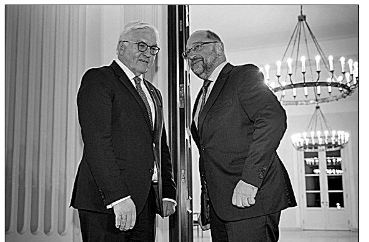
Спасут ли президент Штайнмайер и лидер СДПГ Шульц коалицию для Ангелы Меркель?

Каковы же сейчас позиции сторон? Ангела Меркель чётко дада понять, что постарается избежать остающихся теоретически возможных вариантов правительства меньшинства в бундестаг. В условиях целого ряда международных кризисов и необходимости иметь дело с такими не всегда предсказуемыми, мягко говоря, партнёрами, как Дональд Трамп или Реджеп Эрдоган, будущему канцлеру Германии нужен крепкий и стабильный тыл в виде правительства парламентского большинства.