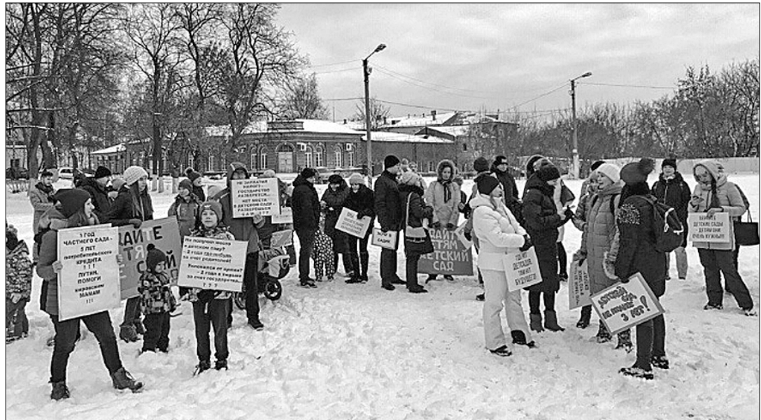
Очередной митинг родителей, чьим детям не досталось места в детском саду, прошёл в городе Кирове. На акцию протеста, состоявшуюся в местном парке, вышли более сотни человек.

садов не решат проблему нехватки мест. Родители требуют денежной компенсации за вынужденное непосещение детских садов. Заметим: многие из них пришли протестовать с детьми, которым нет ещё и года.