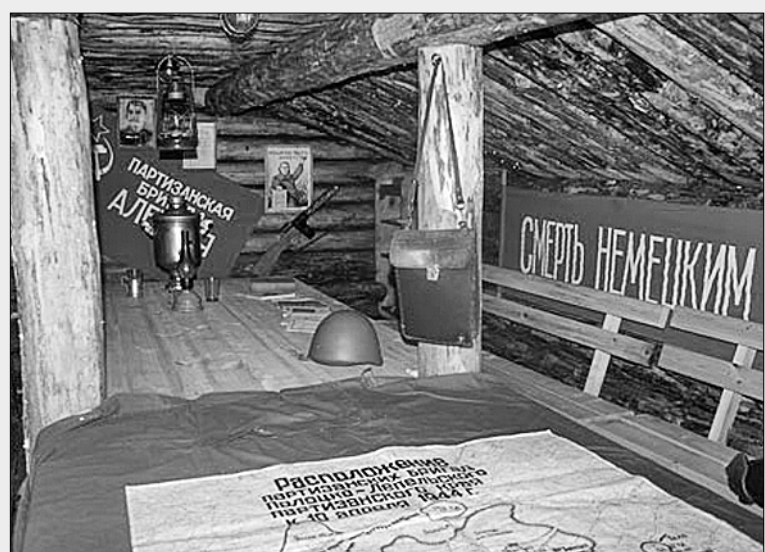
● Партизанский штаб (фрагмент мемориала «Прорыв»).

Учредители — журналистская организация АНО «Редакция газеты «Правда», Коммунистическая партия Российской Федерации