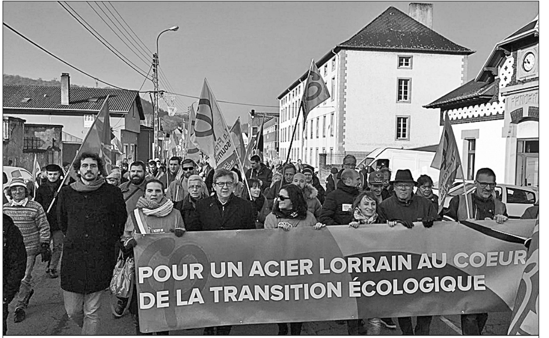
Жан-Люк Меланшон и депутаты парламента от «Франции непокорённой» с рабочими сталелитейного завода в г. Флоранж.

Подъём «Франции непокорённой» отражён, в частности, в заголовках материалов СМИ, нагнетающих напряжённость по отношению к популярному движению: «Заявка на поглощение Меланшоном всей оппозиции» («Либерасьон»), «Валос возвращение Сошпарти в тени Меланшона» («Фигаро») и им подобных. Опасность для власти представляют также приближающиеся выборы в Европарламент, которые должны прерваться, по мнению Меланшона, в экстазе для Макрона и стоящих за ним сил. Нельзя ис-