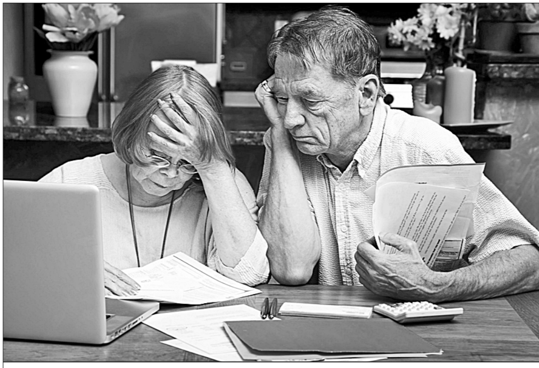
● Здрава пенсионную планку, власть породит многомиллионную армию безработных.

Около 32% российских компаний не будут принимать на работу сотрудников предпенсионного возраста. Об этом говорится в исследовании Института Адизеса. В опросе приняли участие 160 собственников и гендиректоров компаний из сегмента крупного бизнеса из ЦФО, СФО, ПФО, ЮФО, Сибири и Урала. Как сообщает РБК, 29% респондентов заявили, что готовы нанимать предпенсионеров в лучшем случае на низовые должности, а ещё треть компаний будут принимать на работу людей преклонного возраста лишь в случае высокой квалификации.