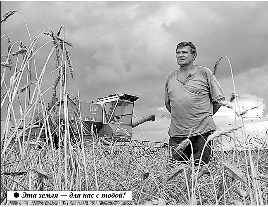
● Эта земля — для нас с тобой!

Для понимания картины из обихих цифр перейдём к конкретным показателям деятельности ключевых участников сельхозпроизводства в Тамбовской