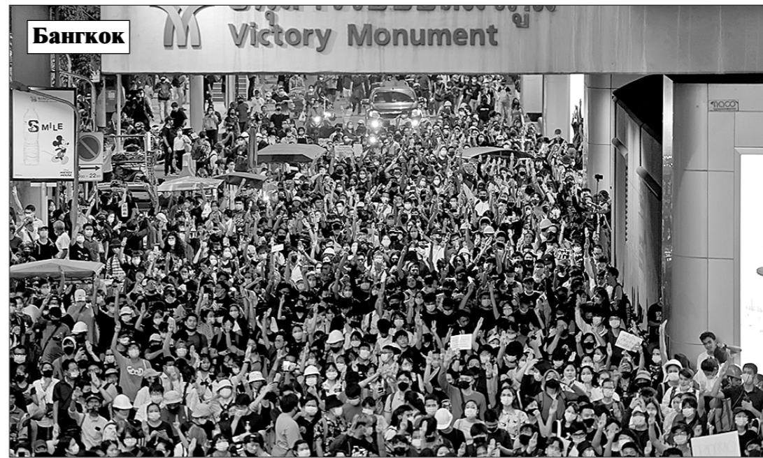
Бангкок. Участники манифестации в Бангкоке, столицы Таиланда, вновь вышли тысячи недовольных. Демонстрации также состоялись в провинциях Лопбури,

истёк срок ультиматума, предъявленного премьер-министру Праюту Чан-Оча протестующими 21 октября на массовой акции у Дома правительства: манифестанты требовали, чтобы генерал подал в отставку в течение трёх дней, иначе акции возобновятся с новой силой. Поскольку реакция властей не последовала,