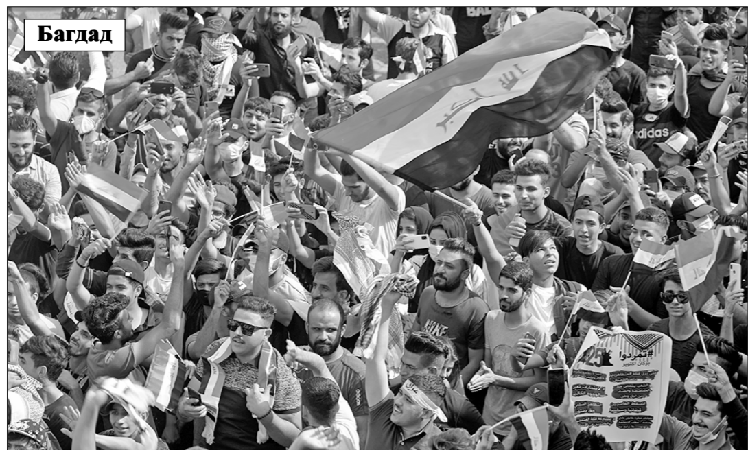
Багдад. Участники манифестации в Багдаде, разогнанной полицией.

Однако год спустя ситуация в стране, занимающей 12-е место среди наиболее коррумпированных государств планеты, только ухудшилась: дополнительную «ленту» внесла пандемия коронавируса, в результате чего безработица среди молодёжи достигла 25%. Именно об этом говорили участники мирной манифестации в Багдаде, разогнанной полицией. Демонстранты, пытавшиеся прорваться к центру столицы, перекрывали силами безопасности,