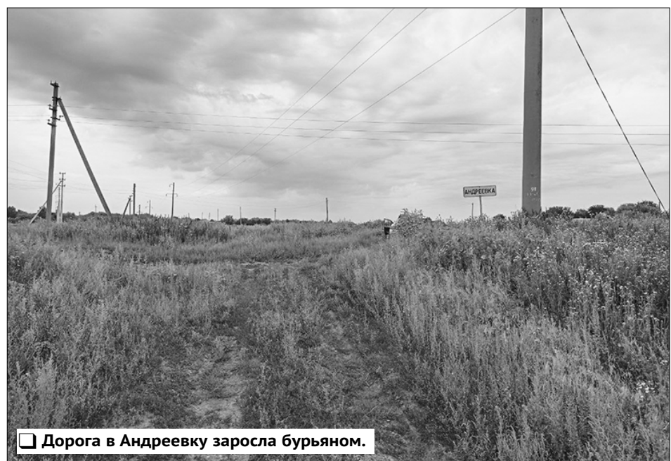
Дорога в Андреевку заросла бурьяном.