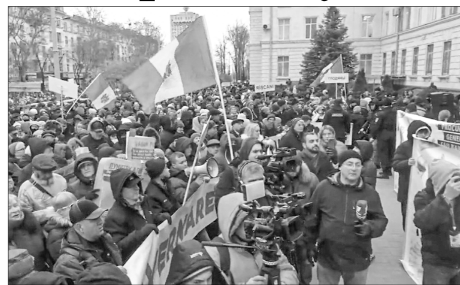
В понедельник в центре Кишинёва собрались более десяти тысяч граждан, включая представителей и сторонников партии «Шор» и Партии коммунистов Республики Молдова, чтобы потребовать немедленной отставки правительства, президента, а также и.о. генпрокурора Иона Мунтяну.

П ротестная колонна собралась на площади в центре столицы. На транспаранте, который держали люди, было начертано: «Долой Санду! Долой правительство PAS!» — на крупном плакате с изображением Мунтяну: «Генпрокурор или барондомовладелец?». Затем перед зданием Генеральной прокуратуры состоялся митинг.