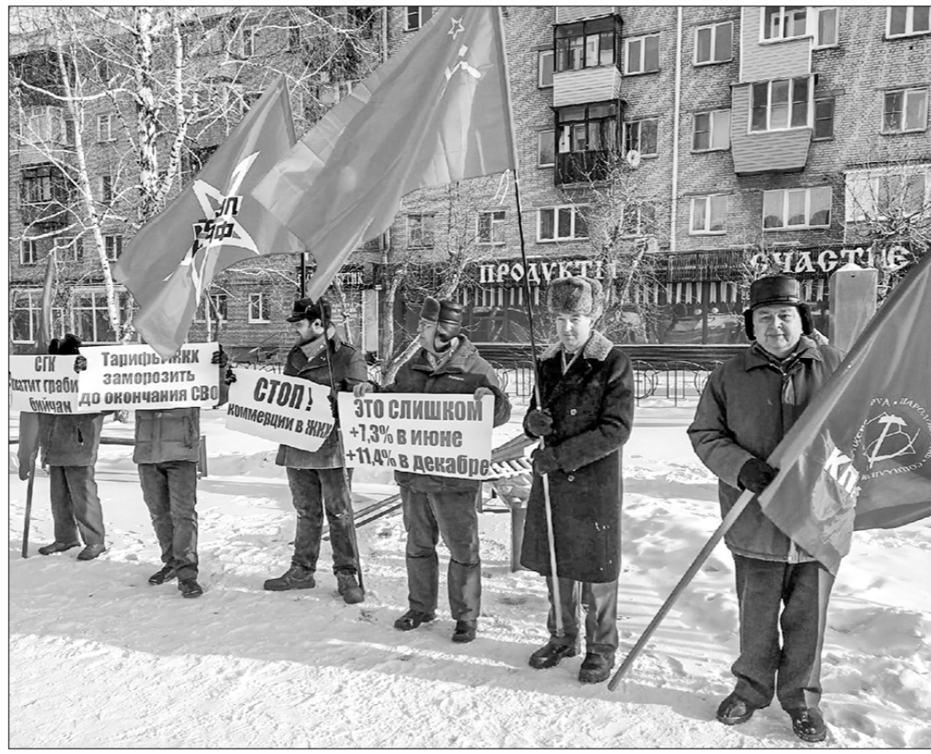
По сообщениям информантов.