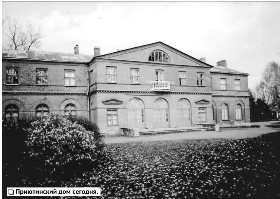
Приютинский дом сегодня.