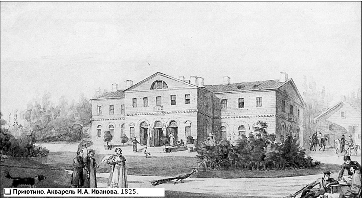
Приютиню. Акварель И.А. Иванова. 1825.

Ответы на кроссворд «Девять букв», опубликованный в №56 1. Вегетация. 2. Эскалатор. 3. Делегация. 4. Синтаксис. 5. Короленко. 6. Философия. 7. Стремнина. 8. Альбатрос. 9. Репертуар. 10. Наказание. 11. Баловство. 12. Картограф. 13. Обмуровка. 14. Лютеранин. 15. «Жаворонок». 16. Фарандола. 17. Калорифер. 18. Субмарина. 19. Багратион. 20. Сковорода. 21. Закруткин. 22. Ярославна. 23. Самарканд. 24. Партитура. 25. Штукетник. 26. Здраница. 27. Приоритет. 28. Кручинина. 29. Директива. 30. Литосфера.