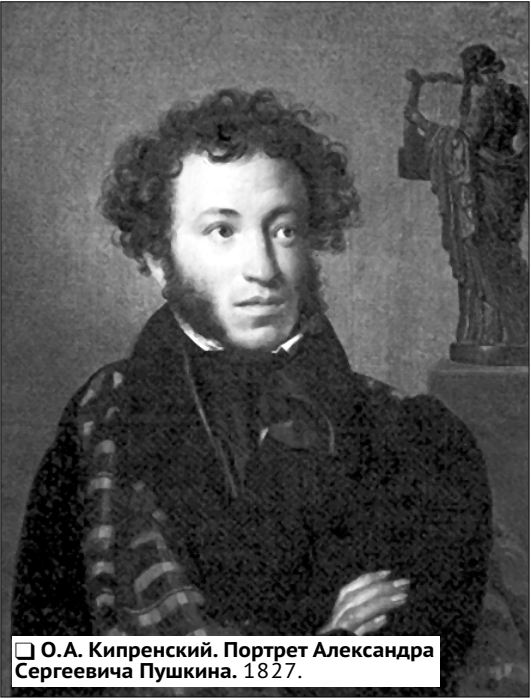
О.А. Кипренский. Портрет Александра Сергеевича Пушкина. 1827.

Здесь даже воздух, кажется, весь пронизан поэзией. В Приютино и о Приютине написаны десятки стихов. Например, вот это, сорвавшееся с кончика пера у поэта Константина Николаевича Батюшкова: