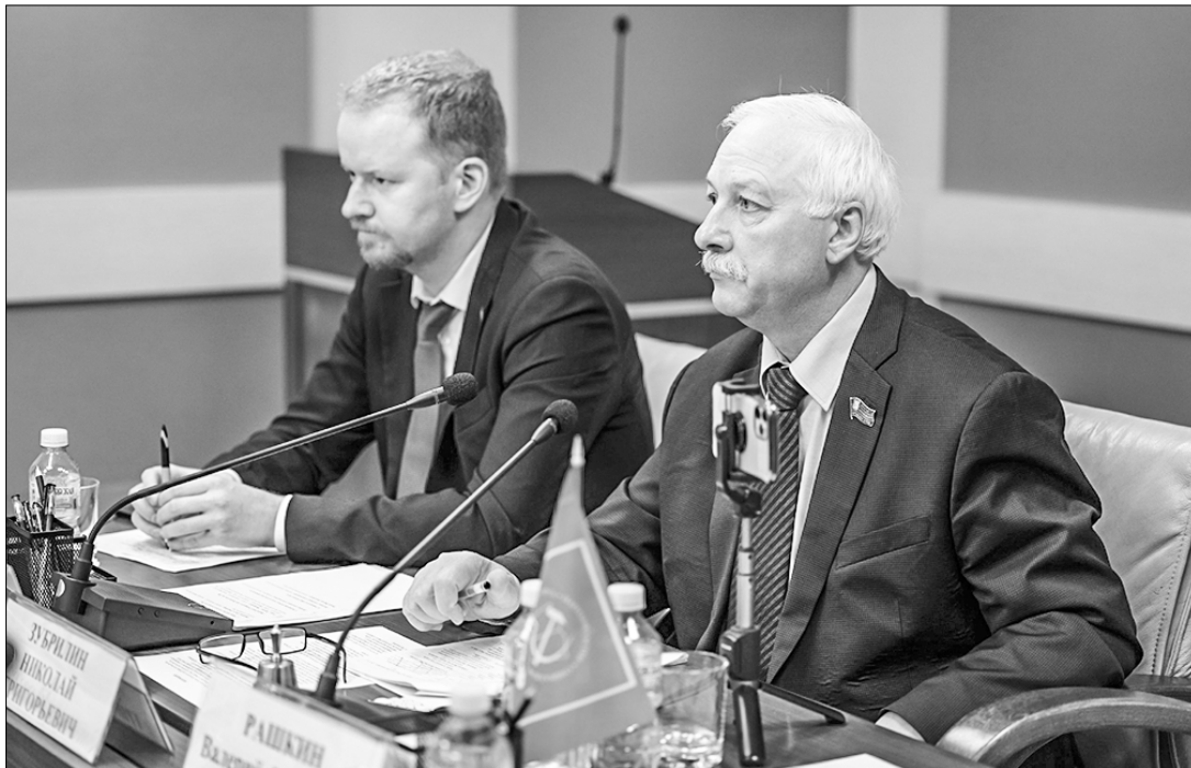
Секретари МГК КПРФ — руководитель фракции Компартии в Мосгордуме Н.Г. Зубрилин (справа) и депутат Госдумы Д.А. Парфёнов (слева).

Арендные платежи — это тоже рынок, и он зависит от состояния цен на электроэнергию, холодную и горячую воду, отопление, от уровня цен на жилые и нежилые помещения, этажности и категории здания. Рентабельность арендных помещений не должна быть выше 50% от цены содержания помещения, всё, что выше, — это спекулятивная цена, ведущая к удорожанию товаров и продук-