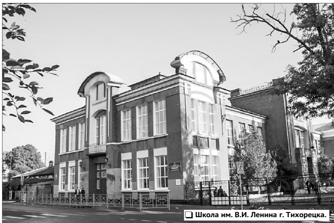
Школа им. В.И. Ленина г. Тихорецка.

Имя Ленина она всегда несла с честью, у нас есть Красное знамя, врученное школе за победу в социалистическом соревновании 1959 года.