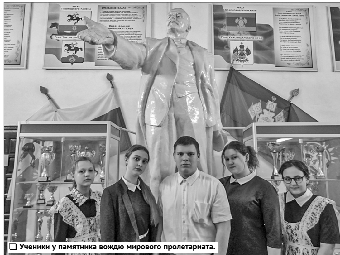
Ученики у памятника вождю мирового пролетариата.