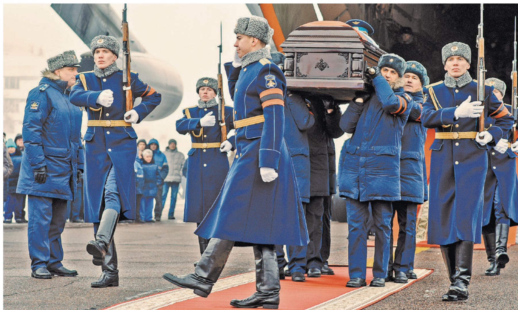
Военного летчика Романа Филипова, погибшего в Сирии при выполнении задач в районе Идлиба, похоронили с воинскими почестями под оружейные залпы на Аллее славы Коминтерновского кладбища в Воронеже.