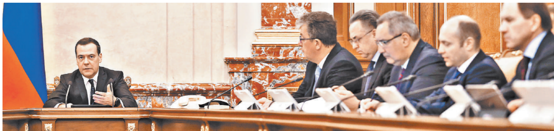
Правительство продолжает совершенствовать правовую базу к чемпионату мира по футболу.

Поправки в законодательство исключают из числа нарушений антимонопольного законодательства, при совершении которых выдается предупреждение, действия, определенные статьей 20 Федерального закона № 108. Они относятся к коммерческим правам ФИФА. Предуематривается, что этот порядок будет применяться до 15 августа 2018 года.