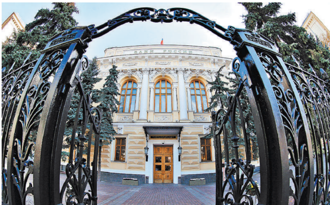
В учреждениях типа Банка России требуются люди с безупречной репутацией. Полиграфу их определить легче.

Один из собеседников «РГ» проходит проверку на полиграфе каждый год, так как его работа сопряжена с высоким уровнем ответственности и серьезными финансовыми потоками. Вопросы касаются того, брали ли сотрудники откаты, раскрывали ли конфиденциальную информацию и так далее. В силу специфики работы к подобным проверкам персонал относится спокойно, единственный минус — они отнимают немало времени. Тест может длиться весь рабочий день. К тому же это недешевое удовольствие для работодателя, который часто нанимает штатного полиграфолога.