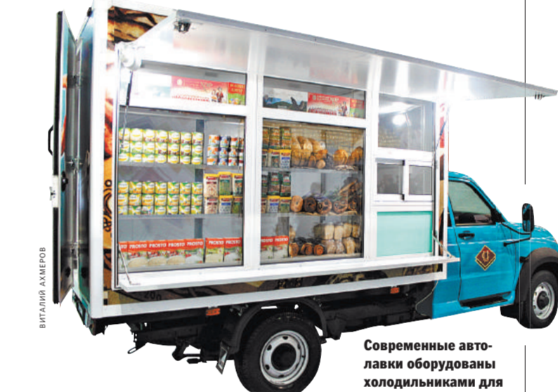
Современные автолавок оборудованы холодильниками для хранения продуктов.

По словам председателя Центросоюза Дмитрия Зубова, цель форума — масштабно представить новую идеологию кооперации как уникальную форму самозанятости и самоидентификации, объединения людей разных