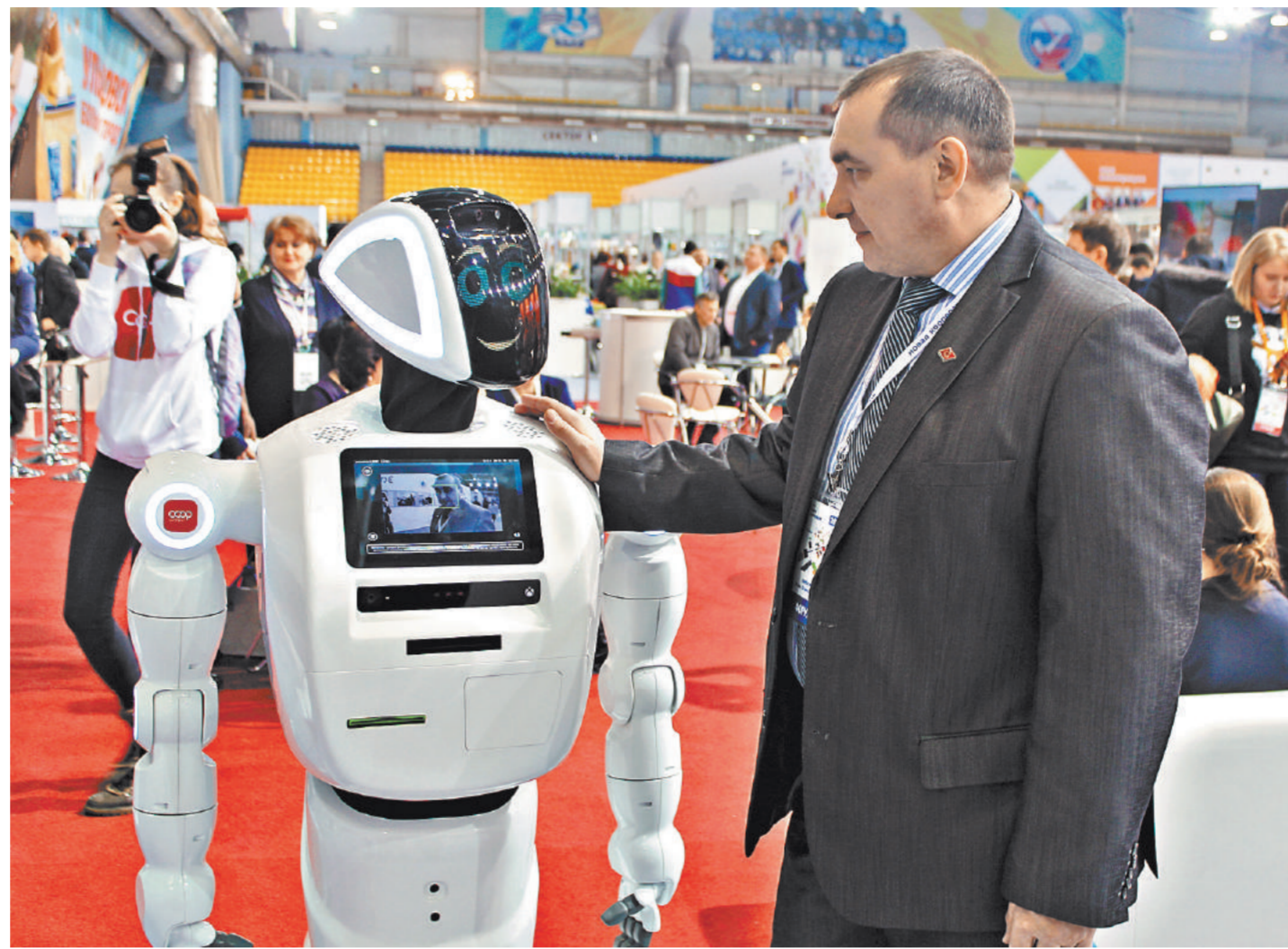
Самым популярным экспонатом выставки стал робот РобоКооп, который мог дать ответ на любой каверзный вопрос гостя о кооперации.