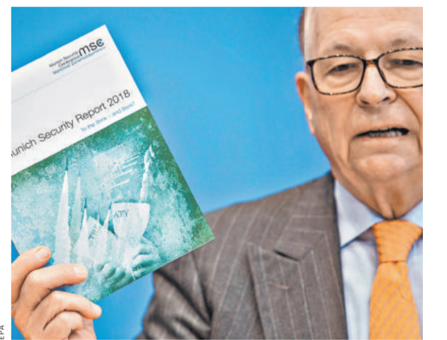
Вольфганг Ишингер с докладом «До края и обратно», написанным для затравки дискуссии. Но пока западные политики из года в год спорят в Мюнхене об одном и том же, с безопасностью в Европе становится только хуже.

Среди других «ответвлений» предстоящего Мюнхена следует отметить, во-первых, тему борьбы с терроризмом (Ишингер считает победу над запрещенной в РФ группировкой «Исламское государство» обыкновенным «шоу»). И во-вторых, угрозы, которые несет киберпространство, где, по мнению Ишингера, сложилась ситуация, которая была в реале XIX века на американском Диком Западе, когда «любой мог бегать с пистолетом и стрелять в кого угодно, потому как полиция нет».