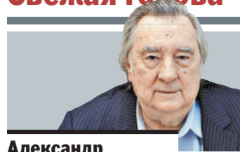
Александр Проханов писатель, общественный деятель