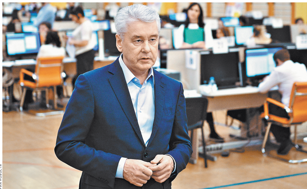
Сергей Собянин обратился к бизнесу: «Помощь придет быстрее! А вам следует помнить о работниках».

Он потребовал убрать требование двух безуспешных попыток трудоустройства, которые в «обычные» времена предшествуют признанию гражданина безработным. Мэр подчеркивает: «Помощь должна приходиться быстро. Между подачей заявления и решением о перечислении средств должно проходить от 3 до 5 дней. Оформление должно осуществляться исключительно в электронном виде. А процедура проверки должна быть необременительной». Порядок будет разработан в ближайшие дни, пообещал Собянин. Обращаясь к бизнесу, он просит максимально обеспечить доходы работников, не «сокращать» их. «Ваши работники — основа нашего благополучия и будущего. Очень прошу не забывать об этом», — пишет Собянин. ●