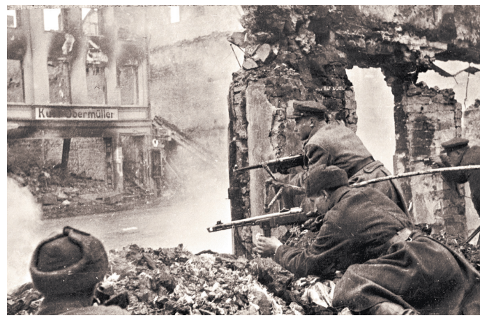
В Кенигсберге и пригородах советскими войсками было захвачено свыше 3,5 тысячи орудий и минометов, около 130 самолетов и 90 танков.

Советское командование 8 апреля предложило противнику сдаться, но последовал отказ. Тогда наступление продолжилось. Вновь в дело вступил «бог войны» — артиллерия. Когда немецкому командованию 9 апреля стало ясно, что кенигсбергской группировке грозит полное истребление, оно приняло решение капитулировать. Над Кенигсбергом взметнулось Красное знамя. В ночь на 10 апреля 1945 года Москва салтовала мужеству советских воинов 3-го Белорусского фронта, взявших Кенигсберг 24 артиллерийскими залпами из 324 орудий.