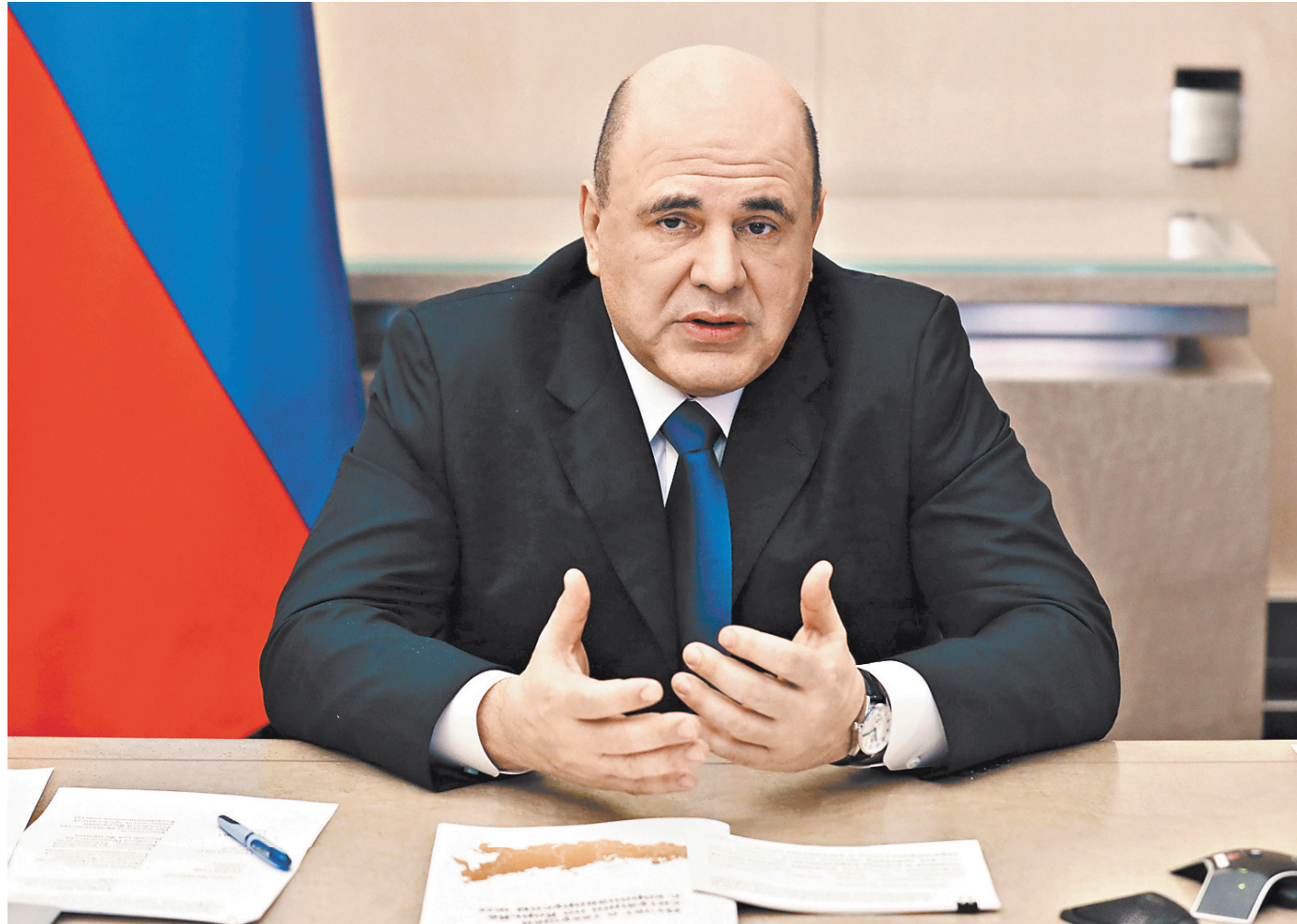
Михаил Мишустин: Меры по борьбе с коронавирусом должны быть адресными, учитывать особенности того или иного региона.

Мишустин вновь вернулся к особенностям борьбы с заболеванием в регионах. Администрации субъектов РФ получили право самостоятельно решать, какие меры им необходимо вводить в зависимости от ситуации, в том числе определять отрасли и предприятия, чья работа должна быть продолжена. Производства, обратившие внимание премьер, обяжут учитывать при этом требо-