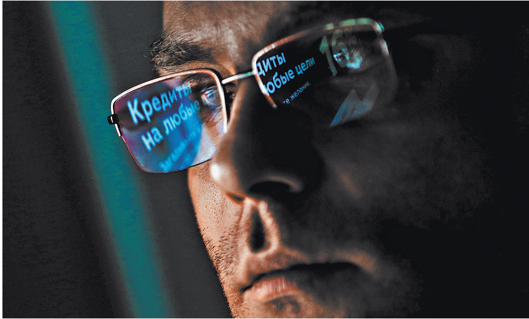
Кредиты с нулевой ставкой на выплату зарплат будут выдавать около 90 банков, они охватывают почти все малые и средние предприятия.