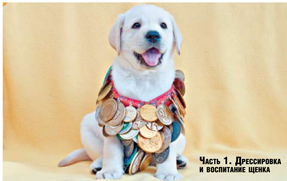
Часть 1. Дрессировка и воспитание щенка

Значительное увеличение количества лабрадоров в России привело к интенсивному поиску тестов и правил испытаний для определения того, насколько они соответствуют породной принадлежности и охотничьему предназначению.