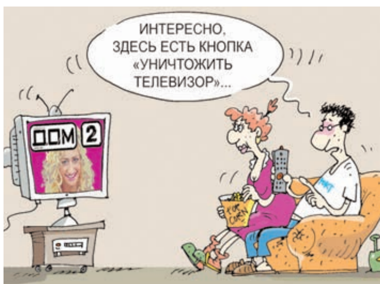
ИЛЛЮСТРАЦИЯ СЕРГЕЯ БЕДНОВА

Евгения Ханаева (5 звезд) «Розыгрыш», Вс, 11.15, ТВ-3