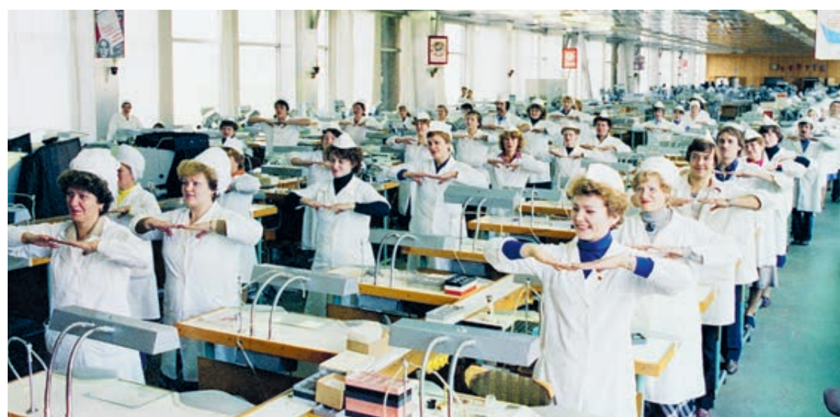
ФОТО ВФЕСТАВА УНДАСКИНА

В общем, налицо очередная имитация законодательской деятельности – шуму много, эффекта ноль.