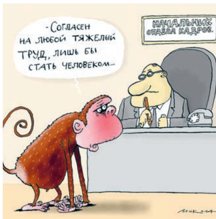
ИЛЛЮСТРАЦИЯ НИКОЛАЯ ВОРОБЬЕВА/САТОООНБАИ/РИ

На втором месте по популярности оказались онлайн-ресурсы. В целом по стране ими пользуется каждый третий соискатель, а среди молодежи – каждый вто-